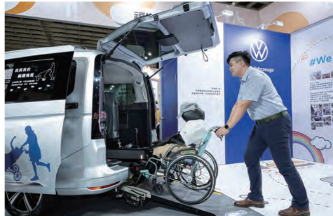
↑福斯商旅參展「ATLife 2024 臺灣輔具暨長期照護大展」，期能喚起大眾對無障礙移動議題的關注。

「小比圓夢號」由福斯商旅旗下Caddy Maxi 福祉車所打造，以其紮實底盤、安全配備和實用空間，成為去年同級車款銷售冠軍！其寬敞挑高的乘客艙、多功能的座椅配置，可輕鬆容納5名乘客及1名輪椅使用者。無論輪椅乘客時，後艙的兩張折疊座椅更可彈性調整，為完整的7人座MPV。「小比圓夢號」Caddy Maxi福祉車，採用德國AMF-Brunns的套件所打造，不僅帶來德國安全標準，還提供旋轉折疊椅等選配套件，讓車內空間能更加靈活運用，滿足5+1甚至7人座的多元需求。