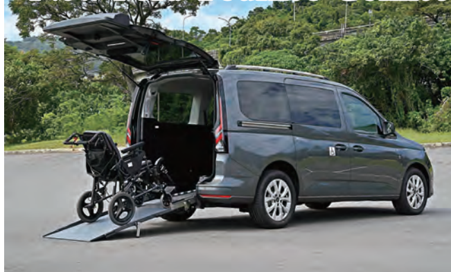
↑ New Ford Tourneo Connect旅玩家福祉車，滿足社會對於無障礙移動的需求。

New Ford Tourneo Connect旅玩家福祉車加入桃園地區服務行列