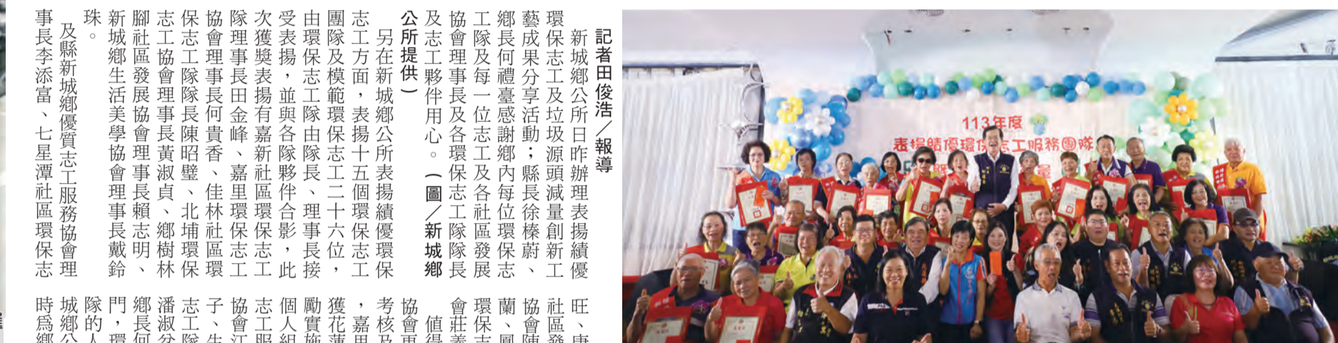
圖：新城鄉公所表揚績優環保志工，由鄉長黃發主持，多位鄉民代表及社區發展協會代表出席。

記者田俊浩/報導 新城鄉公所日前表揚績優環保志工，由鄉長黃發主持，多位鄉民代表及社區發展協會代表出席。表揚對象包括多位在環保領域做出傑出貢獻的志工。