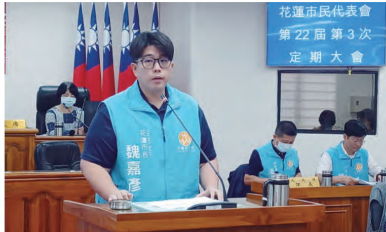
花蓮市民代表會第22屆第3次定期大會，市長魏嘉在記者會上表示，災後復甦是花蓮的重點，將透過各項建設，讓花蓮再次美麗。

記者張小菁/報導 花蓮市民代表會第二十二屆第三次定期大會，十三日上午開議，市長魏嘉在施政報告中表示，災後復甦是花蓮的重點，將透過各項建設，讓花蓮再次美麗。 魏嘉在施政報告中，將災後復甦列為重點，並提出多項建設計畫。他表示，災後復甦不僅是重建受損設施，更重要的是恢復花蓮的自然環境與人文特色。他提出將透過各項建設，讓花蓮再次美麗。 魏嘉在施政報告中，將災後復甦列為重點，並提出多項建設計畫。他表示，災後復甦不僅是重建受損設施，更重要的是恢復花蓮的自然環境與人文特色。他提出將透過各項建設，讓花蓮再次美麗。