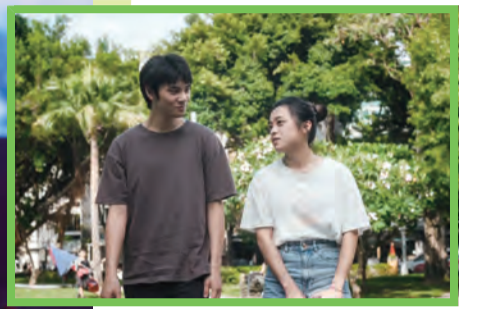
圖：新銳導演王凱民新片「蟲」拍出不同世代的台灣人在如影隨形的侵略陰影下，面對生活與未來的態度。