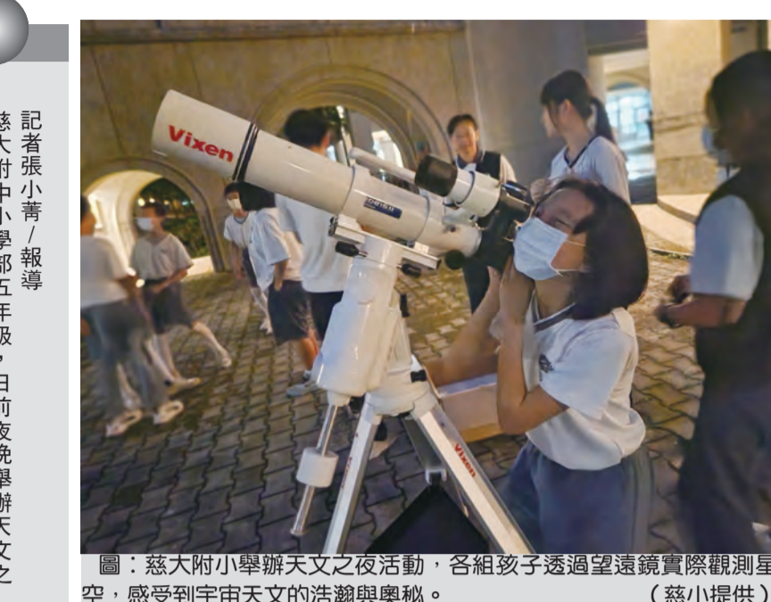
慈中學校長姊帶領慈小同學，認識八大行星、四季星空，並操作望遠鏡追星。

慈中學校長姊表示，天文活動不僅能激發學生對宇宙的興趣，還能培養他們的觀察力和動手能力。活動中，學生們在老師的指導下，通過望遠鏡觀察了木星、土星等行星，並了解了八大行星的特徵。此外，還介紹了四季星空的變化，讓學生們對天文知識有了更直觀的認識。