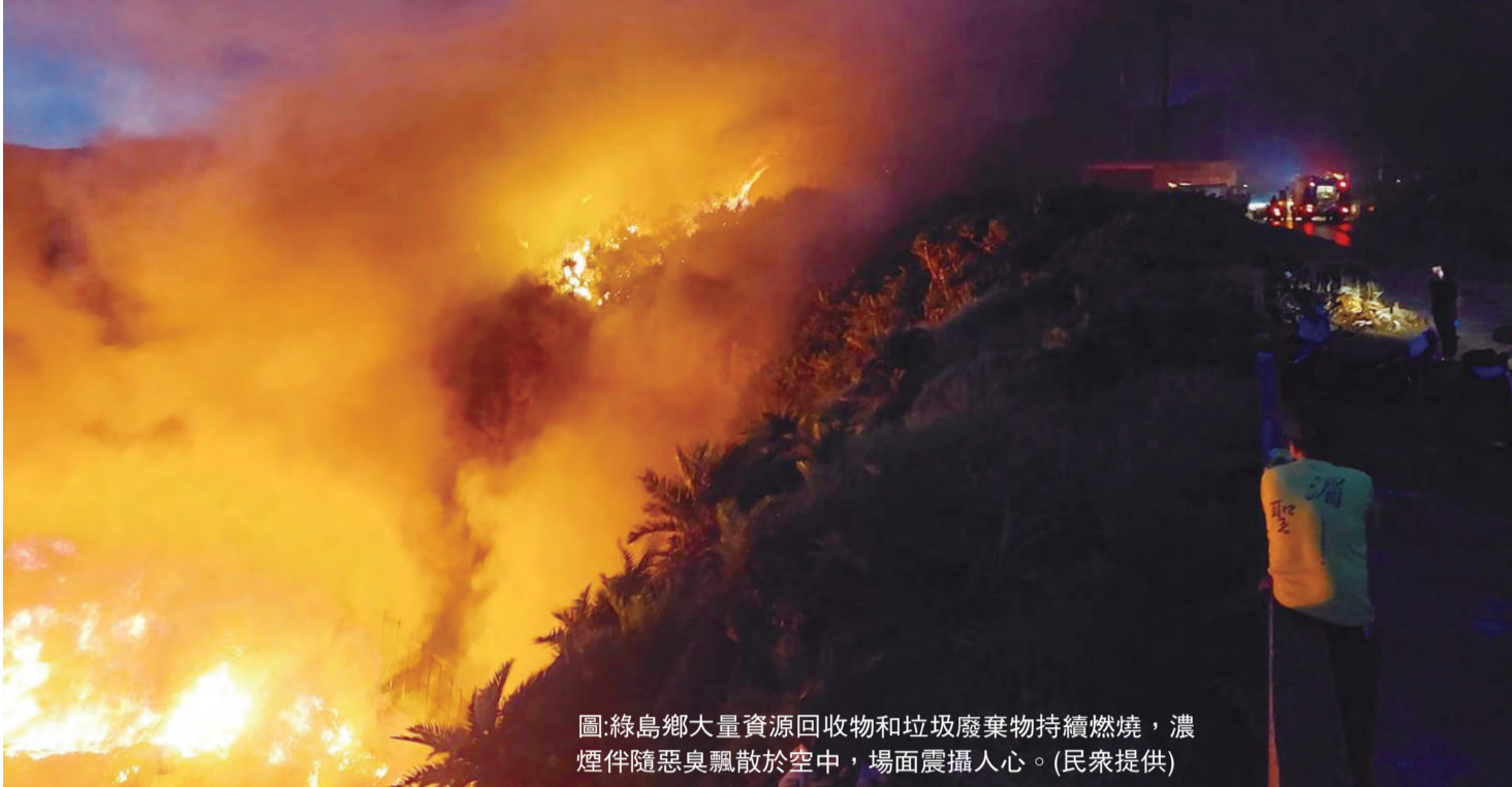
圖：綠島鄉大量資源回收物和垃圾廢棄物持續燃燒，濃煙伴隨惡臭飄散於空中，場面震撼人心。

記者蕭道田/報導 台東縣綠島鄉12日下午5時許，發生一起回收場大火，濃煙冲天，臭氣難聞。消防局接獲報案後，立即派員前往搶救。起火原因尚待調查，目前消防局已從本島加派人員前往支援。