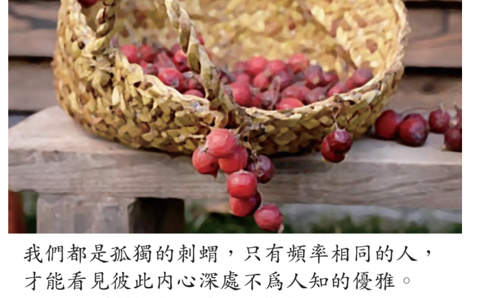
我們都是孤獨的刺蝟，只有頻率相同的人，才能看見彼此內心深處不為人知的優雅。 —《刺蝟的優雅》 妙莉葉·芭貝里

肉的努力跟放鬆，練習核心... 運動神經不發達又不會控制肌肉的我，雖然老師陸續教了我一些肌肉訓練或放鬆的技巧，但是還是不得要领。有時口令跟動作不太一致，加上自己習慣聳肩駝背等姿勢很壞。老師除了要帶著學生打報告接新案還有很多病人，有時也無法兼顧每個人。