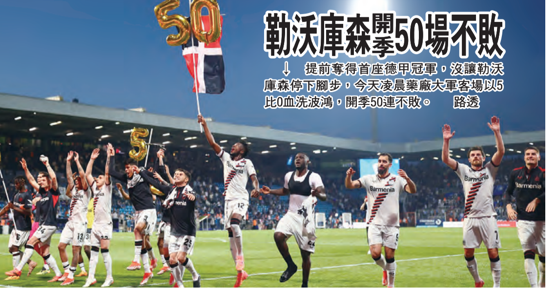
勒沃庫森隊慶祝50場不敗 提前奪得首座德甲冠軍，沒讓勒沃庫森停下腳步，今天凌晨萊茵斯威格爾球場以5比0血洗波鴻，開季50連不敗。路透