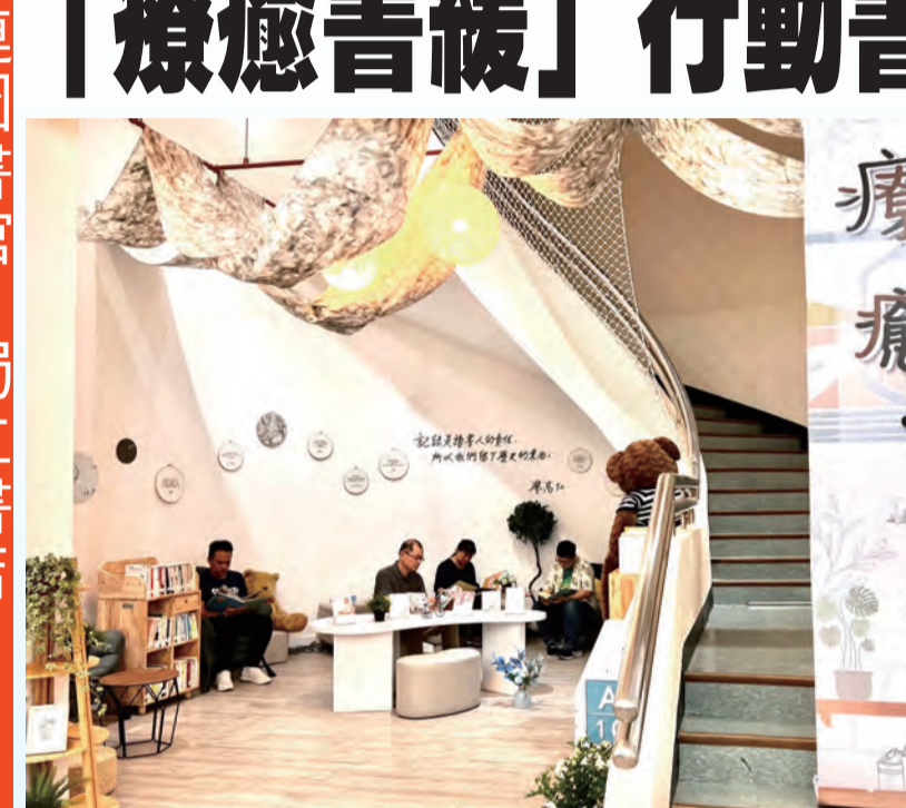
圖：「療癒書緩」行動書展，盼藉閱讀撫平震悸。

【本報記者張小菁報導】「療癒書緩」行動書展，盼藉閱讀撫平震悸。該書展由花蓮縣文化局主辦，旨在透過閱讀，幫助市民舒緩地震帶來的震悸。書展內容包括：《你很好》、《我愛你》、《你很好》、《我愛你》、《你很好》、《我愛你》等書籍。書展將於五月十日開始，地點為花蓮縣文化局。