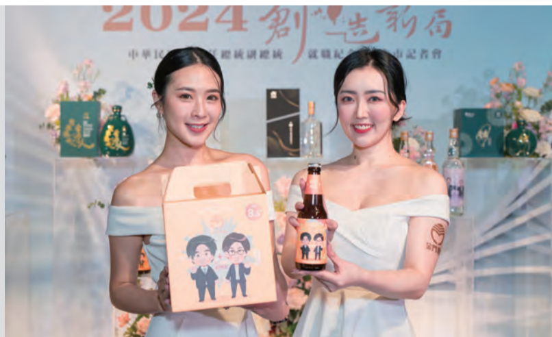
圖：520總統就職日將近，金門酒廠推出兩大經銷商一次推出9款紀念酒，規模堪稱歷年之最，其中包括Q版正副總統肖像精釀金門啤酒。