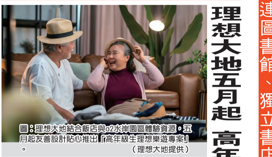
圖：理想大地結合飯店與o2水岸園區體驗資源，五月起友善設計貼心推出「高年級生理想樂遊專案」。

【本報記者張小菁報導】理想大地結合飯店與o2水岸園區體驗資源，五月起友善設計貼心推出「高年級生理想樂遊專案」。該專案提供高年級生一個舒適、安全、有趣的休閒空間。專案內容包括：入住豪華客房、呼吸新鮮純淨空氣、入住豪華客房、搭乘豪華遊覽車、細品中式養生晚餐或里拉自助晚餐、度過美好輕鬆的愉快假期。 凡每房有一位住客年滿六十五歲，即可享有平日住房九折優惠，加贈a2水岸遊船服務。a2水岸遊船服務，一泊二食，由豪華遊覽車接送，細品中式養生晚餐或里拉自助晚餐，度過美好輕鬆的愉快假期。