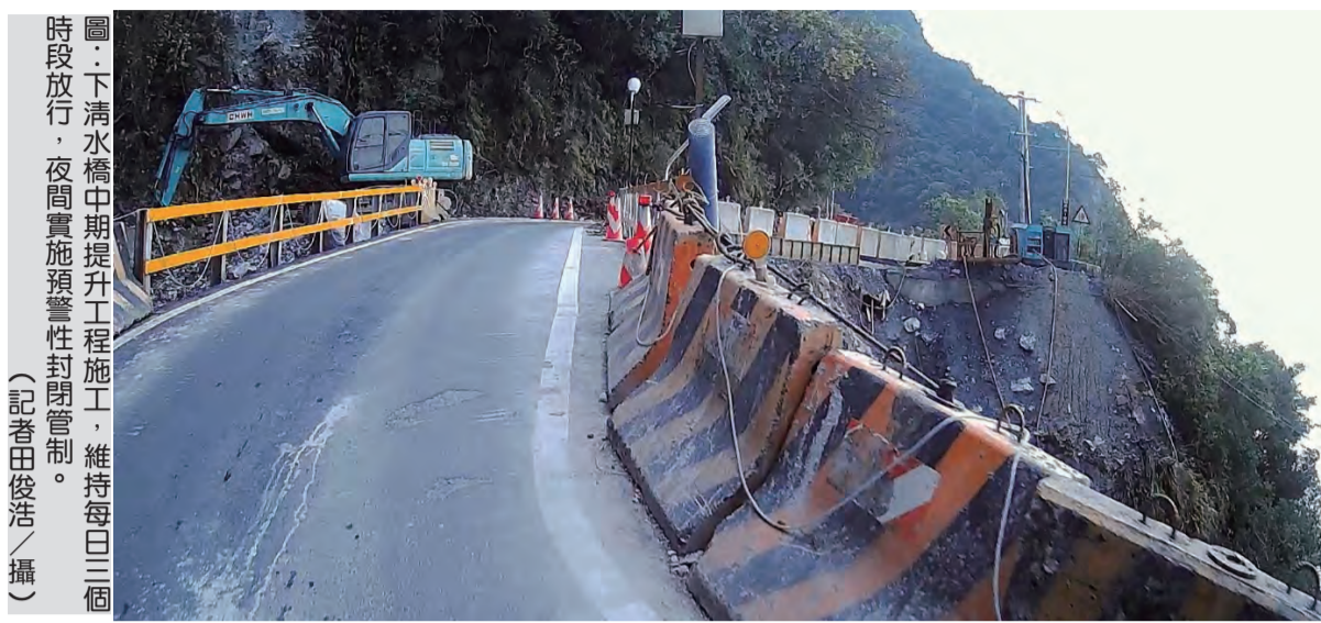
圖：下清水橋中期提升工程，維持每日三個月放車，夜間實施預警性封閉管制。

【本報訊】0403強震導致蘇花公路清水橋斷裂，口下的清水橋遭連連落石的巨石狀擊斷，東區養護工程分局正進行蘇花下清水橋中期提升工程，維持每日放行一至五時、六至八時、中午十二至十三時、傍晚十七至十九時三十分段放行，夜間實施預警性封閉管制。預計五月底增設貨櫃便橋供大型車通行，今年底完成橋梁復建。九日，花蓮縣議會多位議員也對五月底可望開放大型車通行，要求農業處等及早因應，觀光業者也期待交通管制及早解除，花蓮觀光才能加速復甦。