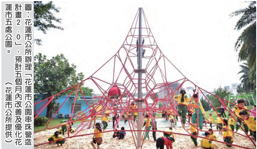
圖：花蓮市公所辦理「花蓮市公園串珠營造計畫2.0」，預計五個月內改善及優化花蓮市五處公園。

【本報記者張小菁報導】花蓮市公所為提升公園品質，改善市民休閒空間，將於今年五月起，對市內五處公園進行串珠式改善計畫。首波將於五月十日封閉施工，包括豐園區親子公園、長頸鹿親子公園、撒固兒國福養生休閒園區、中山公園及中山公園。其餘三處公園將於後續陸續封閉施工。 花蓮市公所表示，這五處公園分別是：撒固兒國福養生休閒園區、中山公園、中山公園、中山公園。改善計畫包括：增加遊樂設施、改善步道、增加綠化、增加休憩空間等。公所表示，改善計畫將以「安全、舒適、親子、休閒」為目標，打造優質的休閒空間。