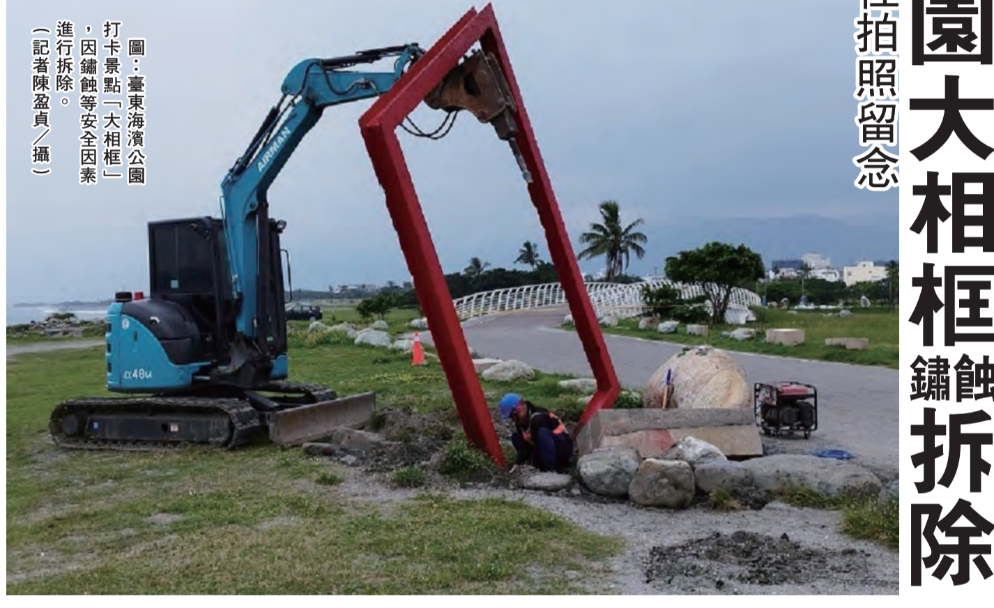
圖：臺東海濱公園「大相框」等安全因素，因鏽蝕等安全因素進行拆除。

海濱公園大相框鏽蝕拆除 民眾不捨前往拍照留念 記者陳盈貞/報導 台東海濱公園知名打卡景點「大相框」，因鏽蝕安全因素，公部門於九日進行拆除，另一件雕塑作品「海之頌」也因安全問題拆除，許多民眾這幾天特別前往拍照留念，直呼滿滿的回憶、相當不捨。 位於海濱公園的歪斜紅方框造型，以藍天白雲、蔚藍大海為背景，宛如明信片風景，讓「大相框」成為必拍景點；作者達悟族藝術家夏曼·瑪德諾·米斯卡（飛魚）說，這件作品創作超過二十年，本名為「千變萬畫」。 飛魚說，作品名為「千變萬畫」，希望民眾透過相框看出變化多端的海象和雲朵，天晴時亦能看見自己離開的家鄉。 他說，當年自己仍存一絲叛逆的心態，想著「我從關嶼走出來，要用力踩壞這個相框」，所以紅色鋼骨製成的相框因此被鏽蝕，原本下方還有石頭堆成腳掌狀，象徵要打破框架、自由的，想如何解釋都可以。 台東市長陳銘風表示，飛魚的作品「千變萬畫」、陳錦忠雕塑作品「海之頌」，創作都超過二十年，目前已有鏽蝕等安全疑慮，臺東縣政府要求公所需拆除，並於九日進行拆除作業，未來縣府將進行整體規劃。