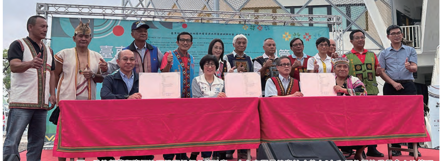
圖：為使部落與資源治理機關推行共管計畫，在台東縣長饒慶鈴（前左2）和原住民族委員會土地管理處處長張信良（前右2）見證下，中央、鄉鎮公所等機關與6個原住民部落9日簽訂合作意向書。

保障原住民土地權益 農業部林業及自然保育署台東分署、交通、成功鎮公所、達仁鄉公所、延平鄉公所、新化及重安等6個原住民部落簽訂合作意向書。雙方盼透過共管形成維護傳統文化與自然資源的夥伴關係，共同實踐保障原住民的土地權益、維持生活及延續文化，並促進土地的保護與永續利用。 饒慶鈴致詞表示，原住民傳統土地資源的運用管理，一直是政府部門與部落間認知落差上衍生紛爭的主要原因；原住民地區