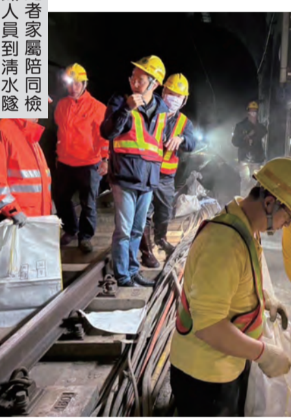
圖：罹難者家屬陪同檢警及台鐵人員到清水隧道清理遺骨遺物。

記者李柏霖/報導 台鐵公司五月八日發布聲明說，四〇八次事故後，部分家屬及受傷旅客曾反映，未能找到親人隨身攜帶的物品及行李，向相關單位表達希望能再次前往事故現場，仔細找尋，後臺鐵公司邀集花蓮地檢署、鐵路警察局(偵查隊、鑑識組)及家屬，於今年三月二十日，近日鑑定完成，臺鐵公司人員於五月七日前往花蓮地檢署專案辦公室，與犯罪被害人保護協會及花蓮地檢署人員就鑑定結果逐一通知家屬，及由花蓮工務段人員負責，內容包含後續處理(由臺鐵公司負責)及核對鑑定領回(由犯罪協會說明)等事宜，所有家屬均已通知完畢，臺鐵公司除全力配合家屬需求，也會依SOP妥善處理，並提供家屬相關的協助與關懷。