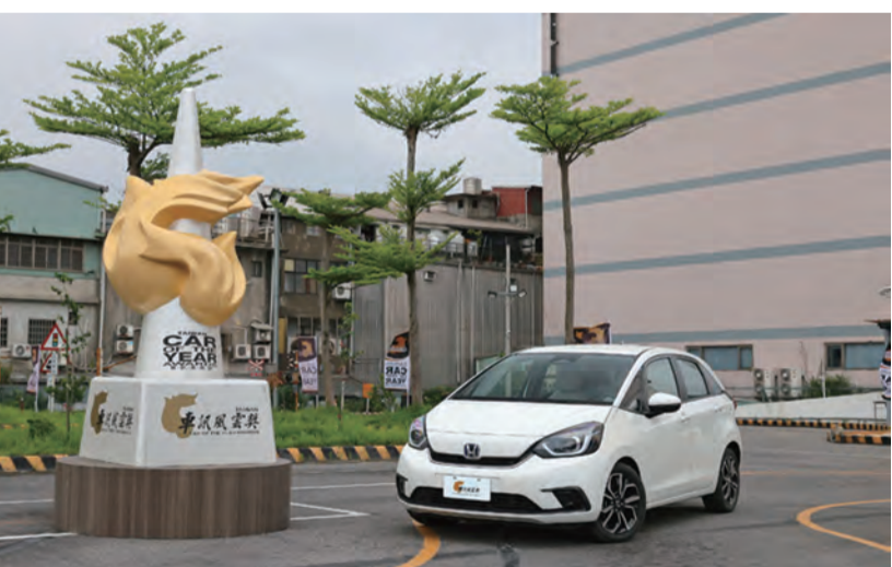
↑ Honda FIT連續3年蟬聯「最佳國產小型車」殊榮。

「2024車訊風雲獎」評選結果出爐，Honda勇奪三冠王榮耀，其中CR-V榮獲「最佳國產中型SUV」、FIT 3度蟬聯「最佳國產小型車」、CIVIC e:HEV榮獲「最佳進口中型車」的殊榮。