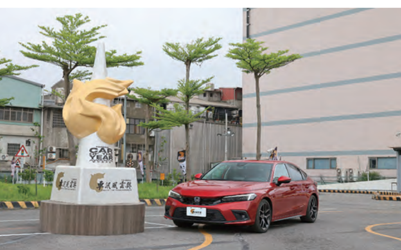
↑ CIVIC e:HEV勇奪「最佳進口中型車」殊榮。

歡慶Honda勇奪2024車訊風雲獎三冠王榮耀，全車系來店試乘送「Honda專屬家人隨行包」，再週週抽「雙向顯影輔助及多媒體娛樂影音系統」，FIT e:HEV再享「60萬高領0利率」，指定車型再享「360度全景系統」(S車型適用)；入主HR-V享「60萬高領0利率」、「360度全景系統」、「BSI盲點偵測系統」3大贈禮；入主FIT全車系享「50萬高領0利率」、「前後盲區輔助影音主機一合雙向顯影輔助及多媒體娛樂影音系統」，FIT e:HEV再享「10年/20萬公里電池保固」；入主CIVIC e:HEV享「100萬高領0利率」。