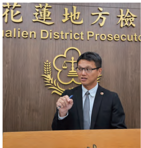
上圖：檢警與台鐵人員大陣仗到清水隧道內，針對水溝、縱線槽及避車洞等空間詳細檢視清理遺骨遺物。 左圖：花蓮地檢署主任檢察官蔡勝浩說明花檢與臺鐵公司共同完成大清水隧道內清理作業。

28件骨骸與11罹難者相符 針對水溝、縱線槽及避車洞等空間詳細檢視清理 花蓮地檢署主任檢察官蔡勝浩表示，花蓮地檢署為協助臺鐵公司確認大清水隧道內是否尚有罹難者遺骨或遺留物，乃於一三年三月十四日上午，由郭景東檢察長召集臺鐵公司、鐵路警察局、花蓮縣警察局等單位人員，共同研商後續清理作業，務求徹底完成清理及鑑識作業。後於同年三月二十日清晨八時四十分許，由王怡仁檢察官與各單位人員共同進入大清水隧道內，