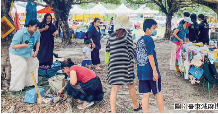
圖：臺東減廢慢生活節開放攤主報名中。

東大傑聯會掛牌回饋獎學金 即日起開放攤主報名 響應5/18 台東減廢慢生活 記者陳盈貞/報導 臺東縣政府將於五月十八日上午九點至下午三點，在臺東縣環保局旁草皮舉辦「二〇二四臺東減廢生活節」夏季熊版二手市集，號召環保團體踴躍報名設攤，開放報名至六月。 臺東縣政府表示，縣府在落實聯合國永續發展目標(SDGs)及環境保護上，不遺餘力，臺東減廢生活節在活動規畫上，除遵照「臺東減廢生活節」辦理外，更將環保教育結合教育活動，以豐富、多元的活動內容，邀請縣民利用行動實踐環保生活。此次活動預計將有近七十攤環保攤位，包含減少使用一次性塑膠餐盒、環保餐具、二手市集、適合親子活動的環保遊戲區及資源回收兌換站，現場也設有環保餐廚、環保局說明、資源回收兌換站部分，民眾攜帶廢棄物(需完成沖洗不殘留農藥)、廢乾電池(不包含鉛酸電池)、廢高壓電器及廢照明光源等活動攤位回收，達到指定回收量即可兌換市集消費券，兌換資訊搜尋臺東減廢慢生活粉專「https://reurl.cc/1hnx88」，報名連結「https://reurl.cc/1hnx88」，報名至五月六日止。 當天攜帶個人環保餐廚到現場參加減廢生活節的民眾，可至服務台兌換兩百枚TPUSH金幣，每人限兌換一次，數量有限，兌完為止，環保局歡迎民眾踴躍參與一年一度「臺東減廢生活節」以行動實踐環保。