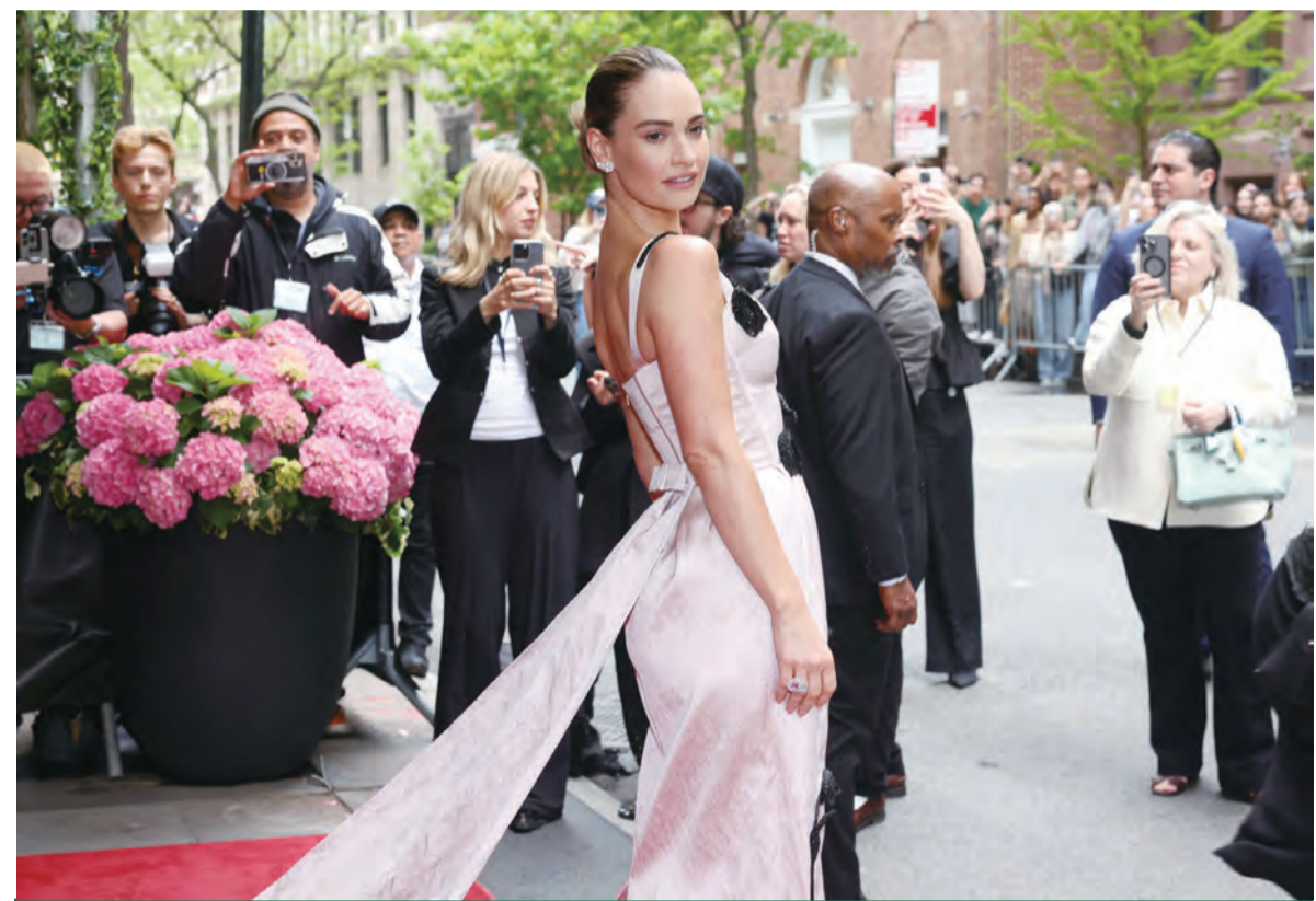
時尚界奧斯卡 星光熠熠 紐約大都會博物館慈善晚宴（Met Gala）5/6登場，舉辦大型募款活動，今年的主題是「時光花園」，英國演員莉莉·詹姆斯盛裝出席，成為鎂光燈焦點。