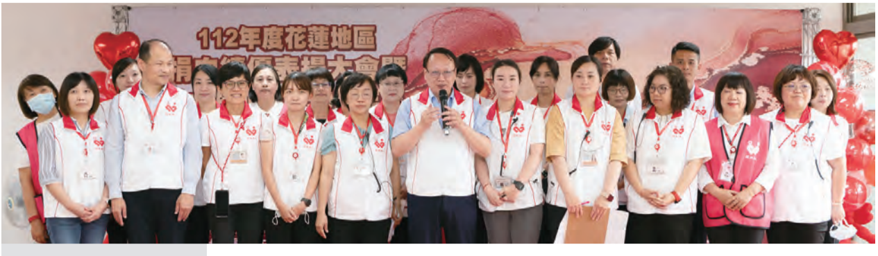
圖：一一二年度花蓮地區捐血績優表揚大會盛大舉行。

「一一二年度花蓮地區捐血績優表揚大會」，在個人捐血績優部分，全血捐血一百次以上計兩百人、分組捐血一百次以上計一百六十三人、獲獎紀念章者二十八人、獲獎紀念牌者四人。