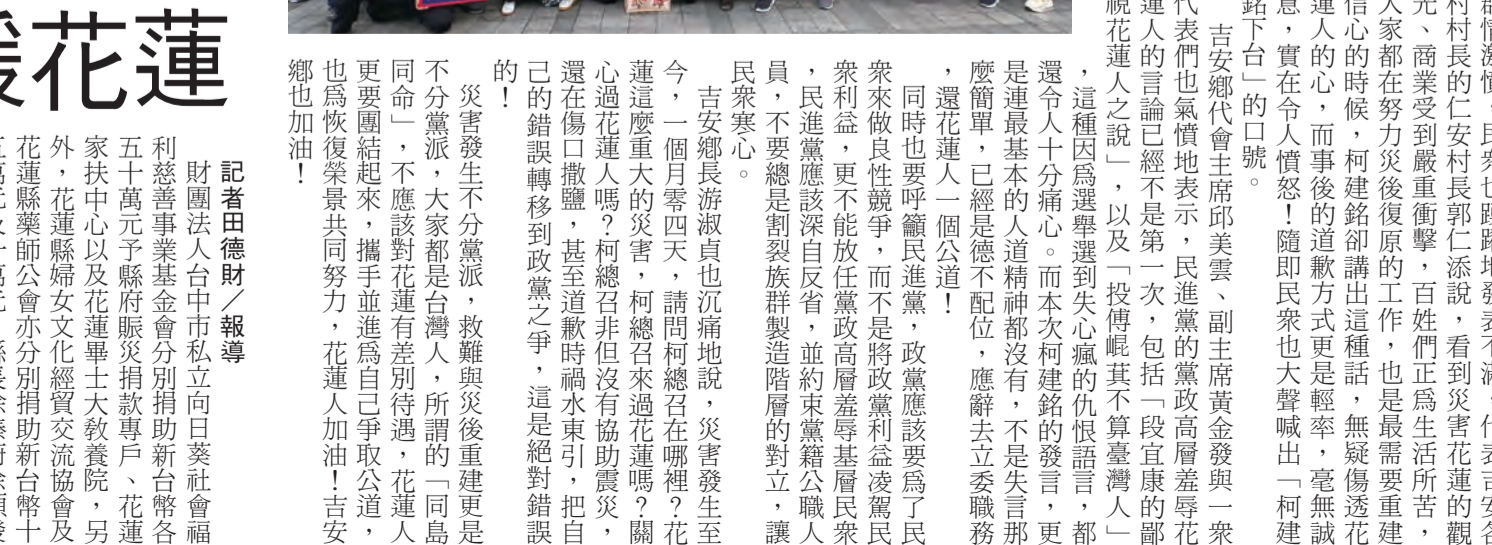
圖：花蓮縣政府感謝各界捐款賑災綜合照片。

全國各社團匯聚善心 馳援花蓮 記者田德財/報導 財團法人台中市私立向日葵社會福利事業基金會分別捐助新台幣各五十萬元予縣府賑災捐款專戶、花蓮家扶中心以及花蓮華山天主教教會，另外，花蓮縣婦女文化經濟交流協會及花蓮縣藥師公會亦分別捐助新台幣十五萬元及十萬元，縣長徐榛蔚上週發感謝狀，並代表花運縣親臨上週發的感謝狀，並代表花運縣親臨上週發的感謝狀。 縣長徐榛蔚表示，0403大地震震災雖然在善慶，但受創最嚴重大多都北區及大園閣山區，花蓮共有二十七件公共住宅共四十棟貼紅黃單，紅單有影響公共安全疑慮的建築，花運縣政府強制拆除拆除機具二十四輛來自外縣市兩台大型鋼牙機具二十四小時協助拆作業，效率非常高，目前正在拆除作業包括藍天麗池飯店、統帥大樓，影響交通動線部分仍請鄉親見諒。 徐榛蔚也提到，花蓮的鄉親很堅強，也很理性，花蓮的重建需要大量的經費，然而這些經費必須要靠重建條例，唯有重建條例在不影響中央各部會的預算之下協助災民重建其立法委員不斷在中央為花蓮所有鄉親來發聲，而在中央政府同意之前，縣府仍進一步一腳印、穩健踏實地推進各項重建工作，全力協助災民度過重建的難關。 0403花蓮地震後，花蓮縣政府成立重大災害民間賑災捐款專戶，截至七日下午三點時，總捐贈筆數三萬四五千筆，共募得五億四三二一多萬元，民衆湧入的大量愛心捐款，為的就是協助災民重建及儘速恢復正常生活。