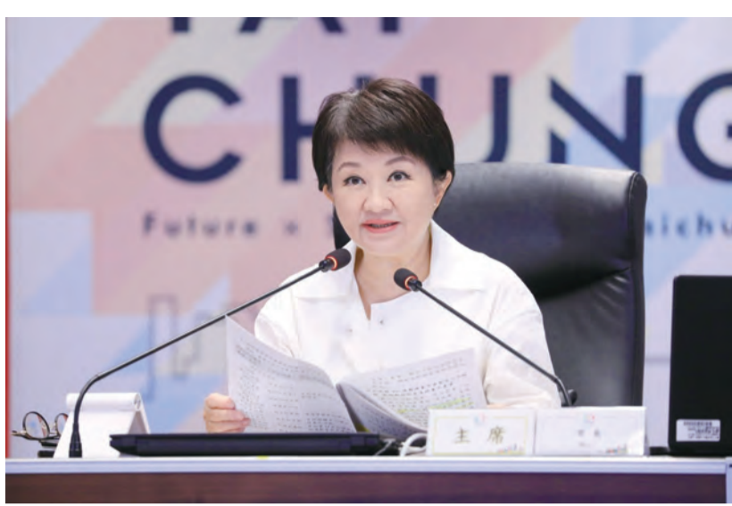
台中市長盧秀燕主持週二市政會議，九二地震二十五週年，這場世紀大地震，台中府將設「花蓮專區」提供農特產品設攤，並邀紙風車到花蓮演出。

台中市長盧秀燕主持週二市政會議，九二地震二十五週年，這場世紀大地震，台中府將設「花蓮專區」提供農特產品設攤，並邀紙風車到花蓮演出。 台中市長盧秀燕日前表示，九二地震二十五週年，這場世紀大地震，台中府將設「花蓮專區」提供農特產品設攤，並邀紙風車到花蓮演出。 台中市長盧秀燕日前表示，九二地震二十五週年，這場世紀大地震，台中府將設「花蓮專區」提供農特產品設攤，並邀紙風車到花蓮演出。