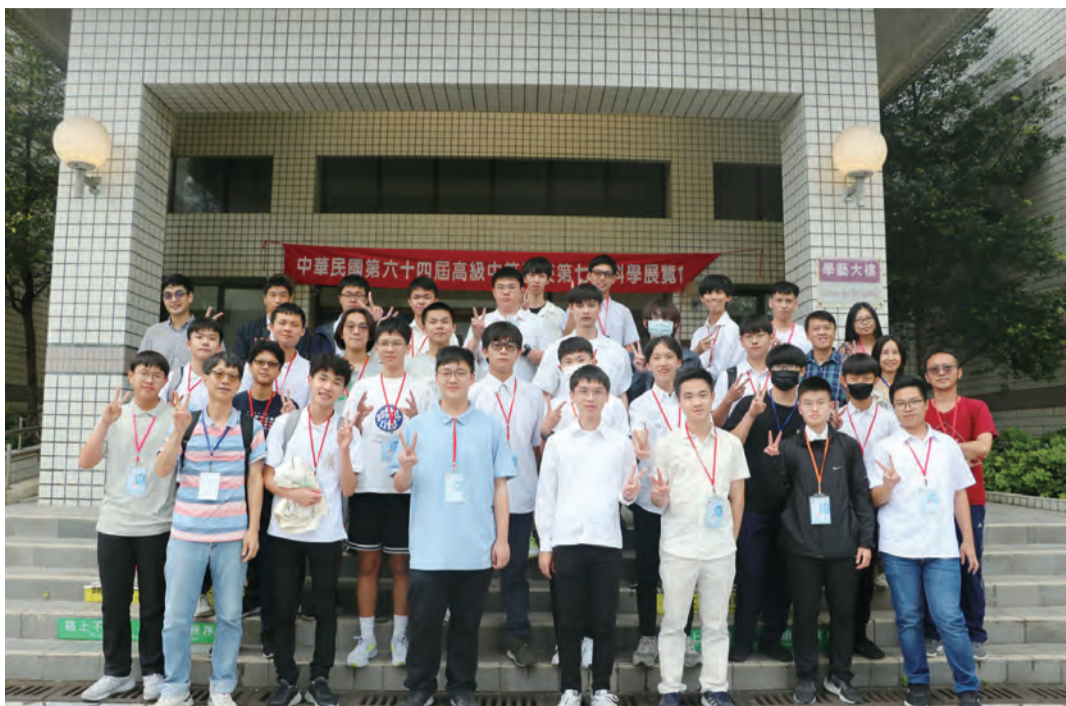
圖：國立花蓮高中參加東區科展榮獲五件特優，將代表進軍全國賽，蟬聯團體總冠軍，獲獎師生合影。