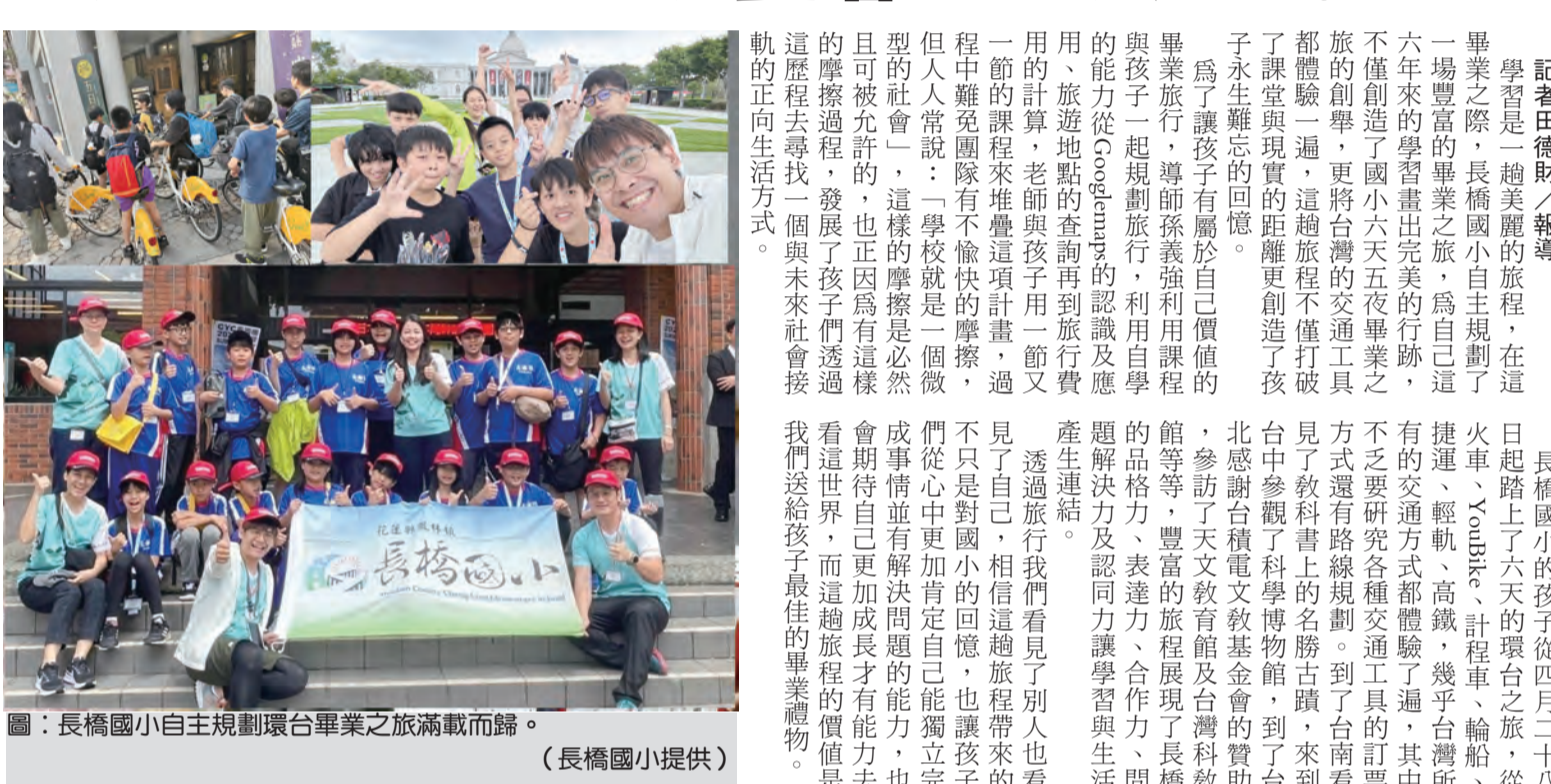
圖：長橋國小自主規劃環島畢業之旅滿載而歸。