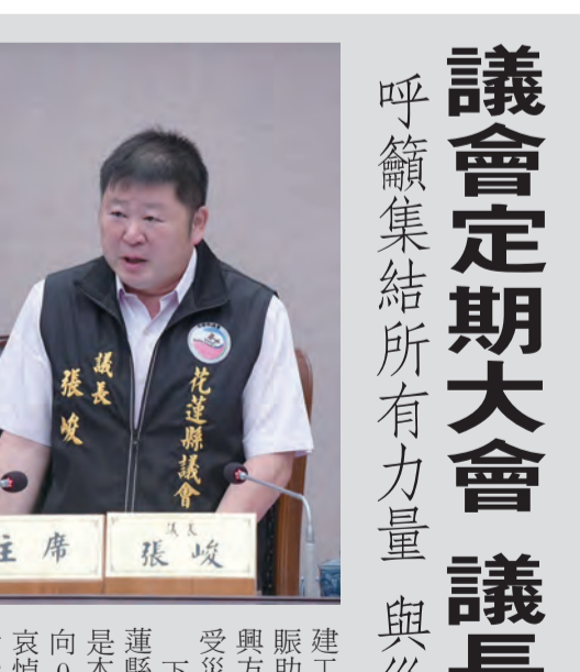
呼籲集結所有力量 與災民一起重建家園

【本報記者何國豐/報導】花蓮縣議會於六日上午召開第廿屆第三次定期大會，議長張峻（見圖）在會中提出施政報告，並呼籲災民集結所有力量，與災民一起重建家園。 張峻在報告中指出，此次地震對花蓮造成了嚴重的災情，災區同胞正為重建家園而忙碌。縣政府將全力投入災後重建，爭取早日恢復正常生活。 他還提到，縣政府將爭取中央政府的補助，加速震災復原。他呼籲社會各界伸出援手，幫助災民渡過難關。