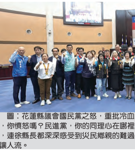
圖：花蓮縣議會國民黨之怒，重批冷血的柯建銘：花蓮人，你生氣嗎？花蓮人，你憤怒嗎？民進黨，你的同理心在哪裡？天災不代表老天有眼，這麼大的災難，連徐縣長都深深感受到災民鄉親的難過，日夜打拚為鄉親，而民進黨連滾都不讓人流。

「老天真眼，發生大地震」，這句失言，不僅是對災民的二次傷害，更是對黨綱的嚴重挑戰。花蓮縣議會國民黨團對此表示強烈不滿，認為柯建銘的發言極其冷血，完全缺乏同理心。 縣議員們表示，在災區同胞正為重建家園而忙碌的時候，柯建銘卻在立法院大放異彩，這種行為簡直是火上澆油。他們要求柯建銘公開道歉，並嚴正警告黨內同仁，不要在災難面前搞政治。 國民黨黨團總召傅聲遠也對柯建銘的失言表示遺憾，並要求賴清德出來道歉。他強調，黨內同仁應該在災難面前團結一致，而不是互相攻擊。