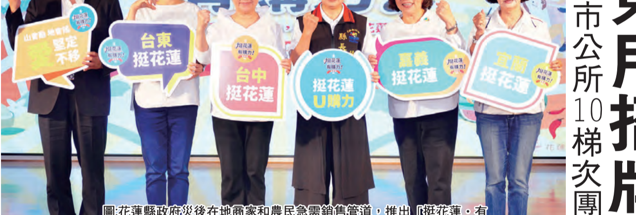
圖：花蓮縣政府災後在地商家和農民生產銷售管道，推出「挺花蓮·有膽力」網站，希望為花蓮的優質產品提供一個平台。(台東縣政府提供)

記者蕭道田/報導 0403地震對花蓮造成很大的衝擊，花蓮縣政府災後在地商家和農民生產銷售管道，推出「挺花蓮·有膽力」網站，希望為花蓮的優質產品提供一個平台，並於5日召開記者會。臺東縣長饒慶鈴等4位女性縣市長也出席力挺。