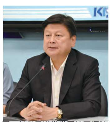
圖：針對民進黨黨團總召柯建銘於立法院司法及法制委員會之嚴重失言，國民黨黨團總召傅聲遠表示，對其失言最難過的是，對災民及對人民最難過的是，對災民及對人民最難過的是，對災民及對人民最難過的是。

的天災地變都由花東人民長期默默承受。過去經歷二○一八年的○二○六大地震、○二〇二一年的○九一八八大地震、而本○二二〇二〇三大地震、十八人不幸罹難，同時正在為如何安置及重建災區而奮鬥。 傅聲遠指出，在災區人民如此痛苦當中的時候，卻有民進黨黨團總召柯建銘把災難當成政治攻防的資本，甚至還以戲謔的口吻表示：「好在今年三月三天有眼發生大地震，讓原先在四月三日三天有眼發生大地震，讓原先在四月三日三天有眼發生大地震。」 傅聲遠表示，民進黨黨團總召柯建銘在立法院司法及法制委員會的失言，不僅是對災民的二次傷害，更是對黨綱的嚴重挑戰。他要求賴清德出來道歉，並嚴正警告黨內同仁，不要在災難面前搞政治。