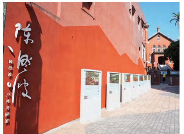
陳澄波戶外美術館