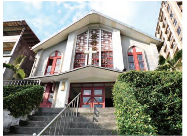
法蒂瑪聖母朝聖地