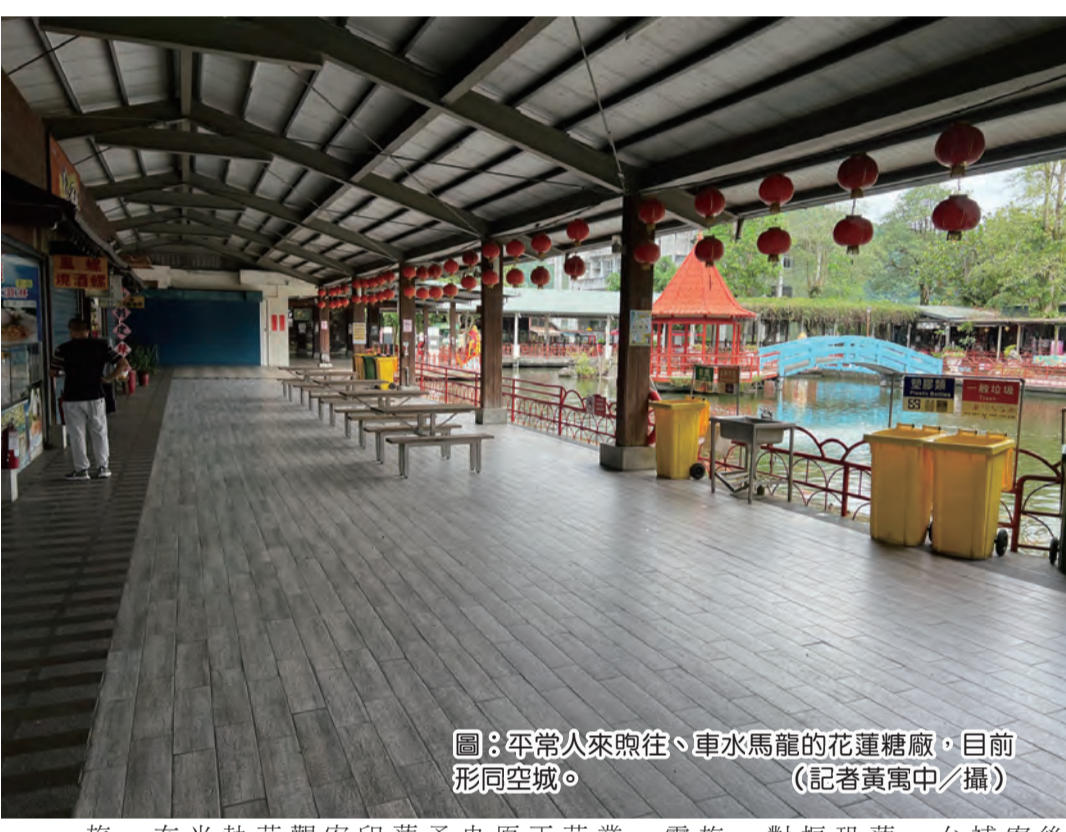
圖：平常人來往、車水馬龍的花蓮糖廠，目前形同空城。

記者黃萬中/報導 〇四〇三地震後，滿目瘡痍的北區觀光旅遊業受災嚴重，未受到嚴重災害的中南區觀光旅遊業也陷入一片蕭條的境地，花蓮觀光糖廠住宿率不到一成，南區溫泉旅館住宿率甚至於零，業者欲哭無淚，懇切呼籲政府觀光旅遊振興方案確實能讓他們起死回生。 〇四〇三地震後不但讓中橫、蘇花公路及北迴鐵路交通受阻，花蓮市區多棟建築也受到嚴重災害，滿目瘡痍，整個政府的觀光全部投入在救災上，再加上四月廿二到廿三日的連續一個週末的餘震，也讓北區觀光旅遊業全面停擺，業者哀鴻遍野。 由於交通不便加上民眾對地震的恐懼感，震後外地遊客對花蓮興趣不減，但中南區觀光旅遊業也陷入一片蕭條的境地，各地各行各業也陷入一片蕭條的境地，各知名景點形同空城，比之開門的支出比營業還要高。新區觀光旅遊業者包括旅館、溫泉飯店、觀光景點、餐飲、農特產品業者，〇四〇三後整個觀光業陷入谷底，觀光景點每天虧損等不到三天，兩兩的在地遊客，多至零，業者欲哭無淚。 交通部宣布〇四〇三震後觀光補助七月上路，中南區觀光業者知悉後一則以喜一則以憂，喜的是政府震後振興觀光補助方案終於上路，憂的是補助方案把宜蘭、台東、花蓮縣對內、對外遊客對於花蓮地產農特產品、恐怕外地遊客利用振興觀光補助到相對比較安全的宜蘭、台東、花蓮觀光旅遊業反而無法分潤。 有南區觀光旅遊業者表示，七月份花蓮對外交通恢復正常，災區震後復原工作也完成，中央及地方政府應給予外縣市民眾到花蓮旅遊絕對安全的印象，讓外地遊客安心到花蓮旅遊，觀光補助方案中，花蓮應列入重點執行縣市，花蓮觀光旅遊業者才不能在觀光補助中受益，才能讓花蓮觀光旅遊業者起死回生。