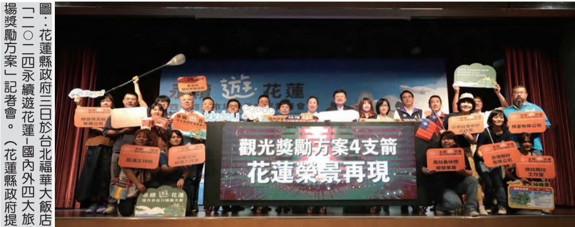
圖：花蓮縣政府三日於台北福華大飯店舉行「二〇二四永續觀光振興方案」公報發布會。

記者田德財/報導 花蓮縣政府三日於台北福華大飯店舉行「二〇二四永續觀光振興方案」公報發布會，由縣長徐榛蔚主持，邀請國內外旅遊界、觀光界、交通界、住宿業、餐飲業、零售業、文化創意產業等代表參加。徐縣長表示，此次發布的「二〇二四永續觀光振興方案」，是縣府在經歷九二一地震後，為振興花蓮觀光、帶動旅遊復甦而提出的重要政策。方案共分為四大箭齊發：一、國內外旅行團獎勵，二、自由行住宿抽稅，三、國內外機票抽稅，四、國內外旅遊保險補貼。徐縣長表示，這些措施將從五月十日起正式實施，預計將為花蓮觀光帶來巨大的增長動力。