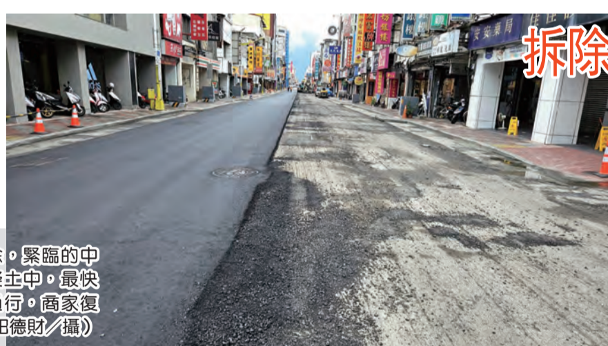
圖：富凱飯店拆除，緊臨的中山路鋪設青混泥土中，最快今天可以恢復通行，商家復業。