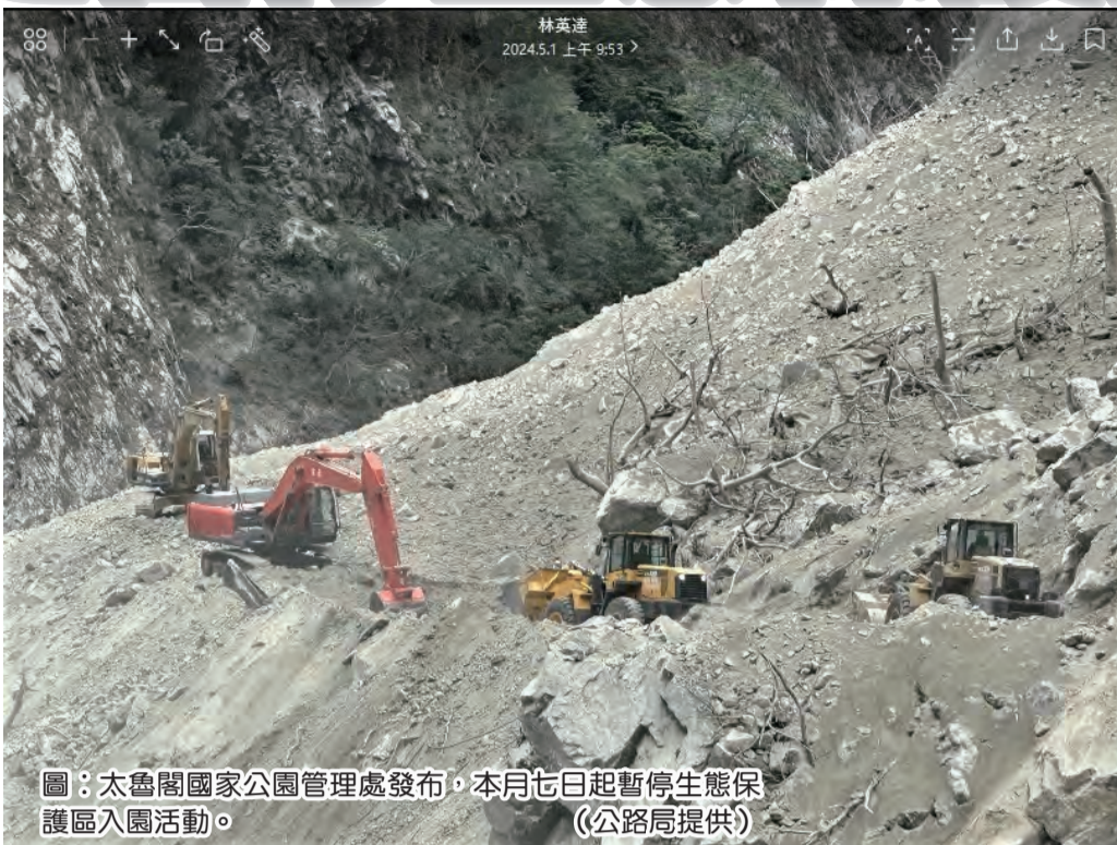
圖：太魯閣國家公園管理處發布，本月七日起暫停生態保護區入園活動。(公路局提供)

太魯閣國家公園管理處指出，災害防救法、申請進入太魯閣國家公園生態保護區許可注意事項第七條公告事項：因受到「〇四〇三」及「〇四二二」地震影響，餘震未歇且中橫公路落石不斷，山區土石鬆動及近日梅雨鋒面接近，除中央氣象署資料顯示，將有局部性強降雨發生導致土石流發生機率高，為維護山友安全，暫停開放該處生態保護區及其他管制區域入園活動，非必要請避免進入山區活動。 太魯閣國家公園管理處表示，這次預計封閉期間為本月七日上午八點至本月二十一日上午八點止，封閉期間原已核發的入園許可證，依一進入玉山、太魯閣、雪霸國家公園生態保護區申請許可作業須知第五條的規定應予廢止，俟鋒面遠離與餘震歇息後該處將派員巡視各路線，在安全無虞的情況下，再行恢復受理入園活動。 太魯閣國家公園管理處說，有關天氣預報、土石流及大規模崩塌防災資訊，敬請山友關注交通部中央氣象署網站以獲取相關資訊。