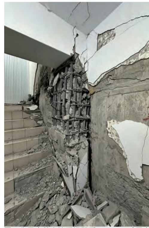
圖：馥邑京華大樓受損嚴重。

記者田德財/報導 花蓮市馥邑京華大樓六樓因強震受損嚴重，技師建議A棟拆除。據悉，該大樓在九二一地震中受損嚴重，特別是A棟的結構損傷極為嚴重，存在嚴重的安全隱患。技師在現場勘察後，建議對A棟進行拆除，並對其他樓層進行加固和修復。目前，拆除工作正在積極進行中。