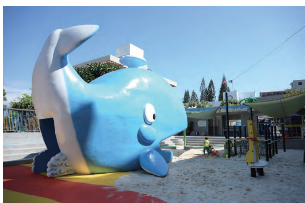
圖：花蓮市花崗山親子戲沙池完成安檢及改善工程，即日起正式對外開放。

記者張小菁/報導 沙池完成安檢及改善工程，即日起正式對外開放。花蓮市長魏嘉彥表示，有非常多的民眾期待，終於準備好換上新裝要對外開放，歡迎小朋友來花崗山戲沙池體驗玩沙的樂趣。 花崗山親子戲沙池擁有大沙坑，還有許多共融遊具，包括最具標誌性的大鯨魚隧道，以及各種色彩繽紛的攀爬設施。在這次的維修工程中，也針對地墊和帆船造型搖搖樂，打掃重新組帆造型搖搖樂，打造豐富又充滿趣味的遊戲空間，要讓小朋友可以盡情放電。 全台十大親子遊樂場 花崗山戲沙池原為市立花崗游泳池，是許多老花蓮人的回憶，但由於設備老舊不符合法規，經由活化改建為市區首座共融式遊樂設施，以海洋為主題，在遊玩之中納入海洋教育理念。一〇八年啟用後廣受民眾喜愛，更曾獲知名部落客推薦全台十大親子遊樂場，並在二〇二二年為進行兒童遊樂場安全檢驗而暫時封閉。 花崗山親子戲沙池自即日起每天下午四點至八點對外開放，每週一休息。另因應日照時間，每月的十一月至隔年三月，開放時間則將調整為下午三點至七點。 市公所提醒，兒童使用戲沙池設施，敬請家長全程陪同，維護孩子安全。禁止追跑碰撞，並請配合進入戲沙池時不穿鞋、不飲食，若有不當使用或有危險行為時，也請立即制止。相關詳情和損壞通報，請洽花蓮市公所財政課(03)832141。