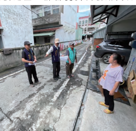
圖：富里鄉長江東城視察各村環境清潔，每月輪迴到各村進行大掃除，並辦理社區環境品質競賽，也十分關心地方基礎建設。(圖/富里鄉公所提供)

富里鄉10條道路老舊破損 將進行改善 富里鄉10條道路老舊破損 將進行改善 記者黃富中/報導 富里鄉長江東城二日全鄉性檢視道路路況，發現有十條道路老舊破損、龜裂情形，為民衆行路安全及生活品質，江東城責成主辦課進行改善，預計兩個月內就可進行施工。 (圖/富里鄉公所提供) 富里鄉長江東城視察各村環境清潔，每月輪迴到各村進行大掃除，並辦理社區環境品質競賽，也十分關心地方基礎建設，他藉著社區大掃除巡視全鄉的道路路況，路面若有重大破損，隨即予以修復。 最近接到來自不同村民的反映，指出多條道路路面不良甚