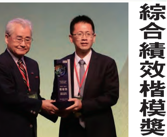
綜合績效楷模獎 裕隆汽車脫穎而出 今年，裕隆汽車不僅連續10年榮獲公司治理評鑑前5%，裕隆亦透過多角化經營，將永續理念延伸至核心本業與新業務，除了今年開始量產及販售的電動車n7，亦於2022年開始投入儲能事業，期望協助穩定供電品質、提升電網韌性。 在環境永續方面，裕隆汽車於2023年捐贈7318坪新店綠湖公園，期望吸收二氧化碳以調節都市氣候、降低都市熱島效應；並於三義廠區擴建500坪成立「裕苗山丘」台灣原生林復育中心，與臺灣山林復育協會合作，積極復育臺灣淺山原生樹種木、保存天然林基因庫，促進樹種多樣性。此外，裕隆亦發展再生能源，累計至2023年已於三義廠區布建15.38MW發電量，並積極推動廠區運具電氣化、資源循環零廢棄等減碳行動的行動方案，具體實踐友善環境與永續資源的ESG行動。

記者李秉添、蔡宛玲/台北報導 裕隆汽車積極響應淨零目標，致力打造共融社會，實踐永續發展目標，榮獲「遠見雜誌」第20屆ESG企業永續獎「綜合績效獎」(傳統產業組) 楷模獎殊榮。昨(2)日舉行頒獎典禮，裕隆汽車副總裁代表出席，由行政院長毛治國頒發此殊榮予裕隆汽車。(見圖) 裕隆汽車表示：榮獲「遠見ESG企業永續獎」，不僅是肯定裕隆汽車在ESG政策與實務上有著全面的優秀表現，而是給予經濟、環境與社會的責任與承諾。未來，裕隆汽車也將持續檢視與精進各項議題，將「人、車、生活」的核心理念轉化為動能，努力朝著永續經營的目標前進。