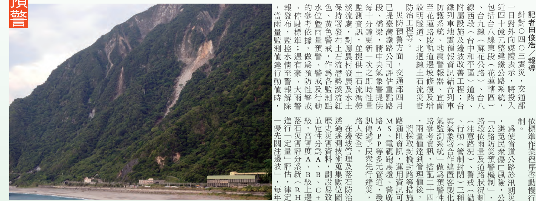
圖1：0403強震及0422連續餘震影響重創和仁至崇德間土石流區一山體崩塌

記者田俊浩/報導 針對0403地震，交通部一日對外向媒體表示，將投入近四十億元整建鐵路公路系統，包括台八線東段(花蓮轄區)、台九線(蘇花公路)、台八線西段(中和平區)道路、附屬設施及邊坡改善工程；台鐵列車地震預警系統結合列車防護系統、地震警報器、宜蘭至花蓮路段軌道邊坡修復及增設明隧道、北迴線土石流災害防治工程等。 交通部表示，交通部四月已提臺灣鐵路公司評估重點路段、橋梁，請中央氣象署提供每十分鐘更新一次之即時雨量監測資訊，並提供土石流潛勢溪流、黃色警戒、作為各監測點水位暨雨量預警、警戒及行動參考依據，做為預防性警戒、停駛標準；遇有豪、大雨警報發布，監控水位至警戒解除，當雨量監測值進行動值時，「優先關注邊坡」，每年汛期前至依標準作業程序啟動慢行或停駛機制。 為使省道公路於汛期災害發生時，避免民眾傷亡風險，公路局制定「公路防災預警機制」，各級公路(路段)依雨量及道路狀況劃分為注意、警戒(管制)三種等級。並與氣象署合作建置客製化(劇烈天氣監測系統)做為預警性封閉、封鎖參考資訊，搭配二十四小時監視，雨量值達到管理值後，將採取封閉封鎖措施，同時道路閉塞資訊，運用資訊可變標誌(CMS、電視馬路燈、警廣及幸福路路A P P等多元管道，發布道路資訊傳遞予民眾先行避災，以維護用路人安全。 在邊坡管理及土石流防治策略，係透過遙測技術蒐集數位圖資及分析歷史災害資料，劃設易發災路段，並進行「一定量」評估，律定出高風險、當雨量監測值進行動值時，「優先關注邊坡」，每年汛期前至