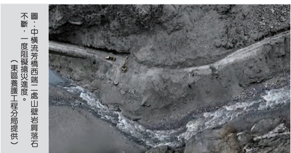
圖：中橫流芳橋西端二處山壁岩層落石不斷，一度阻礙搶修進度。

記者田俊浩/報導 〇四〇三強震及〇四二二連續震影響，中橫途經多處落石，中橫八線流芳橋一處山壁再度持續崩塌，落石及坍方，再度電力搶修進度及大魯閣搶修進度，正努力搶通道路中，並於昨晚五時三十分，搶通後至下午六時三十分，開放天祥地區民生需求通行，災區現場將由搶修團隊持續進行邊坡警戒監看，並於晚間七時過後進行夜間封閉。