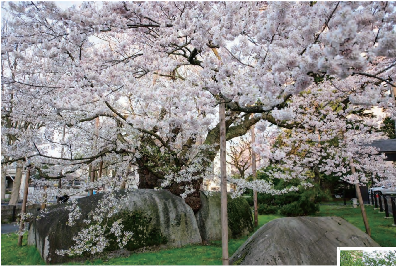
廣告中這棵櫻花樹具有石破天驚的景象，位於盛岡地方法院的腹地內，櫻花盛開時與未開時的景象讓人感受到無窮的生命力。

以超過360歲的石割櫻依舊盛開了美麗的花朵 安慰災民「往日安定的生活必然會回來」