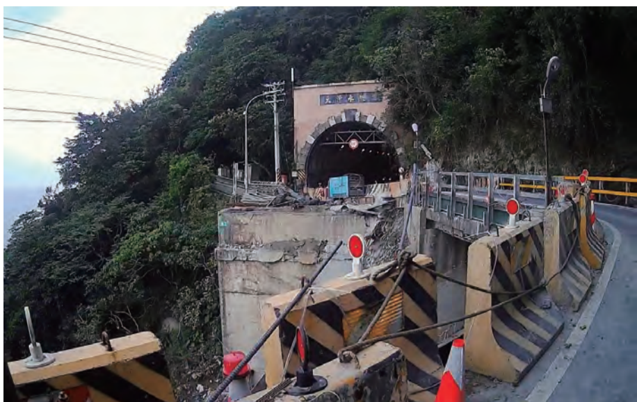
圖：下清水橋中期提升工程施工，維持每日三時段放行，夜間實施預警性封閉管制。

中期提升工程施工維持每日3個時段放行 增設貨櫃便橋供大型車通行 年底完成橋梁復建