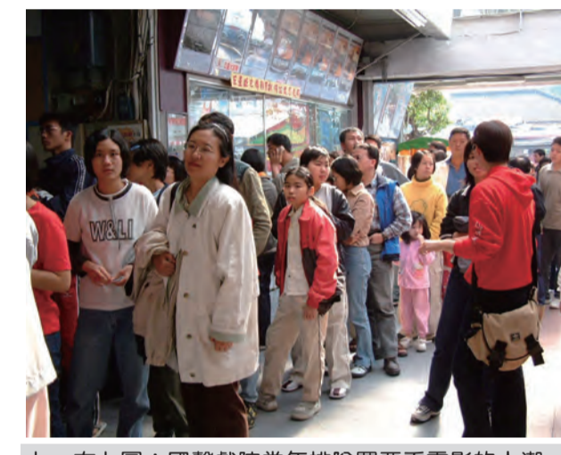
圖：當年國聲戲院如今成為家樂福超市。