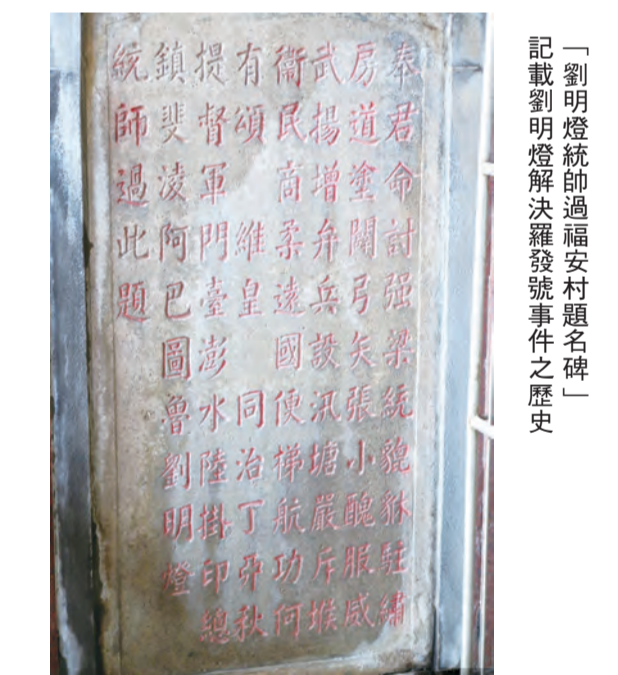
「劉明燈統帥過福安村題名碑」記載劉明燈解決羅發號事件之歷史