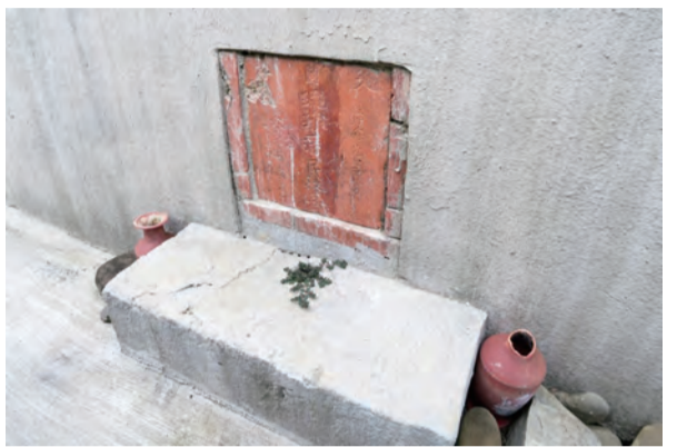
「大日本琉球藩民五十四名墓」由保力庄長楊友旺等人移葬於統埔村墳址

值小節，我由新竹南下枋寮，準備進行「牡丹社事件」之相關歷史踏查，期待能更深度瞭解這會於島之南發生過的歷史事件。 「琅嶠」為恆春地區的舊名，過去這裡居住著多元的族群，以排灣族為多數，兼有閩南與客家族群，東海岸知本地區的卑南族其後也遷居於此；他們自稱為「斯卡羅」，其下有豬寮社、射麻里社、龍鑾社、貓仔社等四大番社，從清代至日治初期，斯卡羅曾是琅嶠地區最強大的勢力者，有著相當的影響力，在他們勢力下的十八個番社，即被統稱為「琅嶠十八社」。 我往車城方向前進，沒有多久便到達車城的「福安宮」，福安宮旁有許多小販正在販售洋蔥、紅豆等農產品，相當熱鬧。福安宮是車城地區的信仰中心，也是當地最早發展的漢人聚落，這裡的居民多為福佬客；而車城之緣故，則與牛車加強抵禦。 傳說福安宮的福德正神曾幫助福康安平林爽文之亂，福康安也特別奏請乾隆，乾隆皇帝即御賜一頂與神衣一件加以敕封，這就是福安宮的福德正神為何頭上有官帽的原因。這些歷史就記載於廟前的一嘉勇公福康安頌德碑，嘉勇公即是福康安，車城居民大多稱此碑為「福公碑」。在福公碑對面為一劉