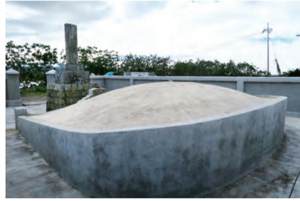
墓塚為土饅頭形狀的「大日本琉球藩民五十四名墓」