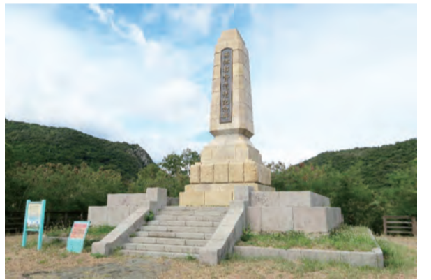
「西鄉都督遺蹟紀念碑」後方即是石門天險