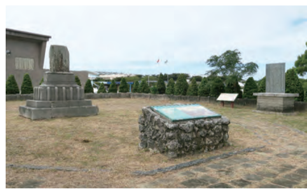
牡丹社事件「日軍營址紀念碑」