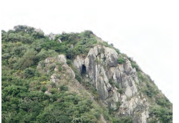
黑色洞穴據說是原住民藏匿槍枝與大石塊之處