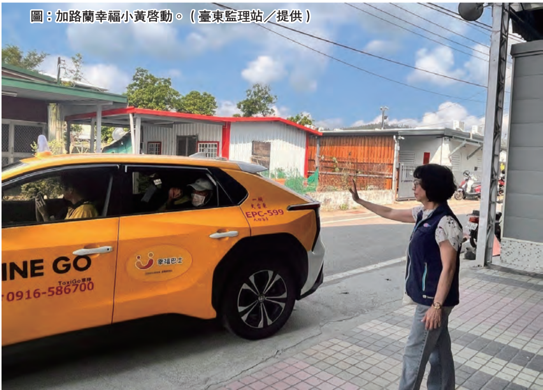
圖：加路蘭幸福小黃啟動。(臺東監理站/提供)

記者陳盈貞/報導 為鼓勵鄉親踴躍搭乘幸福小黃，高雄區監理所、臺東監理站、臺東縣政府及臺東市公所攜手於三十日上午，在加路蘭活動中心辦理「加路蘭幸福小黃-生活品質UP」一日免費搭乘體驗活動，期滿足部落鄉民「行」的需求。