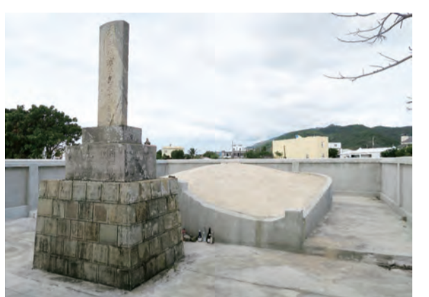
「大日本琉球藩民五十四名墓」安葬有54位琉球居民