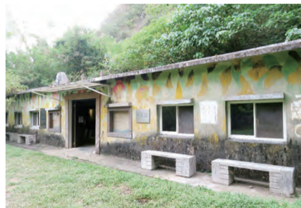
石門古戰場旅遊資訊站內展出許多牡丹社事件的珍貴照片