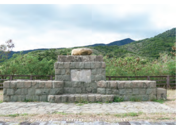
目前僅剩下基座的「忠魂碑」