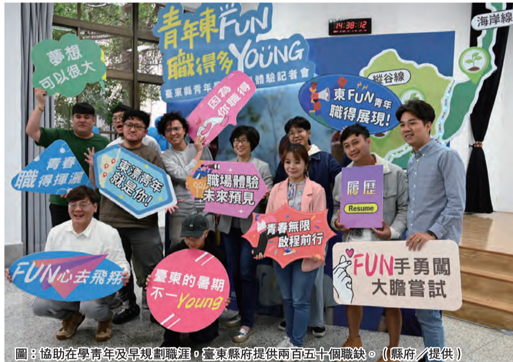
圖：協助在學青年及早規劃職涯。臺東縣府提供兩百五十個職缺。(縣府/提供)

記者陳盈貞/報導 為協助在學青年及早規劃職涯並創造職涯發展機會，臺東縣政府去年推出「青年暑期職涯體驗」計畫備受關注，今年計畫再度開辦，縣府整合縣內職場體驗資源，共計提供兩百五十個職缺，五月一日起開放報名至六月十四日止。 縣長饒慶鈴表示，縣府致力結合各方資源，持續推動青年職涯發展計畫，幫助青年找到有興趣的工作，另一方面也為臺東新興產業、非營利組織對接人才，為在地產業及社區發展注入新活力。 「青年暑期職涯體驗」計畫由臺東在職場體驗，臺東縣政府去年推出「青年暑期職涯體驗」計畫備受關注，今年計畫再度開辦，縣府整合縣內職場體驗資源，共計提供兩百五十個職缺，五月一日起開放報名至六月十四日止。