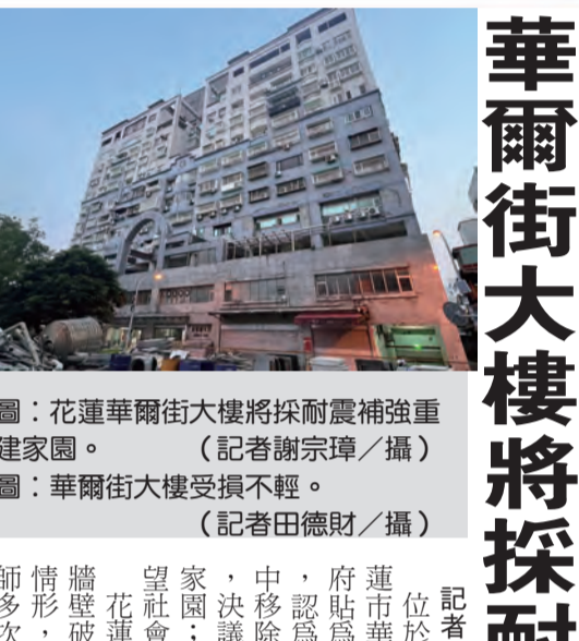
圖：花蓮華爾街大樓將採耐震補強重建家園。