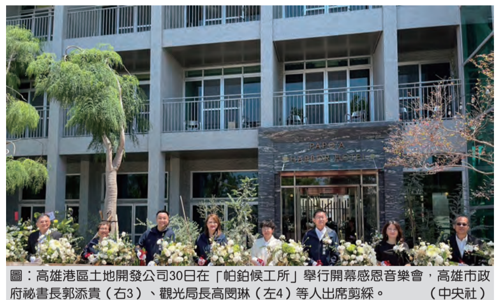
圖：高雄港區土地開發公司30日在「帕鉞候工室」舉行開幕感恩音樂會...