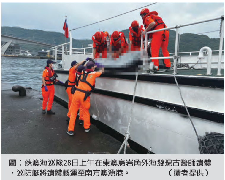
圖：蘇澳海巡隊二十八日上午在東澳島岩角外海發現古醫師遺體，巡防艇將遺體載運至南方澳漁港。