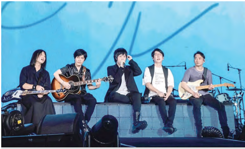
圖：樂團五月天預告將前往因地震受災的花蓮舉辦公益演唱會，讓許多歌迷感到暖心。

記者田德財/報導 樂團五月天二十七日晚在中國泉州舉辦公益演唱會，演出後主唱阿信在臉書發文預告「Just Love」下一站將在近期因地震受災的花蓮舉辦，花蓮縣長徐榛蔚回應表示：「歡迎五月天一起為花蓮加油。許多歌迷大讚五月天暖心，也有民宿業者留言表示「好想哭」、「感謝您雪中送炭」，也有人說「這是近期讓花蓮人最開心的事了」。許多歌迷驚喜留言「太暖了」、「有你們真好」。