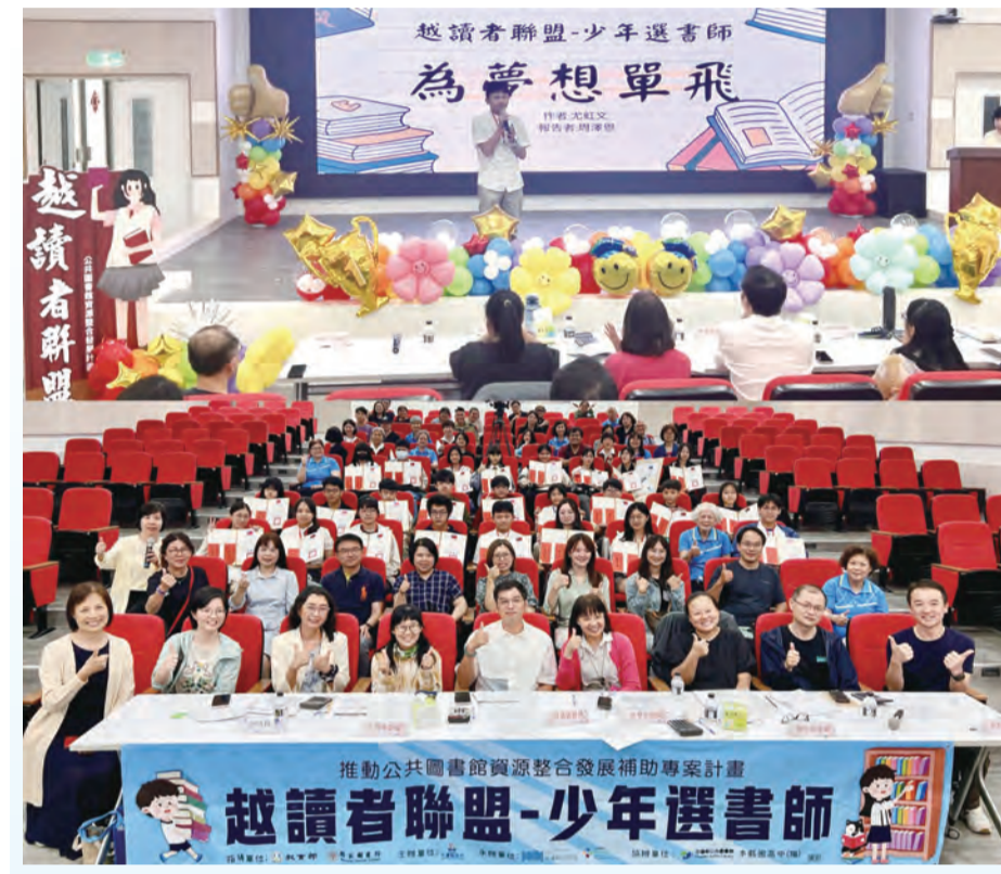
圖：通過初賽的學子輪番上台展現對於閱讀的熱情，在決賽上人人有獎，都是優秀的「少年選書師」。

合歡山開放否 網友兩極化爭議 兩極化的爭議，有網友認為，暫時無法到花蓮及太魯閣旅遊，只能到合歡山；也有網友表示，地震過後山區道路有潛在落石危險，建議太魯閣暫時封閉。 太魯閣國家公園管理處二十八日指出，台灣東部海域發生規模七點二地震，花蓮縣境內和平最大震度達六級，導致太魯閣國家公園出現嚴重的落石，造成遊客受傷的意外，該處立即封閉山區各步道及遊客服務據點，受到花蓮地區震害不斷，再度宣布暫時封閉至五月七日。 太魯閣國家公園管理處表示，由於合歡山受地震影響受損較輕，持續的餘震，讓該處除了再度宣布暫時封閉生態保護區、合歡山(道路及設施整修)外，其他合歡山北峰、西峰、東峰及石門山等群峰，在巡查人員勘測後，目前都維持開放，讓遊客可以欣賞合歡山杜鵑花。 近日有不少民眾向太魯閣國家公園管理處陳情，要求重新開放合歡山周邊生態保護區入園申請外，許多相關網站也出現合歡山是否封閉及開放的兩極化爭議；許多網友認為，在花蓮大地震後，暫時不敢前往花蓮旅遊，台灣少了一處旅遊勝地，合歡山在地震後受損較輕，加上目前正