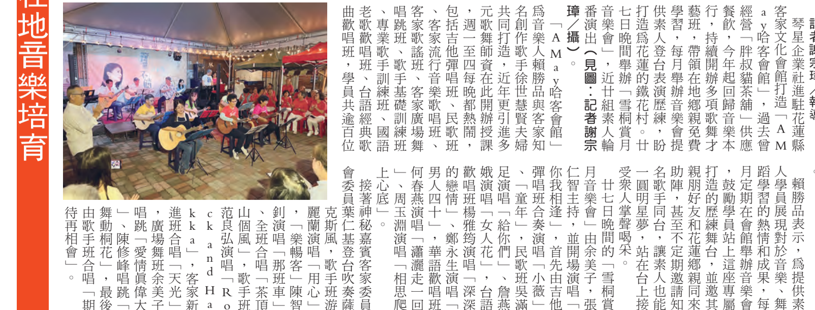
圖：A May哈客會館素人歌手每月齊歡唱，現場氣氛熱烈。