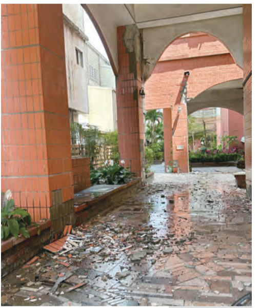
圖：馥邑京華公寓大樓受損嚴重，住戶開會同意拆除重建。

現在大樓雖無人居住，管委會不願見社區因無光顯得落寞，他日前戴著安全帽進入每棟樓，將每一層樓梯間的燈及自家的燈打開，或許住戶或附近民眾看到燈光後，心中能感到一絲溫暖並燃起希望。 進行拆除的建物工作進度，其中，富凱大飯店經五天拆除，目前已拆到建物三樓，將陸續破壞天花板及三樓以上的牆壁，五月五日拆完後，機具將移往吉安麥當勞投入拆除工程；藍天麗池飯店正持續進行六米填土作業，預計五月一日動工，三週內拆完；北濱街二號及二之一及統帥大樓已啟動拆除作業，預計在二週內拆完。