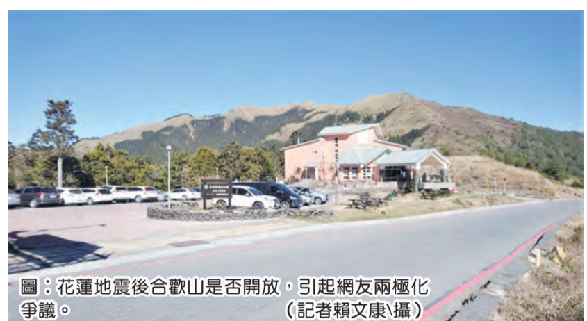
圖：花蓮地震後合歡山是否開放，引起網友兩極化爭議。

合歡山開放否 網友兩極化爭議 兩極化的爭議，有網友認為，暫時無法到花蓮及太魯閣旅遊，只能到合歡山；也有網友表示，地震過後山區道路有潛在落石危險，建議太魯閣暫時封閉。 太魯閣國家公園管理處二十八日指出，台灣東部海域發生規模七點二地震，花蓮縣境內和平最大震度達六級，導致太魯閣國家公園出現嚴重的落石，造成遊客受傷的意外，該處立即封閉山區各步道及遊客服務據點，受到花蓮地區震害不斷，再度宣布暫時封閉至五月七日。 太魯閣國家公園管理處表示，由於合歡山受地震影響受損較輕，持續的餘震，讓該處除了再度宣布暫時封閉生態保護區、合歡山(道路及設施整修)外，其他合歡山北峰、西峰、東峰及石門山等群峰，在巡查人員勘測後，目前都維持開放，讓遊客可以欣賞合歡山杜鵑花。 近日有不少民眾向太魯閣國家公園管理處陳情，要求重新開放合歡山周邊生態保護區入園申請外，許多相關網站也出現合歡山是否封閉及開放的兩極化爭議；許多網友認為，在花蓮大地震後，暫時不敢前往花蓮旅遊，台灣少了一處旅遊勝地，合歡山在地震後受損較輕，加上目前正