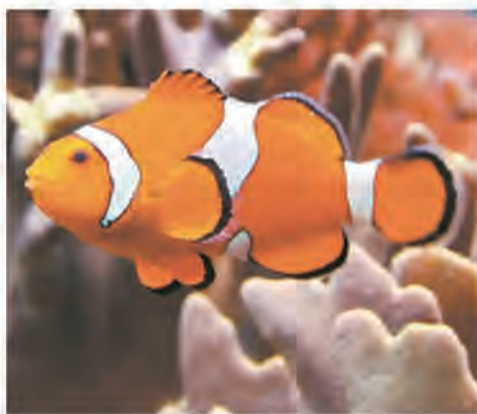
▲普通小醜魚。

日本沖繩科學技術研究所研究人員在《實驗生物學雜誌》上發表了一項驚人的發現，即小醜魚能通過數其它魚身上的白色條紋來區分敵友。