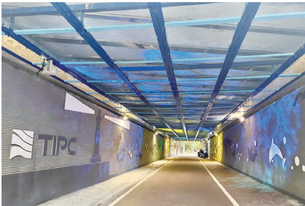
記者謝宗璋/報導 花蓮港分公司為促進地方觀光特色，盡企業社會責任，去年底啟動「廿四號板橋」自行車道箱涵美化工程，改善原有箱涵老舊混泥土牆，注入花蓮港燈塔、鯨豚等海洋意象圖騰，並搭配七彩水波紋燈光，目前已完工，讓民眾如走入時光機、暢遊海洋風情，渴望成為自行車道上的拍照打卡新亮點。

注入花蓮港燈塔、鯨豚等海洋意象圖騰 搭配七彩水波紋燈光 猶如走入時光機、暢遊海洋風情