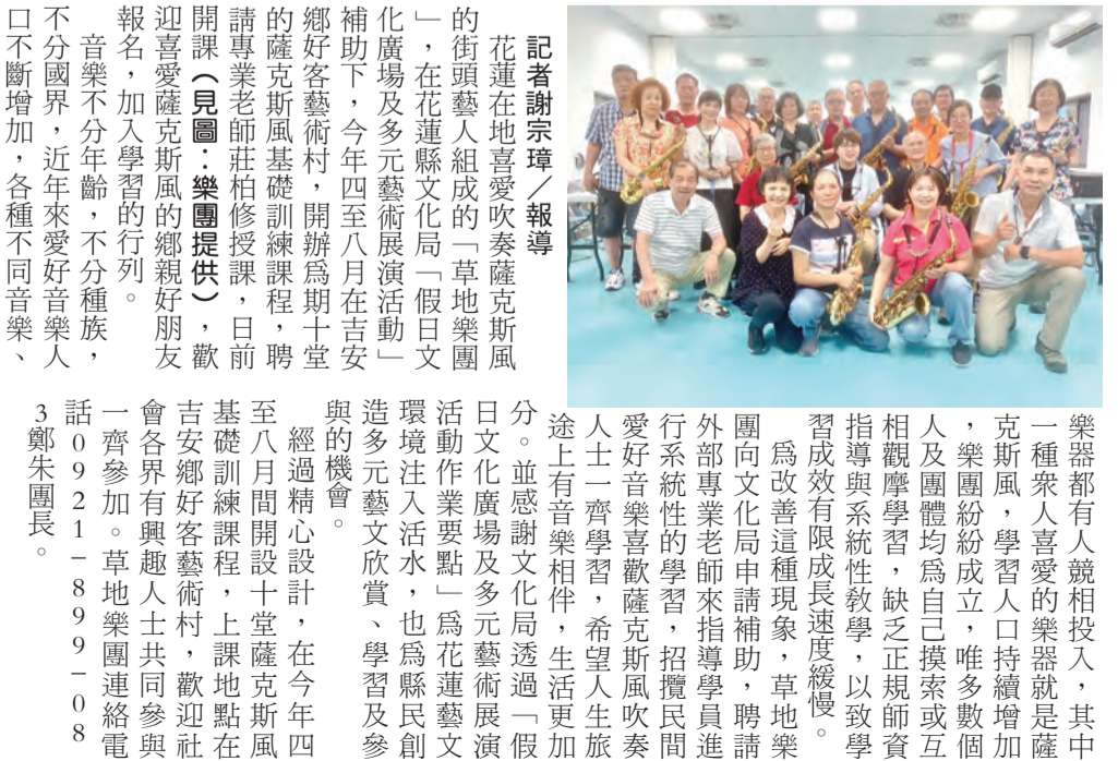
圖：草地樂團「薩克斯風基礎班」開課，歡迎愛好者加入。