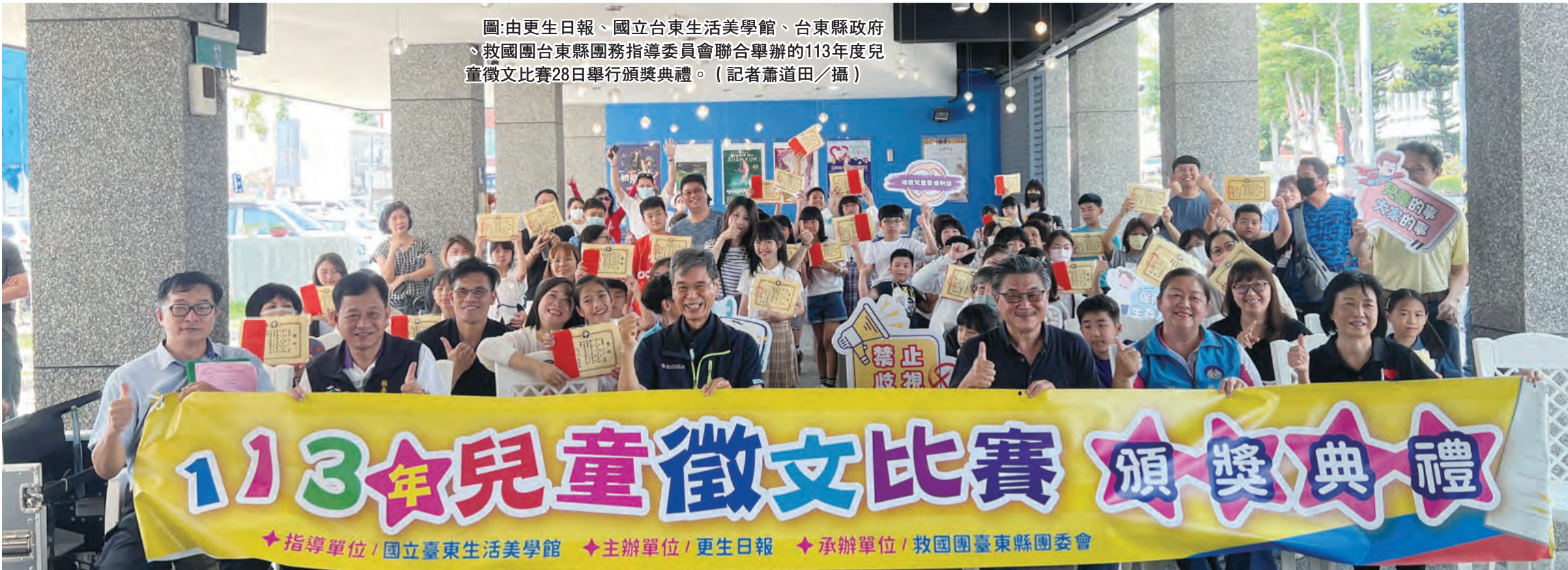
圖:由更生日報、國立台東生活美學館、台東縣政府、救國團台東縣團務指導委員會聯合舉辦的113年度兒童徵文比賽28日舉行頒獎典禮。