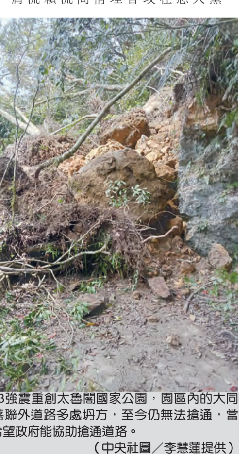
圖：0403強震重創太魯閣國家公園，園區內的大同大禮部落聯外道路多處坍塌，至今仍未修復，當地族人希望政府協助搶通道路。