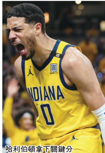
哈利伯頓拿下關鍵分