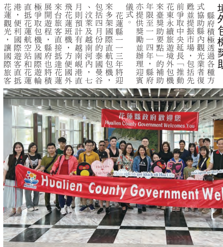
圖：二十七日由河內來台首航的越南包機，滿載225名遊客訪花蓮觀光。

本航線由縣府及花蓮縣旅行社共同組成，該會會員航業旅行社共同組成，由越捷航空（Jet Airway）的空中巴士A321XLR直飛花蓮。此次包機直航的順利，是花蓮觀光發展的重要契機，也是花蓮與河內首航的國產國際包機首航，滿載二百二十五名旅客訪花蓮觀光。