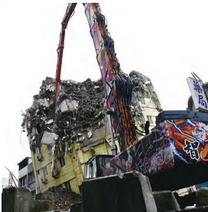
上圖：富凱飯店繼續拆除中。(記者田德財/攝) 下圖：統帥大樓預計今天二十八日動工拆除。(記者田德財/攝)

再增加9棟紅單 ○四二三強震共再增加九棟紅單，包括花蓮市光復街二號、黃單三棟，包括消防局第二大隊水壩分隊、統計連同○四〇三三棟，紅單增為六十三棟，受災戶從八〇三戶增為九八八戶，黃單增為六十一棟，受災戶從一三三戶增為一三三九戶。 ○四二三新增的九棟紅單，包括花蓮市榮正街九十六號、九十八號(集合住宅)，吉安鄉自強路三六五巷二號(工業區)、吉安鄉 宜昌村中華路二段十一之一號(住宅)、花蓮市中山路一五四號(富凱飯店)、花蓮市 中正路五九〇號(藍天麗池飯店)、花蓮市光復街三十六號(花蓮二信)合計增加一五五戶。 ○四二三新增黃單三棟分為：花蓮市長安街二十六號(和勝江山，復勘原址)，增為二四二戶)、壽豐鄉水壩村水壩路六號(花蓮縣消防局第二大隊水壩分隊)、花蓮市民德四街一五五號。 原○四〇三地震花蓮縣紅單五十四棟，確定拆除的共九棟，包括北濱街二號、六號(花一村)、早餐店連棟的十六號、二十號、二十二號、二十四號、明禮路統帥大樓、花崗街天王星大樓、博愛街五十二號店舖。○四二三再增加四棟，分別為富凱飯店、吉安鄉一棟、藍天麗池飯店、吉安鄉麥當勞大樓，共計十三棟。 已拆除7棟建築 花蓮縣政府表示，這九棟目前已拆除是：北濱街十六號、二十號、二十二號、二十四號(即早餐店連棟)、天王星大樓、北濱街六號的花一村、博愛街五十二號，近日將拆除的明禮路統帥大樓及北濱街二號與藍天麗池飯店及吉安鄉中華路麥當勞。 統計到目前紅單戶為九八八戶，黃單戶一三三九戶，合計二千三百二十七戶，依花蓮縣一二二年底每戶一平均人口數為一點五五人計算，總計有五千九百六十人馬上發生居住問題，尤其拆除十二棟二百多戶，即達六百多人無家可歸。 北濱街二號今開拆 花蓮縣府建設處長鄧子楡指出，富凱大飯店正在拆除中，預計一週內可完工；北濱街二號民宅預計二十八日開拆，工期約十天；藍天麗池正在拆除附近路燈、號誌等公共設施，預計五月一日拆除。吉安麥當勞勞五月上旬動工拆除。 花蓮震災嚴重，除了建築、家具、設備受損，強制拆除期間，影響較大的包括花崗街天王星大樓、中山路富凱飯店、中正路藍天麗池飯店、吉安中華路麥當勞大樓，道路封閉兩商家根本無法做生意，有的更無法居住。