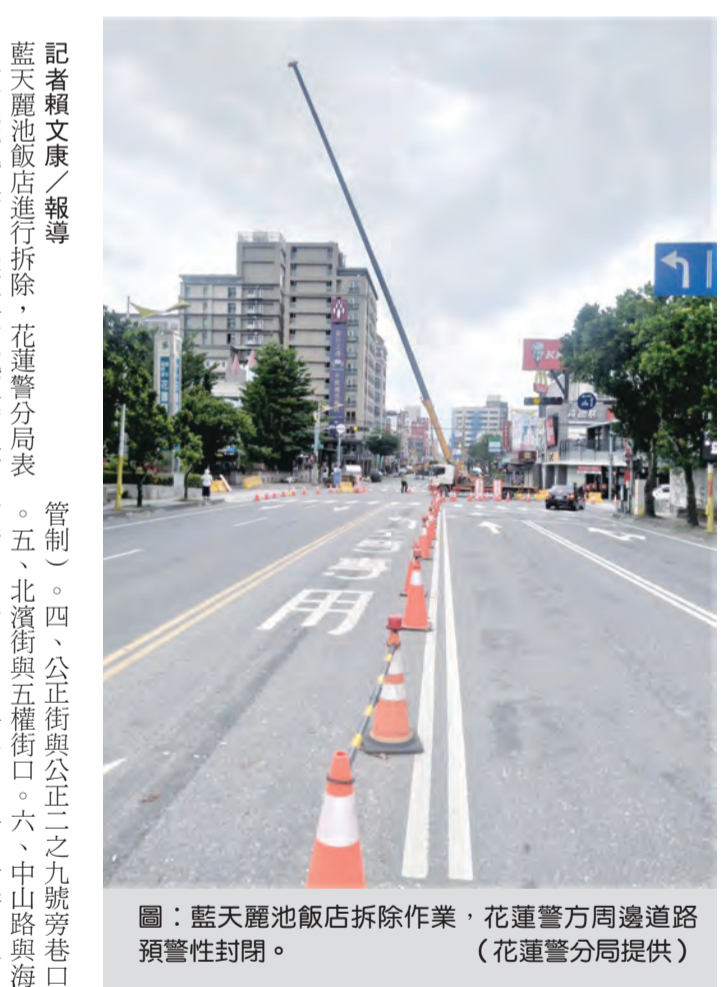
圖：藍天麗池飯店拆除作業，花蓮警方周邊道路預警性封閉。

藍天麗池飯店拆除 ，花蓮警分局表示，預計至五月二十日止，為確保民眾安全，實施藍天麗池飯店周邊道路預警性封閉，預計至五月二十日止，為確保民眾安全，實施藍天麗池飯店周邊道路預警性封閉。 藍天麗池飯店拆除作業，預計至五月二十日止，為確保民眾安全，實施藍天麗池飯店周邊道路預警性封閉。預計至五月二十日止，為確保民眾安全，實施藍天麗池飯店周邊道路預警性封閉。 藍天麗池飯店拆除作業，預計至五月二十日止，為確保民眾安全，實施藍天麗池飯店周邊道路預警性封閉。預計至五月二十日止，為確保民眾安全，實施藍天麗池飯店周邊道路預警性封閉。