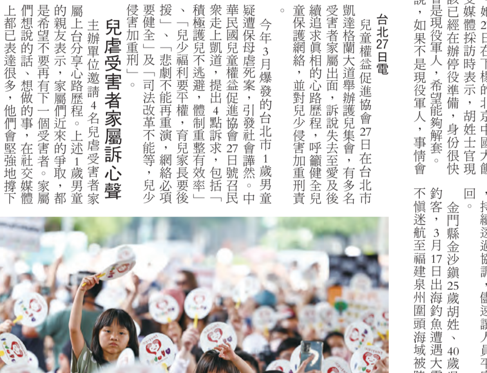
「保護兒童我願意」大批民衆響應 圖：中華民國兒童權益促進協會27日下午在台北凱達格蘭大道舉辦護兒集會活動，吸引大批民衆到場響應，眾人一同揮舞手中扇子，強調「保護兒童我願意」立場。