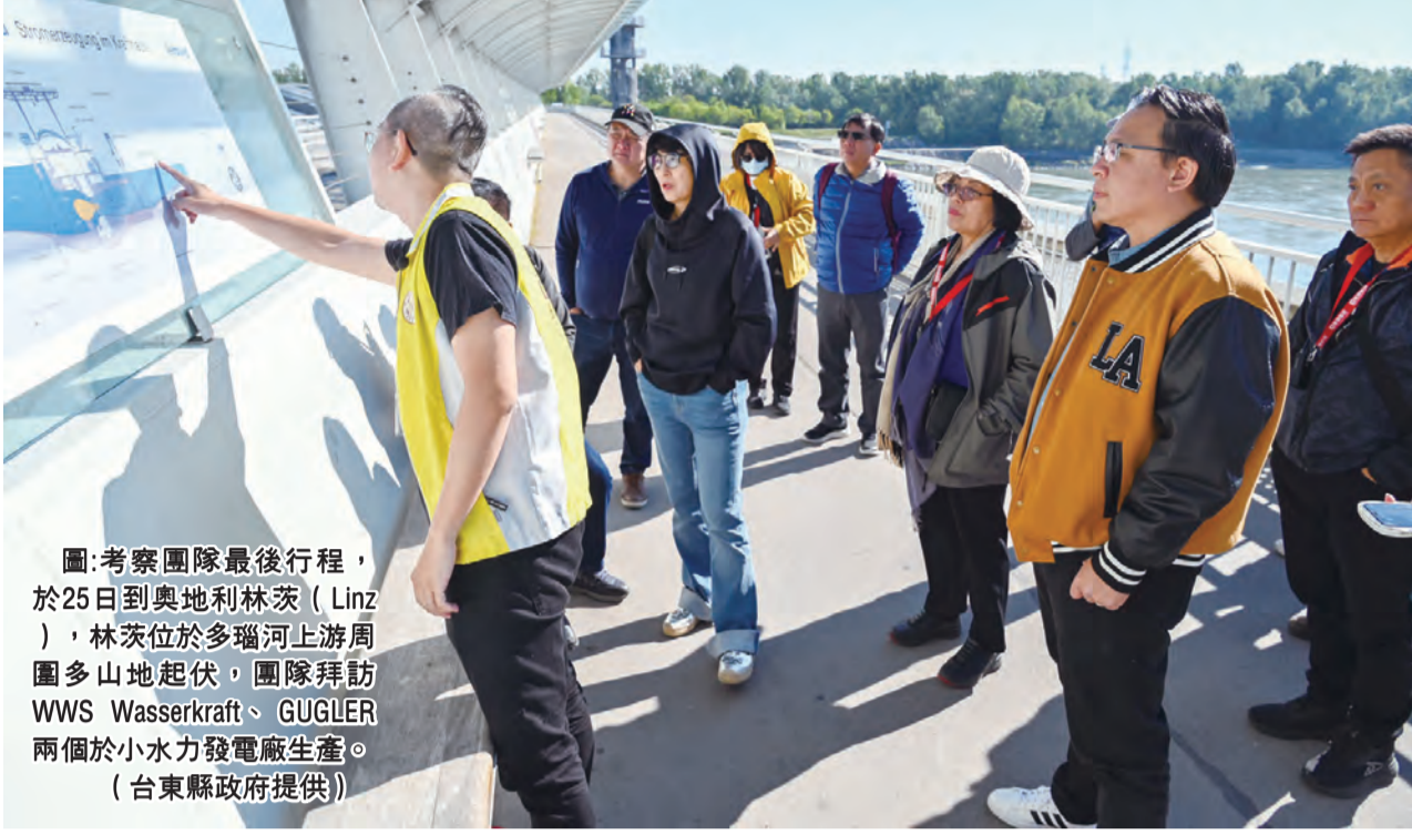
圖：考察團最後行程，於25日到奧地利林茨（Linz），林茨位於多瑙河上游周圍多山地起伏，團隊探訪WWS Wasserkraft、GUGLER兩個於小水力發電廠生產。

記者蕭道田/報導 將臺東打造為第一個以100%再生能源推動的綠色城市，是台東縣政府致力推動的目標，其中小水力發電預計佔29%、地熱發電60%、太陽光發電11%。縣長饒慶鈴與九位鄉鎮市長，自20日前往瑞士及奧地利考察小水力發電廠及能源公司。饒慶鈴表示，此次考察可深入了解小水力發電機組的運作原理和技術特點，加強因地制宜發展小水力發電理念。