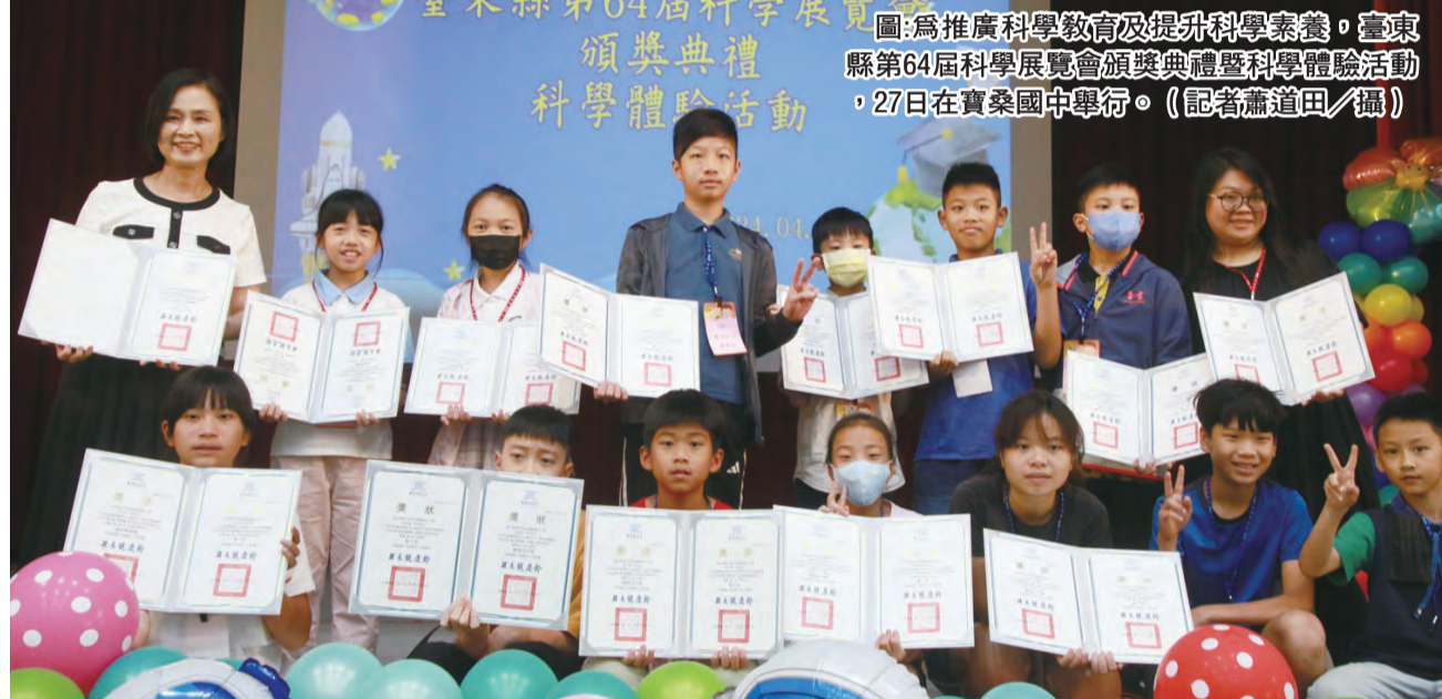
圖：為推廣科學教育及提升科學素養，臺東縣第64屆科學展覽會頒獎典禮暨科學體驗活動，27日在寶桑國中舉行。