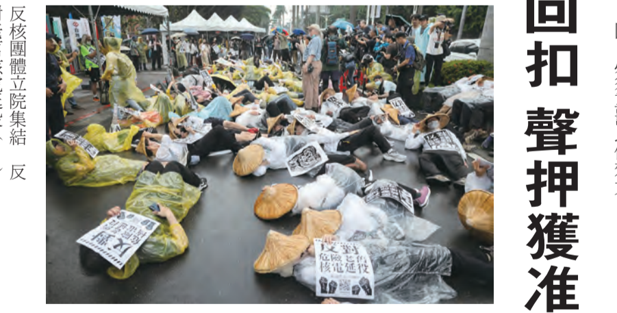
反核團體立法院集結 反對老舊核電延役(2) 圖：全國廢核行動平台 27日號召群眾集結

7年偷渡上百人來台 人蛇首腦落網 高雄27日電 海巡署追緝人蛇集團陳姓主嫌，發現7年來涉及多起偷渡案，偷渡上百人來台。專案小組追緝陳男卻被衝撞逃脫，27日上午終於在新竹縣攻堅逮捕歸案，將移送檢方偵辦。 海巡署和檢察長長期追緝偷渡客蛇集團，陸續破獲「(亞亞)」、「(捷西號)」、「(鑽石26號)」貨輪偷渡越南籍人士非法來台，抽絲剝繭查出幕後陳姓主嫌7年來涉及多案，企圖偷渡上百人入境，專案小組今年4月初原已掌握行蹤，海巡人員卻被惡意衝撞逃脫，今天終於在新竹縣新豐鄉攻堅逮捕，將移送高雄地檢署偵辦。 高雄地檢署去年12月間接獲海巡署南部分署第5岸巡隊通報，蒙古籍「鑽石26號」船底機艙與貨艙夾層處藏匿越南籍偷渡客16名越南籍人士，更查出其中阮姓偷渡客在船上因密閉狹窄昏迷一度命危，將阮姓船長等4人依殺人未遂罪起訴。 此外，42歲蔡姓船長、王姓輪機長、李姓、郭姓與鄭姓船員共謀，以新台幣15萬元代價，3月27日晚間駕駛略略隆籍貨輪「(捷西號)」(捷西號)一路從建港某海域，接載15名搭某木殼小船從中國出海又不具入國許可證的越南籍人士，3月30日入境時遭海巡署逮獲，5人全遭逮捕聲押獲准。 海巡署專案小組抽絲剝繭釐清案情，從其中郭姓船員均有涉案，懷疑是同一人蛇集團所為，進而追查出國幕後陳姓主嫌。 海委會主委管碧玲13日在臉書表彰海巡破獲「(捷西號)」貨輪偷渡案，3月1日入出國移民法修正加重刑責後，此案為海巡破獲、適用新法首案。調查顯示，此案至少在去年3月、12月，被查到各載運十多名越南人非法來台，其中一次幾乎要悶死偷渡者，這次還在後續追緝時衝撞海巡，如此密集犯案且手段凶殘，是惡性重大的走私偷渡犯罪集團。 管碧玲說，過去載運偷渡刑責僅3年以下，集團涉案人都被法院裁定交保，交保後繼續謀劃犯罪，以致到半年就接連犯案。但修法加重刑責後，提高處3年以上、10年以下有期徒刑，這次緝獲有重大意義，對這種惡性連環偷渡集團，必須重罰以儆效尤。