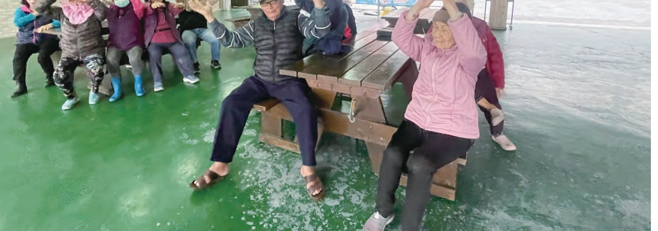
圖：台東縣失智者關懷協會為偏鄉且需要被關注的人，提供服務照顧。

闖關體驗活動內容豐富有超過50種豐富具科學教育意義，有「馬格魯斯飛杯」、「造雲器與愛情溫度計」、「轉不停的神奇魔法」、「分子料理」、「立體泡膜」、「電子焊入門」、「萬箭穿心」、「乒乓球陀螺」、「氣墊光碟」、「啟動影像密碼-疊紙動畫與應用」、「食蛇大冒險-操控大對決」、「史特林引擎發電原理」、「魚兒辨辨辨」等，每項活動包含科學科技、生活趣味、環境永續與創意思考，充滿豐富精彩的科學研究與多元實作的學習內容，吸引不少參與民眾及學校師生一起探索。