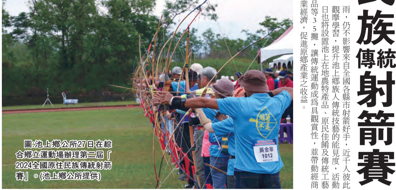
圖：池上鄉公所27日在綜合鄉立運動場辦理第三屆「2024全國原住民族傳統射箭賽」。

實現經濟生態雙贏 饒慶鈴表示，瑞士、奧地利都是小水力發電技術相當成熟國家，兩國2%、6%發電來自水力，把潔淨、中電力的環保永續理念融入教育與生活中，是台東學習重點，未來將營造東成綠能城市。因地制宜是實現永續發展的重要因素，臺灣約有3.4%受到風能直接發展再生能源，所以配合微風網發展再生能源，達到不僅電效果，是首要目標。因地制宜不僅僅在小水力發電項目上，還可應用於其他領域，如農業、觀光發展等。通過充分挖掘當地資源和特色，實現經濟發展和生態保育雙贏，為臺東發展注入新動力。