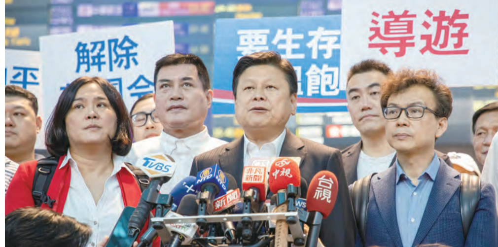
圖：國民黨立法院黨團總召傅崐琪（前右2）26日率團訪問中國，出發前在桃園國際機場舉行記者會。（中央社）

桃園26日電 國民黨立法院黨團總召傅崐琪，率領17名黨籍立委，於26日啟程訪問中國大陸。傅崐琪在記者會上表示，此行旨在促進兩岸交流，恢復正常關係。他強調，兩岸關係的改善應建立在互信、平等、互惠、共贏的基礎上。此次訪問將包括與大陸領導層會談、考察各項建設以及與各界人士交流。傅崐琪表示，他將向大陸領導層轉達台灣民意，並尋求在經濟、文化、教育等領域的合作機會。他呼籲大陸方面能以同樣的誠意對待台灣，共同為中華民族的繁榮與發展做出貢獻。