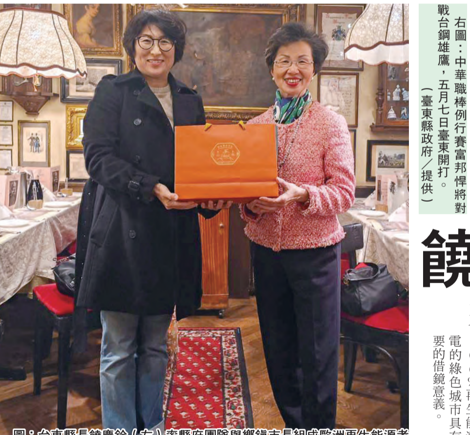
圖：台東縣長饒慶鈴(左)率縣府團員與鄉鎮市長組成歐洲再生能源考察團，25日拜會駐奧地利代表處大使張小月(右)。

記者陳盈貞/報導 右圖：中華職棒例行賽富邦悍將對戰台鋼雄鷹，五月七日臺東開打。