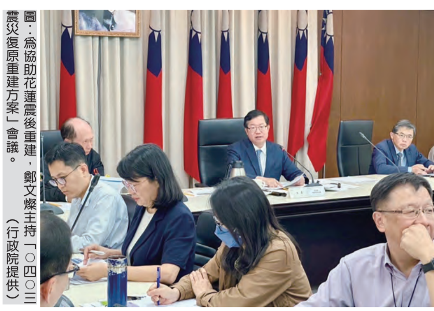
圖：為協助花蓮震後重建，鄭文燦主持「〇四〇三」震災復興重建方案會議。

【本報花蓮訊】行政院副院長鄭文燦表示，為協助花蓮震後重建，中央推出一系列公共設施復原重建、產業及觀光振興方案等，也請內政部進駐花蓮成立「危老重建輔導團」及「花蓮重建辦公室」。 鄭文燦表示，內政部將進駐花蓮，成立「危老重建輔導團」及「花蓮重建辦公室」。該團將由內政部、國庫署、地政司、地價稅課等組成，將協助災區重建，並對受災戶提供各項補助。