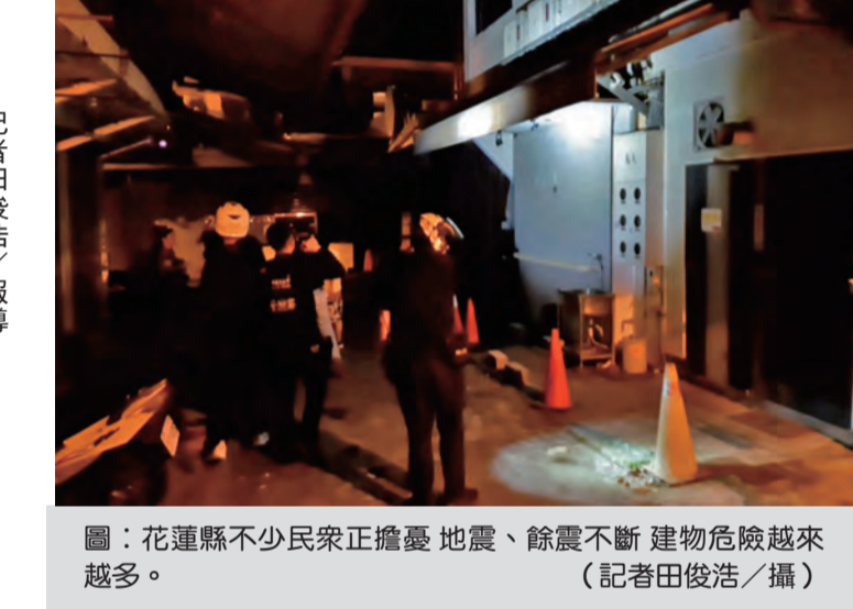
圖：花蓮縣不少民衆正擔憂地震、餘震不斷 建物危險越來越多。

太魯閣口往天祥 恢復每日3次通行 記者田俊浩/報導 東區養護工程分局二十四日表示，太魯閣口往天祥路段，易坍方區流芳橋災害路段採取護指指揮通行。