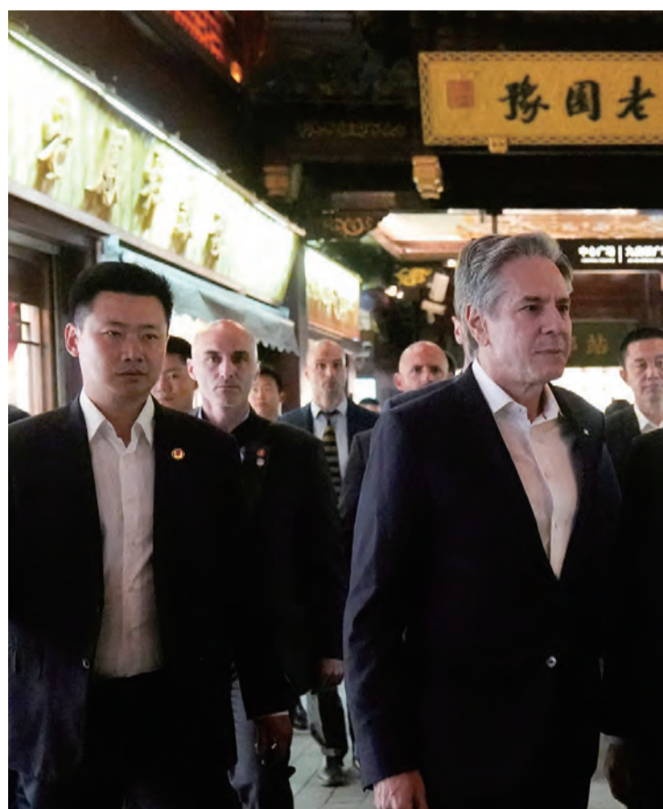
布林肯二度訪中 圖為美國國務卿布林肯24日起一連3天訪中，圖為布林肯(前排左二)和美國駐華大使伯恩斯在中國上海豫園漫步。

世衛大會5月登場 我尚未獲邀 【台北24日電】第77屆世界衛生大會(WHA)5月登場，衛生福利部長薛瑞元24日說，目前尚未接到邀請函，因適逢520新內閣將上任，屆時當然就是由新任衛福部長邱泰源率團前往。