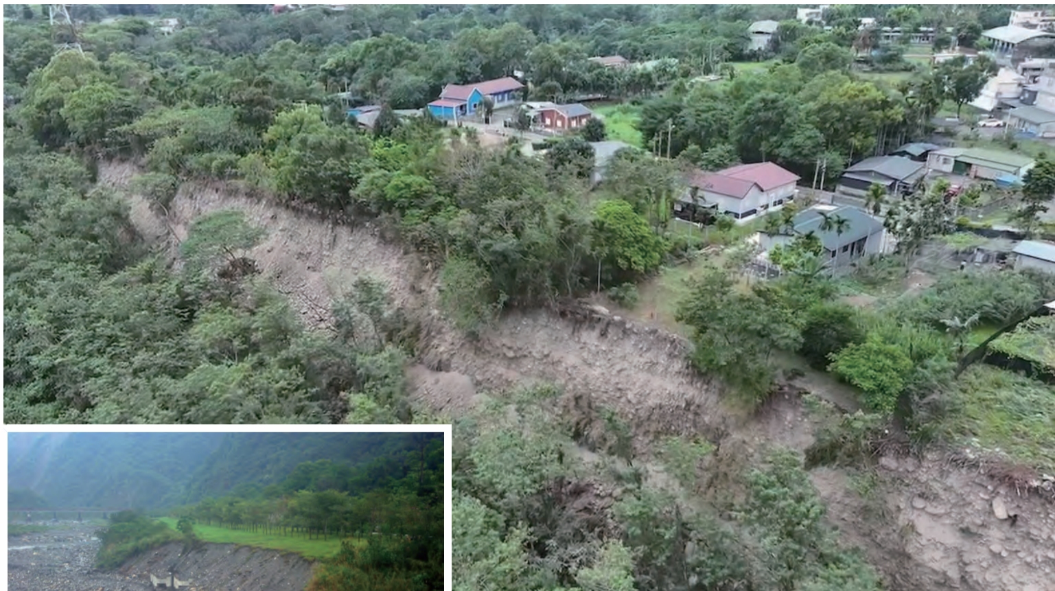
上圖：花蓮0403強震後，秀林鄉文蘭村木瓜溪側民宅後方，出現長約1公里土石崩落，近日地震不斷、天氣不穩定，部落居民擔心崩落範圍擴大。