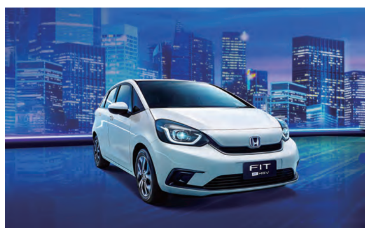
↑ Honda FIT e:HEV連續三年榮獲經濟部能源局評鑑燃油車節能第一名！

根據經濟部能源局最新公佈的2023年「車輛油耗指南」中顯示，Honda FIT e:HEV以每公升平均行駛26.9公里(市區行駛每公升39.57公里、高速行駛每公升22.69公里)，在各家車廠中脫穎而出，蟬聯2021~2023年燃油車節能第一名殊榮。