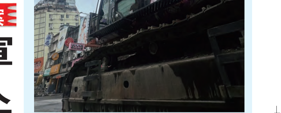
全台最大怪手再出動 圖：花蓮市富凱大飯店23日因地震傾倒，天王星大樓拆除功臣、全台最大怪手「魯夫號」已進駐拆除現場附近並完成組裝，預計晚間開拆飯店。(中央社) 相關新聞見2版

全台最大怪手再出動 【本報訊】花蓮市富凱大飯店23日因地震傾倒，天王星大樓拆除功臣、全台最大怪手「魯夫號」已進駐拆除現場附近並完成組裝，預計晚間開拆飯店。(中央社) 相關新聞見2版