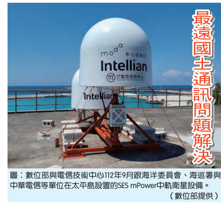
圖：數位部與電信技術中心112年9月跟海洋委員會、海巡署與中華電信等單位在太平島設置的SES mPower中軌衛星設備。

本報新聞中心綜合17日報導 數位部17日表示，太平島通訊頻寬長期不足，日前在太平島正式開通SES mPower中軌衛星（TTC）16日啟用島上Wi-Fi與行動網路服務，總傳輸頻寬可達25Mbps，通訊綜合效能提升3.9倍，可供駐紮太平島海巡署官兵使用。