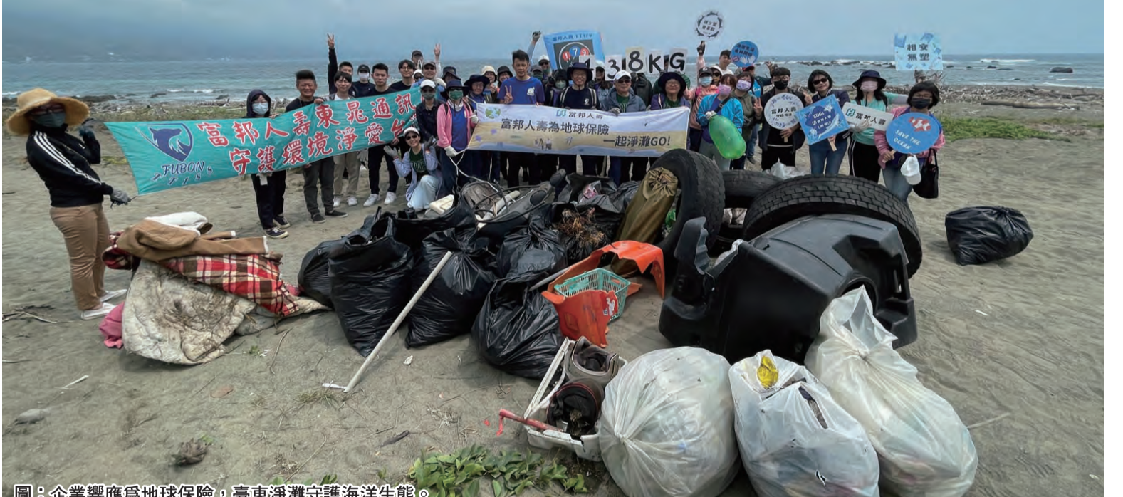
圖：企業響應為地球保險，臺東淨灘守護海洋生態。