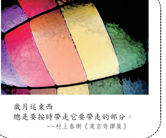
歲月這東西 總是要按時帶走它要帶走的部分。 —村上春樹《東京奇譚集》

的。在擔任中華民國兒童文學學會理事長任內，曾經帶同十位台灣兒童文學作家前往中國，和上海和南京兩地的兒童文學作家進行交流。綜上所述，我與台灣兒童文學三十年來始終不離不棄，就只爲了幫青史留鴻爪，從《台灣兒童文學史》、《台灣近代兒童文學史》二書，對台灣兒童文學從近代到現代，讓讀者有一個比較清楚的歷史發展脈絡可循。對過去的歷史發展了解得越透徹，對往後的趨勢發展界越清楚。回首來時路，越發覺得兒童文學史料工作真的是路迢迢。