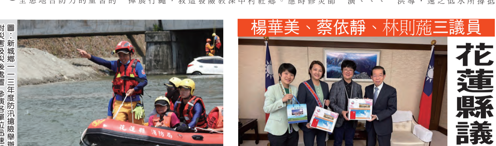
圖：新城鄉一三年度防汛搶險演習，對災害及災後處置，參演各單位迅速確實。(記者田俊浩/攝)