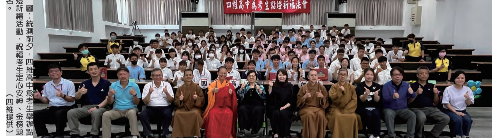
圖：統測前夕，四維高中為考生舉辦點燈祈福活動，祝考生定心安神、金榜題名。

文化局表示，花蓮縣境內巡迴計畫，將表演藝術資源帶入各鄉鎮，期待平衡藝術人文教育，讓大眾與藝術零距離。二〇二二年在疫情期間，仍積極推廣「玩藝列車」系列活動，規劃上文化局官網活動查詢或臉書專頁「花蓮縣文化局」。其中「爆米花驚喜秀」將於六月十三日（鳳凰場）、十四日（光復場）開放報名，千萬不要錯過！線上報名：https://www.tcc.gov.tw/zh-tw/Activity/SignUp。