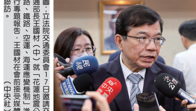
圖：立法院交通委員會17日邀請交通部部長王國材(中)就「花蓮地震震創新高、鐵路、空運、海運應變機制」進行專題報告，王國材在會前接受媒體聯訪。

○四○三地震震創新高，外野疾呼應該有一條安全回家的路。對此，交通部部長王國材十七日在立法院交通委員會接受媒體聯訪表示，支持花東要有安全回家的路，國六延伸花蓮部分，過去碰到困難，包含斷層等環境影響的課題，去年已經啟動路廊踏勘與地質調查，大概在一一五年會進入可行性研究。