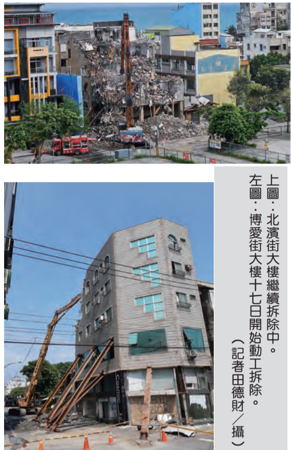
上圖：北濱街大樓繼續拆除中。左圖：博愛街大樓十七日開始動工拆除。