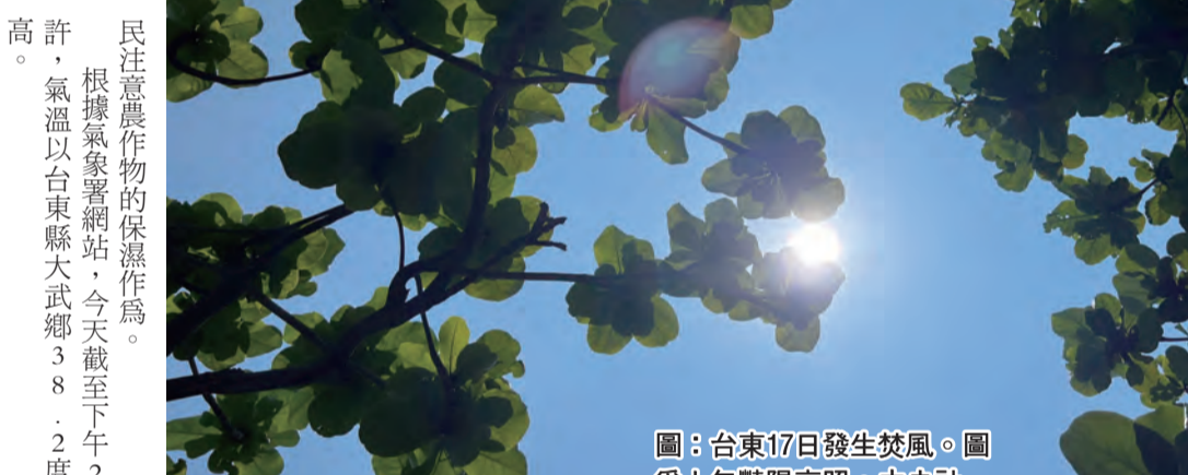
圖：台東17日發生焚風，圖為上午豔陽高照。