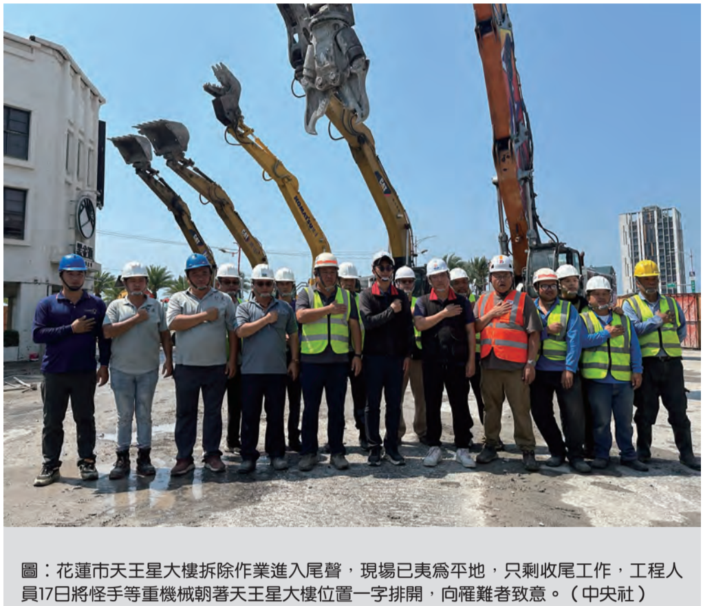
圖：花蓮市天王星大樓拆除作業進入尾聲，現場已夷為平地，只剩收尾工作，工程人員十七日將怪手等重機械朝著天王星大樓位置一字排開，向罹難者致意。