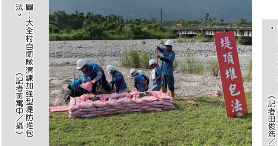
圖：大全村自衛隊演練加強型堤防堆包法。

【本報記者何國豐整理】花蓮縣第一場防汛演習十六日在壽豐鄉老溪上游段的榮光橋與中和國中場域舉行，擔任現場指揮官的壽豐鄉長曾淑懿(見圖)率領各村長與頭目、社區巡防隊與公所團隊投入防汛演習。曾淑懿率領各村長與頭目、社區巡防隊與公所團隊投入防汛演習。曾淑懿率領各村長與頭目、社區巡防隊與公所團隊投入防汛演習。 曾淑懿率領各村長與頭目、社區巡防隊與公所團隊投入防汛演習。曾淑懿率領各村長與頭目、社區巡防隊與公所團隊投入防汛演習。曾淑懿率領各村長與頭目、社區巡防隊與公所團隊投入防汛演習。