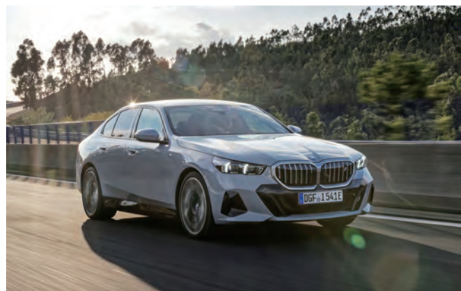
↑全新世代BMW 5系列勇奪年度最佳豪華車大獎！

全新世代BMW 5系列優異的駕乘體驗，除了經典的BMW TwinPower Turbo燃油動力，全新首創BMW i5純電豪華房車，優異的能源效率與純電動力源自於第五代BMW eDrive電能科技，加諸最高規格的新世代BMW Personal Co Pilot智慧駕駛輔助科技，結合全面升級的自動剎車輔助系統與變換車道輔助，打造絕佳完美坐駕；樹立BMW在豪華純電領域無可撼動的地位。