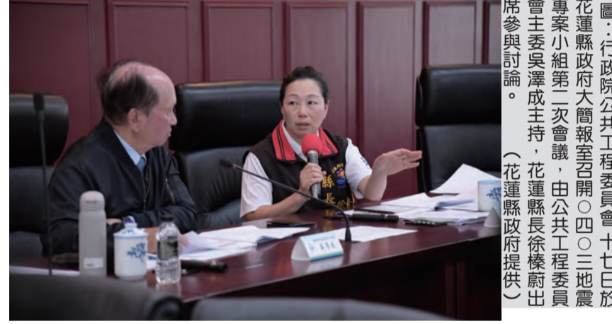
圖：行政院公共工程委員會十七日於花蓮縣政府大禮堂召開0403花蓮地震專案小組第二次會議，由公共工程委員會主委吳澤成主持，花蓮縣長徐禱出席並與會討論。

記者田德財/報導 行政院公共工程委員會十七日於花蓮縣政府大禮堂召開0403花蓮地震專案小組第二次會議，由公共工程委員會主委吳澤成主持，花蓮縣長徐禱出席並與會討論。徐禱在會中爭取中央更多挹注，以協助花蓮災區建物補強修繕與重建。