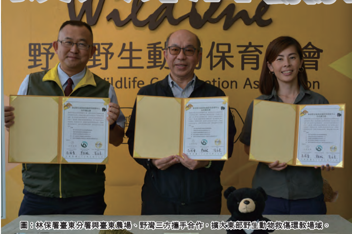
圖：林保署台東分署與台東農場、野灣三方攜手合作，擴大東部野動物救傷環教場域。