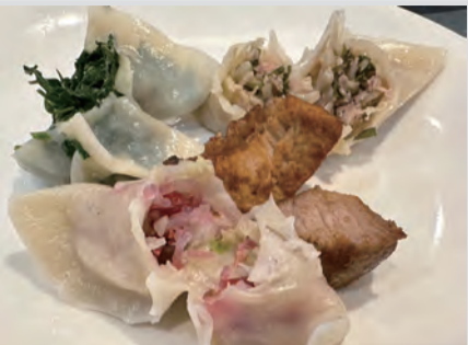
圖：現場奇美部落特色水餃、大同大禮部落使用當季盛產的食材烤製原民風味披薩，贏得高度好評。