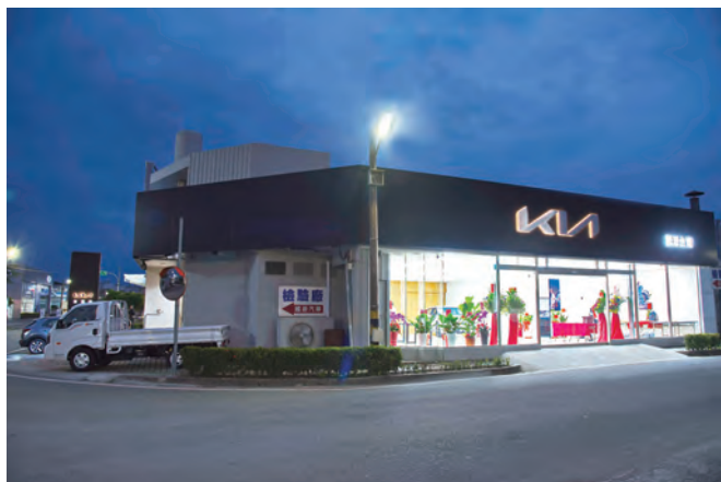
↑全新Kia台灣國源汽車展示中心開幕，代表著Kia環台服務網完整佈建的指標意義！

(記者李秉添、蔡宛玲/報導) KIA總代理台灣森那美起亞，持續積極導入KIA最新世代新能源動力車款，推出更智慧化、更安全的新車型，搭配各種行銷優惠活動，深受消費者青睞；2023年KIA汽車在全台領牌數創下破萬新高紀錄，成為台灣車市成長最速進口品牌。為帶給更多熱愛Kia的車主更優質的用车體驗，Kia總代理台灣森那美起亞積極佈建CI 2.0據點、深耕國內市場；日前正式開幕營運的台灣國源汽車展示中心，不僅更完整地佈建了Kia的環台服務網路、提供東部地區的鄉親更多的貼心與專業服務。