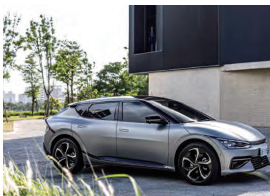
←「The Kia EV6省電王」車主挑戰賽，即日起開放報名。

The Kia EV6為Kia首款搭載E-GMP全球電動車模組化平台的新世代電動車，賦予The Kia EV6帶來高續航里程及超高速充電的優勢，The Kia EV6所搭載的高壓鋰電池組提供標準版58kWh、增程版77.4kWh兩種容量，在800V電能系統的架構下，最高充電效率達240kW，僅需18分鐘即可完成10%至80%充電，且充電4.5分鐘就能補充100公里的行駛里程，而The Kia EV6 Air增程版與The Kia EV6 GT-line增程版車型在WLTP測試規範下，單次續航里程更可高達560公里。此外，The Kia EV6同時搭載先進動能回充科技，透過六種模式的智慧動能再生制動系統，在行駛途中更進一步有效提升續航力表現。