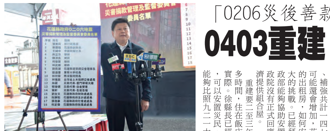
圖：花蓮縣立委傅其九九日召開記者會，說明0206震災八億石材補助業者利息相是行政院政策辦理。

東延亟需支持 傳聞其指出，花蓮人一百多年沒遇到如此可怕的地震，家中櫃子上的物品都被震毀，家家戶戶都在善後，需要各界的關心，而八線、天祥等路段都還在搜救，對於中橫公路原路修復可能已經不符合使用的需求，台灣是已開發國家，全世界都在發展，無論是一環島高鐵路還是一國道六號東延，這些建設其實都已經規畫過了，國道六號東延在規畫中，對環境的愛護固然非常重要，花蓮人都會共同保護，但也需要一條安全回家的路。