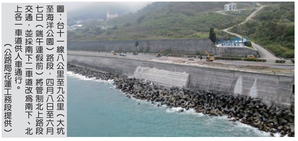
台11線大坑至海洋公園段 北上管制

台積電慈善基金會董事長張淑芬表示，這幾次到訪花蓮都是來救災的，至今都沒有來花蓮旅遊過，因此感觸非常深，此次帶著團隊實地赴災區中看看，瞭解災民的需市清潔隊二樓，將有台積電專車將進駐花蓮市清潔隊二樓，將有台積電專車將進駐花蓮市清潔隊二樓。