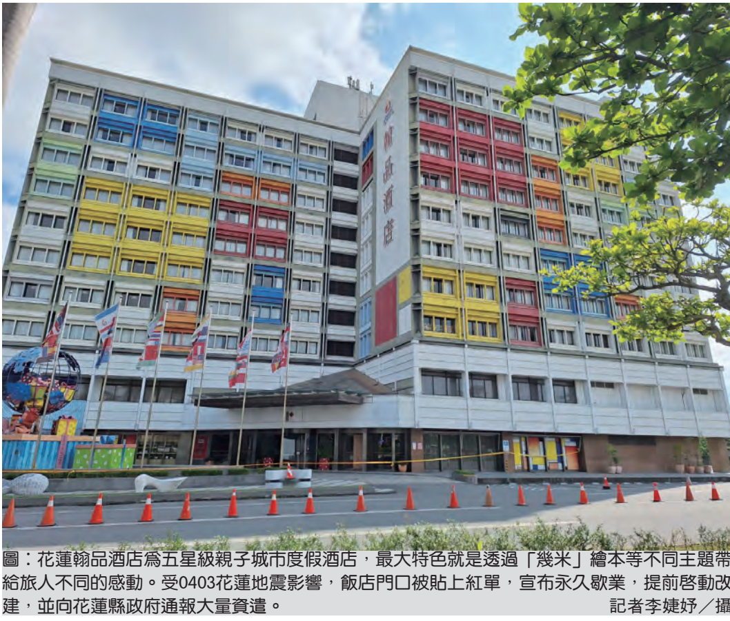
圖：花蓮輸品酒店為五星級親子城市度假酒店，最大特色就是透過「幾米」繪本等不同主題帶給旅人不同的感動。受0403花蓮地震影響，飯店門口被貼上紅單，宣布永久歇業，提前啓動改建，並向花蓮縣政府通報大量資遣。

記者李婕妤／報導 光集團旗下輸品酒店花蓮樓梯旁的牆壁及梁柱龜裂、騎樓立柱磁磚掉落，自四月三日起宣布停業，並提前進行重建計畫。輸品酒店花蓮於八日向花蓮縣政府通報將分批資遣員工，九日也發出聲明稿表示永久歇業。