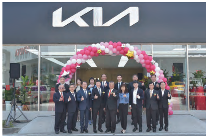
↑全新Kia台灣國源汽車展示中心，提供東部地區消費者全新購車及售後服務體驗。

Kia總代理台灣森那美起亞以「Movement that inspires移動，啟發人心」的品牌精神，持續導入眾多新世代Kia車款，並同步升級銷售與服務軟硬體，不僅提供消費者更多超越期待的用車體驗，並持續展現驚人的成長動能。3月Kia全車系合乘用及商用車銷售領牌達1,137台，創下今年第2度銷售破千台的佳績！其中Kia商用車卡旺，在3月則以276台領牌數，再創歷史新高單月銷售紀錄！累計2024年1-3月，Kia在第一季更以相較去年同期成長達57%的年度成長率，榮登成長最快速進口車品牌！