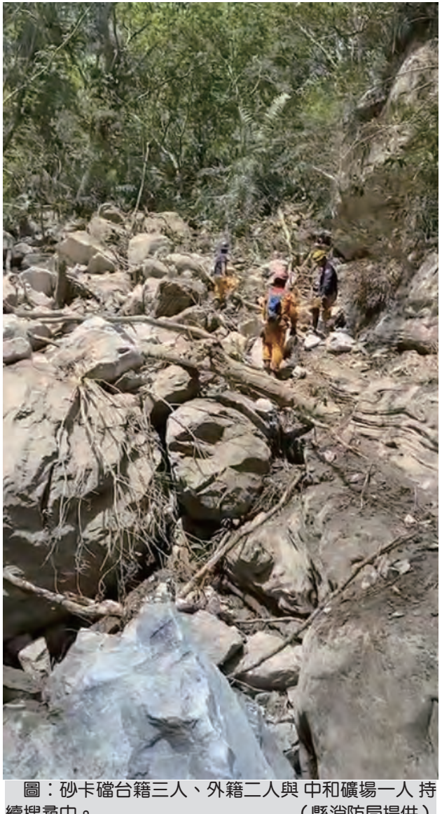
砂卡礑台籍3人、外籍2人與中和礦場一人持續搜尋中。

記者田德財/報導 截至八日上午十時，中央災害應變中心統計，迄今死亡十三人，失聯六人及天祥留守三十七人；至於失聯六人中，砂卡礑台籍三人、外籍二人與中和礦場一人正持續搜尋中。 八日上午中央災害應變中心第十六次工作會報指出，目前仍有餘震發生，再次呼籲民眾避開前往山區，並注意各項地震及氣象資訊以減少受災風險。另請內政部國家公園署、農業部林業及自然保育署、交通部中央氣象署等機關評估山區受地震或雨勢影響可能產生土石鬆動或土石崩落等區域範圍。有鑑於餘震發生，中橫一帶各山區九日晚間以前仍有短暫時陣雨，不排除受地震或雨勢影響，可能產生土石鬆動或土石崩落，請民眾避免前往山區。 另在中和礦場方面，民眾回報，疑似曾看到新加坡籍的民衆在那邊出現，所以，花蓮縣消防局派遣搜救隊及搜救犬，前往五間屋進行搜尋。至於中和礦場部分，有三台怪手、消防特搜、漁警警人員及礦工共同協助來去做進行搜尋。 在砂卡礑方面，民眾回報，疑似曾看到新加坡籍的民衆在那邊出現，所以，花蓮縣消防局派遣搜救隊及搜救犬，前往五間屋進行搜尋。至於中和礦場部分，有三台怪手、消防特搜、漁警警人員及礦工共同協助來去做進行搜尋。