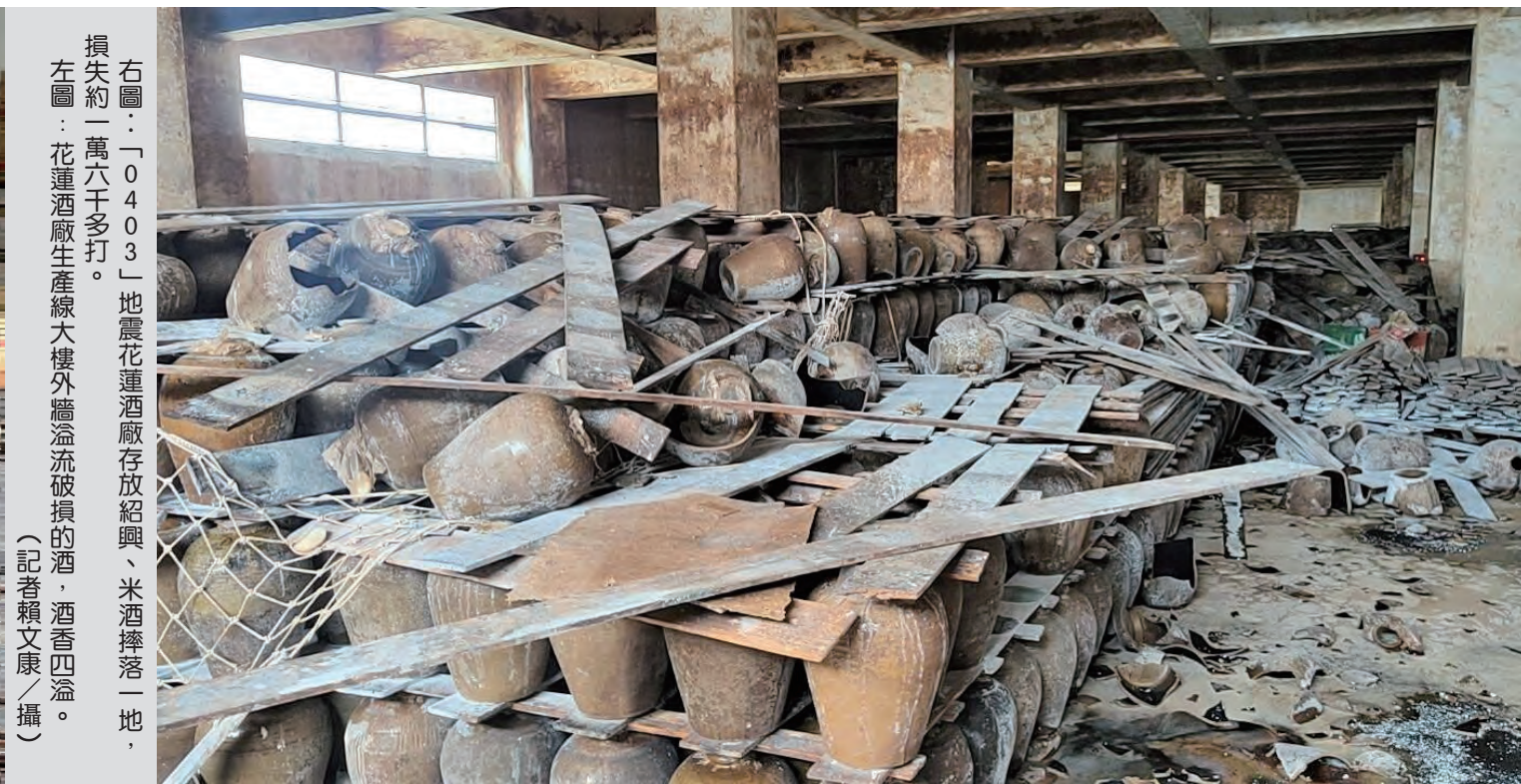
右圖：「0403」地震花蓮酒廠存放紹興、米酒酒桶一地，損失約一萬六千多打。 左圖：花蓮酒廠生產線大樓外牆溢流破損的酒、酒香四溢。