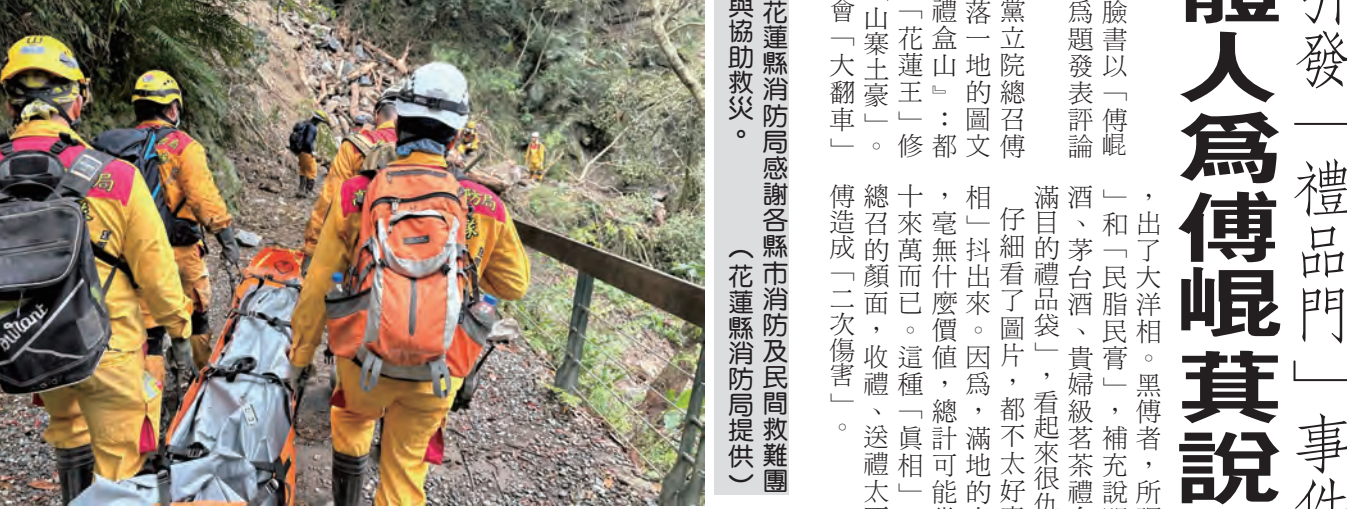
花蓮縣消防局感謝各縣市消防及民間救災支援與協助救災。

記者賴文康/報導 0403地震，包括消防署特種搜救隊、花蓮縣消防局、花蓮縣後備指揮部、基隆市、高雄市、台南市、屏東縣及臺東縣消防局等，共計十二個團體，五百五十一人，搜救犬八隻；花蓮縣消防局八日感謝各縣市消防及民間救災支援與協助。 花蓮縣消防局指出，本月三日上午七點五十分，在花蓮縣政府南東方二十五公里發生規模七點二的有感地震，第一時間造成花蓮縣多處嚴重的災情，受損的建物通報達二百六十四件(其中黃單三十五件、紅單三十二件、不須貼單一百七十七件)，分別由花蓮縣政府等單位展開拆除及實施交通管制。 消防署及各縣市消防支援下，短時間內已有多支隊伍抵達支援，該局經評估後依災區狀況，分配支援單位、人力及裝備器材後，經大家共同努力下，任務短時間內將得救者一脫困，使傷者降至最低，在此特別感謝各縣市消防單位及民間救災團體的支援與協助，也感謝各界善心人士及民間志願者不辭勞苦於第一時間進入災區支援相關救災。 另外，在大魯閣國家公園區內仍有多名遊客迄今下落不明，其中砂卡礑步傳出有人失聯，由於步道沿線有嚴重的落石，救援人員只能採以機具吊掛的方式，由砂卡礑溪下方開闢道路進入步道內進行搜尋的工作。 不只是花蓮市、吉安鄉及秀林鄉多處地區傳出嚴重災情，甚至導致太魯閣國家公園區內八八線中橫公路、台九線蘇花公路大規模崩塌及山崩，造成大批中外遊客不期而至，受困於山崩區。該局第一時間分別於現場成立前進指揮所，同時請各支援縣市消防局攜帶相關裝備器材，至前進指揮所報到，並前往各災區展開救災及搶救遊客。 花蓮縣消防局表示，根據統計各支援單位，包括消防署特種搜救隊、花蓮縣消防局、花蓮縣後備指揮部、基隆市、高雄市、台南市、屏東縣及臺東縣消防局等，共計十二個團體，五百五十一人，搜救犬八隻。另外，台中市及基隆市政府消防局也有來電關心，並表示支援的人員已經足夠，因此納入第二梯人力支援的規劃。 林鄉多處地區傳出嚴重災情，甚至導致太魯閣國家公園區內八八線中橫公路、台九線蘇花公路大規模崩塌及山崩，造成大批中外遊客不期而至，受困於山崩區。該局第一時間分別於現場成立前進指揮所，同時請各支援縣市消防局攜帶相關裝備器材，至前進指揮所報到，並前往各災區展開救災及搶救遊客。