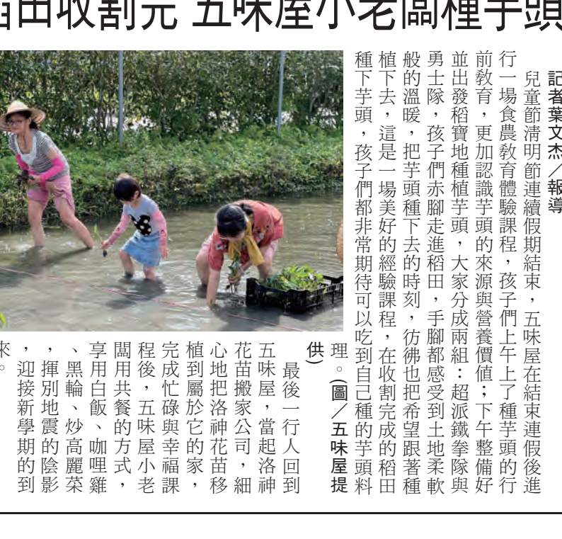
圖：食農教育赤腳體驗，孩子們在稻田裡種植芋頭，體驗農村生活。

記者葉文杰/報導 兒童節清明節連假假期結束，五味屋在結束連假後進行一場食農教育體驗課程，孩子們上午上了種芋頭的行程前教育，更加認識芋頭的來源與營養價值；下午準備好並出發到寶地種植芋頭，大家分成兩組：超派派隊與勇士隊，孩子們赤腳走進稻田，手腳都感受到土地柔軟般的溫暖，把芋頭種下去的時刻，彷彿也把希望跟著種下去，這是一場美好的體驗課程，在收割完的稻田種下芋頭，孩子們都非常期待可以吃到自己種的芋頭料理。 最後一行人回到五味屋，當起洛神花苗搬家公司，細心地將洛神花苗移植到屬於它的家，完成忙碌與幸福課程後，五味屋小老闆用共餐的方式，享用白飯、咖哩雞、黑輪、炒高麗菜，迎接地震的陰影。