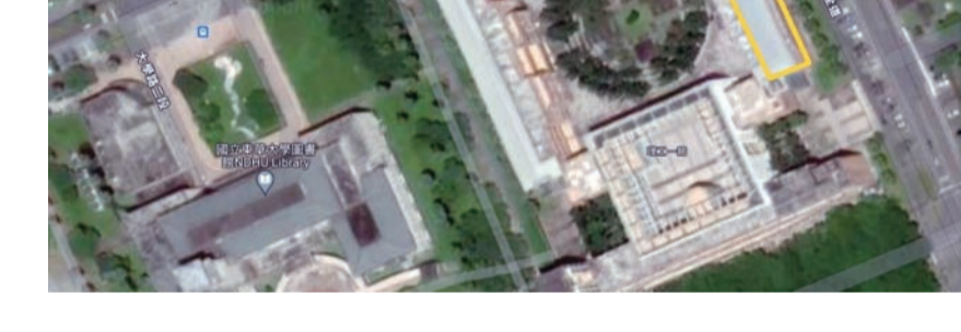
圖：東華大學0403花蓮大地震引起火災，致理工學院一館D棟燒毀，業經花蓮縣建築師公會勘查後判斷結構受損嚴重，將重建，圖為重建示意圖。(東華大學提供)

記者葉文杰/報導 國立東華大學0403花蓮大地震引起火災，致理工學院一館D棟燒毀，業經花蓮縣建築師公會勘查後判斷結構受損嚴重，將重建，圖為重建示意圖。(東華大學提供) 東華大學0403花蓮大地震引起火災，致理工學院一館D棟燒毀，業經花蓮縣建築師公會勘查後判斷結構受損嚴重，將重建，圖為重建示意圖。(東華大學提供) 東華大學0403花蓮大地震引起火災，致理工學院一館D棟燒毀，業經花蓮縣建築師公會勘查後判斷結構受損嚴重，將重建，圖為重建示意圖。(東華大學提供)