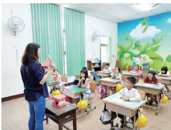
大家仔細聆聽貝氏刷牙法的各個步驟

它們閃閃發亮，被以為是金子；直到陽光隱去之後，人們才體認到，它們其實是沙粒。十年前的一張發票及其他