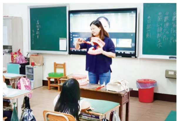
校護說明刷牙的正確擺法