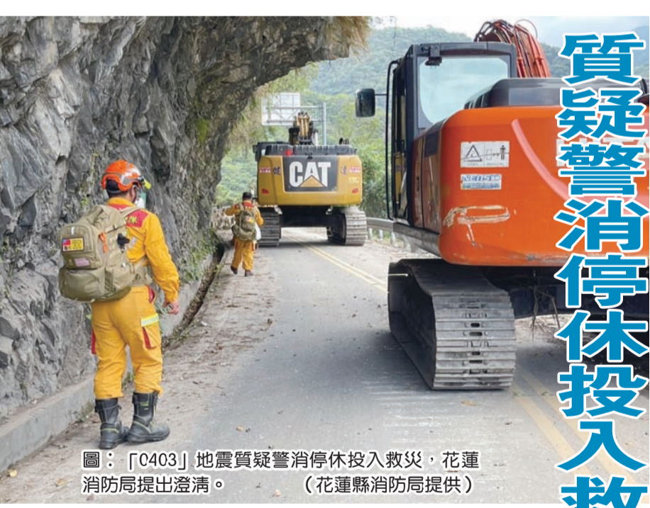
圖：「0403」地震震疑暫停投入救災，花蓮消防局提出澄清。

記者賴文康/報導 花蓮縣消防局針對消防員工作權益促進會指稱，「花蓮消防局工作違法，基層救災做功德」一事，特別提出說明，該局正盡全力投入「0403」地震災區的關鍵時刻，不容有心人士散布不實資訊打擊基層同儕士氣，以正視聽。 花蓮縣消防局指出，所屬人員的勤休制度，都是依照行政院與所屬中央及地方各機關(構)公務員服務法及各項法規辦理，輪休人員的勤休實施要點所訂定，在遇有規模突發或特殊災害緊急召回人員時，可進行所屬人員的召回及停休，並非實際停休人員的勤休及支領超勤加班費，非如消促會所稱以違法方式削減基層權益。 花蓮縣消防局表示，消促會於網路發布「(二十四小時)僅以十二小時計算加班時數，實乃錯誤資訊誤導視聽」。花蓮縣消防局各項訓練均依公務人員請假規則視實際需要給假，並讓所屬人員在正常服役及精進自身技能間權衡是否報名參訓，並無違反相關規定之處。 一切勤休皆按照制度辦理 花蓮縣消防局指出，雖然自身也是地震的受災戶，現階段仍全心致力於救災工作上而無暇自顧，花蓮縣消防局確保基層權益，一切勤休皆按照制度辦理，絕無違法，在救災的關鍵時刻，消防局上下一心，全力拚搏只為守護鄉親，不容有心人士散布不實資訊打擊士氣。