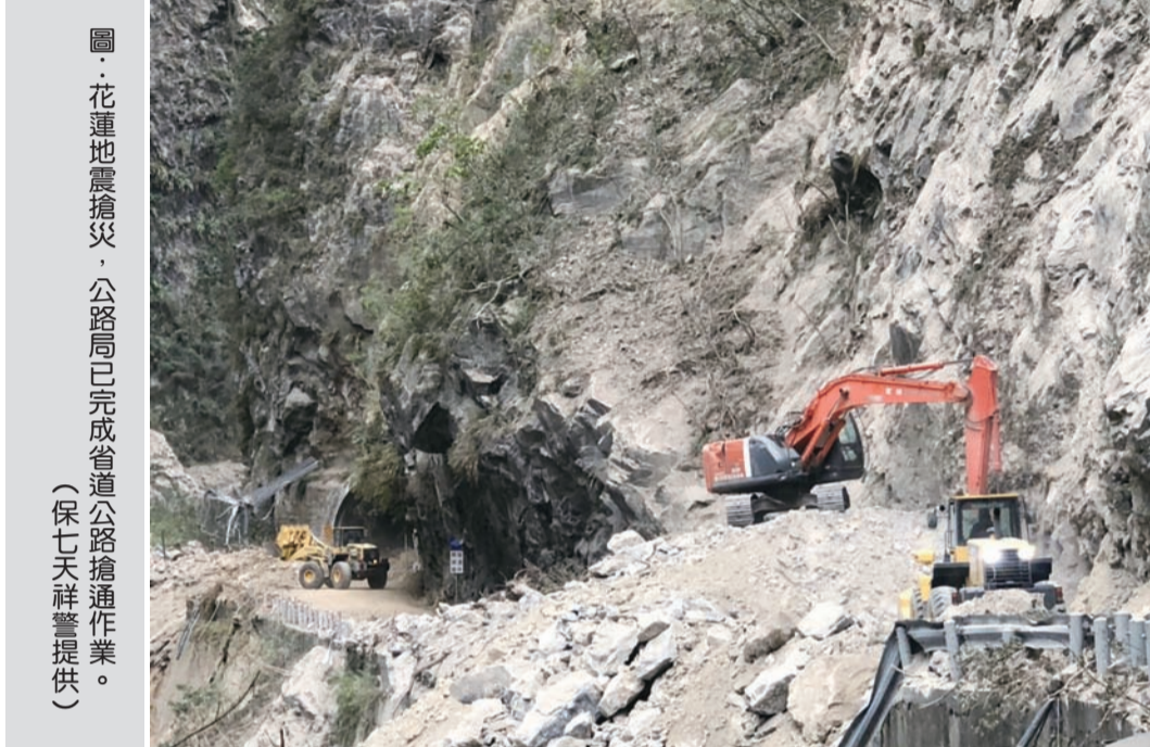
圖：花蓮地震搶災，公路局已完成省道公路搶通作業。