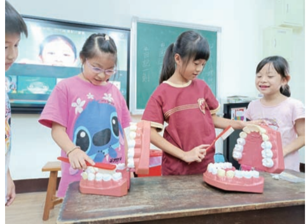
練習清潔牙齒的咬合面