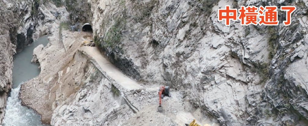
中橫通了 圖:花蓮強震造成中橫公路東段受創嚴重,沿線多處落石坍方,公路局東區養護工程分局太魯閣工務段8日起將進行道路、邊坡災後初期履勘與搶修...