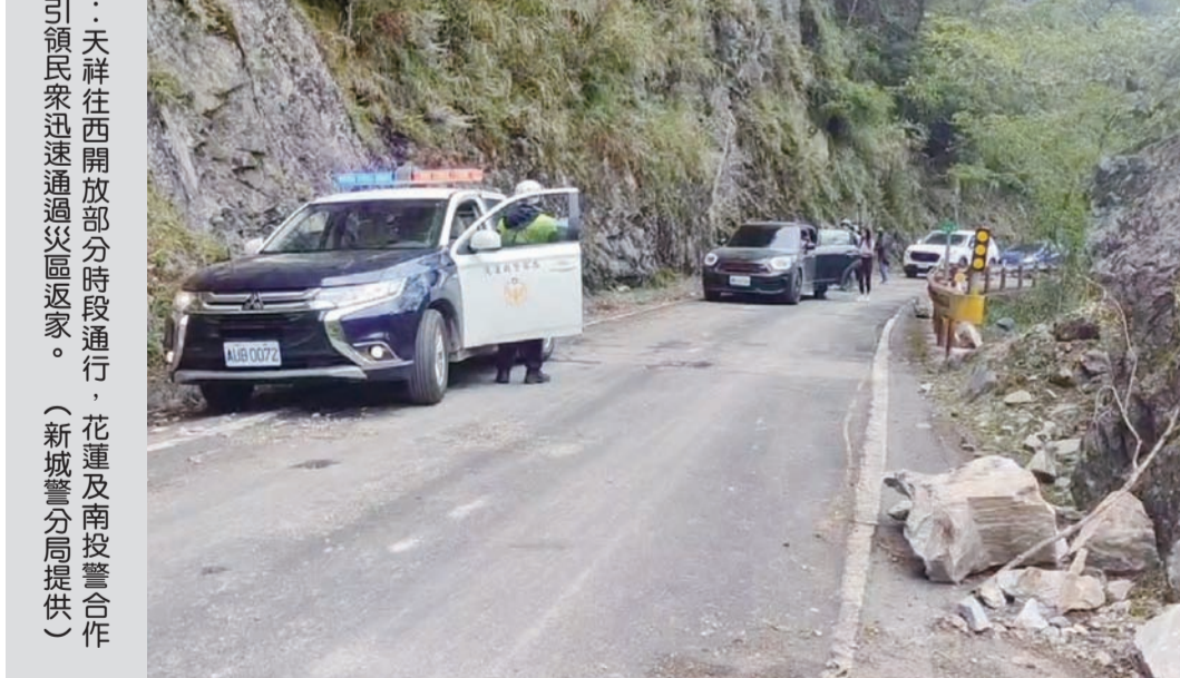
圖：天祥往西開放部分時段通行，花蓮及南投警合作，引領民衆迅速通過災區返家。