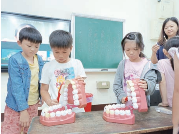
使用模型練習貝氏刷牙法