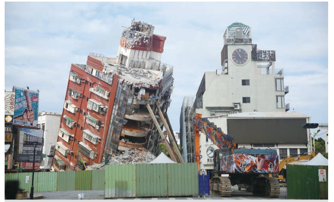
圖：花蓮天王星大樓七日決定將H型鋼梁從二根增加到六根。

記者李柏霖/報導 花蓮天王星大樓日前開始拆除作業，由於除震不斷，造成天王星大樓逐漸增加傾斜，擔心波及周邊建物，從六日清晨開始停工，並加裝多組監視儀進行監測，到了四月七日，現場決議，將H型鋼梁，從二根增加到六根，並於晚間重新開始拆除作業。