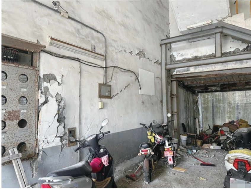
縣府救災計畫詳情仍在規劃

「每位災民的情況不一，縣府將盡力提供協助！」花蓮縣政府社會處表示，簡請需要協助之困境災民，請多利用以下管道：1. 縣府1999專線 2. 縣長電子信箱。同時請留下(1)真實姓名(2)聯絡電話(3)簡述現況和需要的協助，讓相關單位能儘速的聯繫來提供協助。