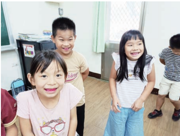
紅色顯示劑代表著牙齒上的牙菌斑