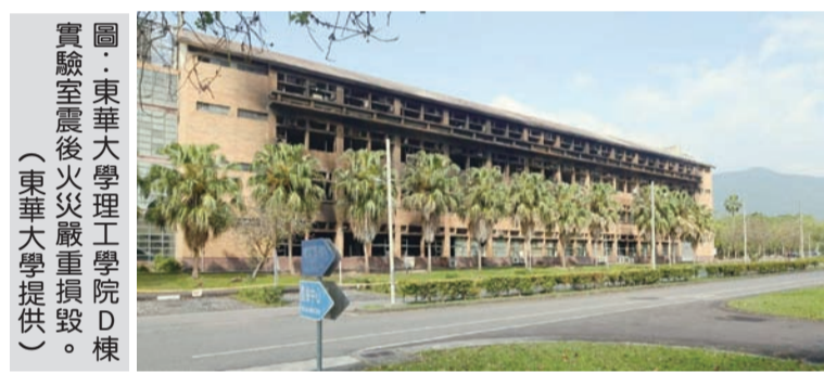
圖：東華大學理工學院D棟實驗室震後火災嚴重損毀。