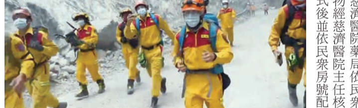
消防局搜救人員冒險挺進台八線搶救人命。

記者田俊浩/報導 搜救人員冒險挺進台八線搶救人命，共同執行台八線沿線失聯及受傷者救援；縣消防局表示，地震重創本縣，但相信在所有搜救人員仍持續全力赴、不畏艱辛的救援工作下，希望大家給予信心及鼓勵，將人命的傷害降至最低，共同努力早日讓生活恢復原狀。