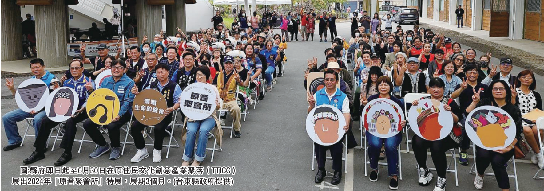
圖：縣府即日起至6月30日在原住民文化創意產業聚落(TTICC)展出2024年「原音聚會所」特展，展期3個月。

記者蕭田田/報導 透過音樂傳承部落生命，一直是台東縣政府致力發展、保存的重要根基。縣府即日起展至6月30日在原住民文化創意產業聚落(TTICC)展出2024年「原音聚會所」特展，展期3個月。饒慶鈴縣長表示，除了展出臺東金曲成果、早期原民黑膠作品，也展出部落文健站採集音樂107首，另辦理工作坊及推廣活動等，帶領民衆用聽的、用看的、用玩的、用創作感受臺東原住民音樂人的豐沛能量。