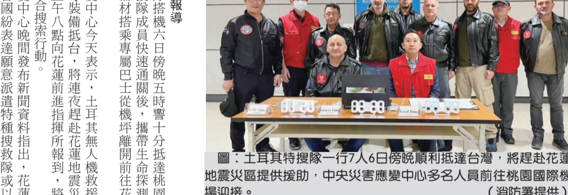
土耳其特搜隊一行7人6日晚順利抵達台灣，將趕赴花蓮地震災區提供援助，中央災害應變中心多名人員前往桃園國際機場迎接。

記者田俊浩/報導 土耳其特搜隊搭機六日晚五時十分抵達桃園機場，七名特搜隊成員快速通過關卡，攜帶生命探測儀、無人機等器材搭乘專車由巴士從機場開往花蓮地震災區。