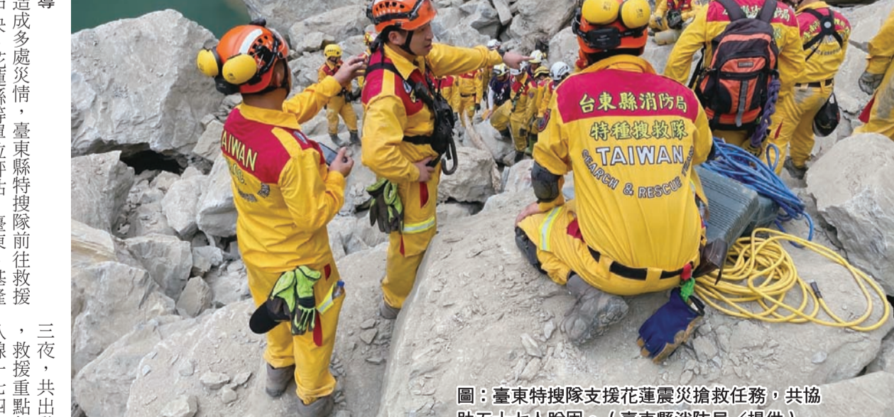
圖：臺東特搜隊支援花蓮震災搶救任務，共協助五十七人脫困。

花蓮縣三日晚間發生多處災情，臺東縣特搜隊前往救援，六日上午九時許經中央、花蓮縣等單位評估，臺東、基隆等縣市特搜隊不需再支援，臺東縣特搜隊任務完成，九時三十分撤離現場，陸續於下午一時許返回本縣特搜隊駐地。 經中央、花蓮縣暨各支援隊支援，高雄市留二十名人員外，其餘縣市特搜隊不需再支援，返回駐地待命。 臺東縣消防局指出，截至六日花蓮縣災區僅剩一處，因搶救作業現場下雨，起霧及餘震不斷，且加上無法觀察上方落石情況，評估現場除震震感重外，且無安全，經花蓮縣消防局應變中心徐棟輝局長召開救援隊長聯會會議，決議待合適時機再由花蓮、高雄市結合國軍，並調派重機具前往開挖救援。 臺東縣特搜隊此次支援花蓮震災救援行動共計執行四天