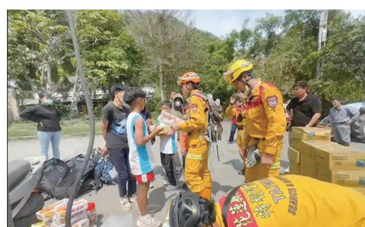
0403強震第4天，中橫置留置人數四百零五人、失聯八人。

記者田俊浩/報導 據中央災害應變中心六日下午三時至四時統計，人員失聯八人其中本國籍六人、外國籍二人。中橫置留置人數四百零五人，分別是晶英酒店三十一人、晶英酒店加拿大籍遊客、天祥天主堂一人、台電天祥站一人、天祥青年活動中心十一人、西貢國小十四名學生老師十五人、祥德寺十一人。