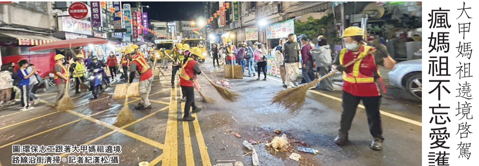
圖:環保志工跟著大甲媽祖遶境路線沿街清掃。

王必勝說，寶林廚師除了手、糞便中檢出邦克列酸，昨天請他到醫院進行血液跟尿液採檢，結果都是陰性。 推測沒有直接吃到問題食物，而是料理過程中接觸，甚至吃到非常微量，但已經大到能測出，逐步檢查顯示身體狀況正常穩定。 王必勝提到，根據檢方提供資料，衛福部4月4日再度前往這名廚師另2個住處進行採檢，其中1處是環境採檢，林德河店廚師家，因這2人交友友好，所以不會過問任何一點，各採檢12件、15件環境檢體。衛生福利部昨晚公布，統計至下午5時30分，台北市信義區寶林茶室食物中毒案累計通報共34例，其中2例死亡、4人在加護病房、3人在一般病房、25人返家休養。 與昨天通報情況相較，沒有新增通報個案，但昨天新增1例30多歲女性食用炒麵後發病。王必勝說，經採檢這名患者邦克列酸(原稱米酵菌酸)呈現陰性。 疾管署統計，包括前述採檢陰性個案在內，共33人採檢邦克列酸，累計32人陽性。 王必勝分析檢驗結果指出，可見現在整個案情仍集中在3月19日到24日期間，曾於寶林A13店食用標條或河粉者，採檢幾乎都是陽性，顯示標條在這件事上扮演重要角色。因寶林廚師手部驗出邦克列酸，衛福部3月30日赴廚師家進行環境採檢，帶回14件檢體，檢驗結果均為陰性，沒有培養出細菌。