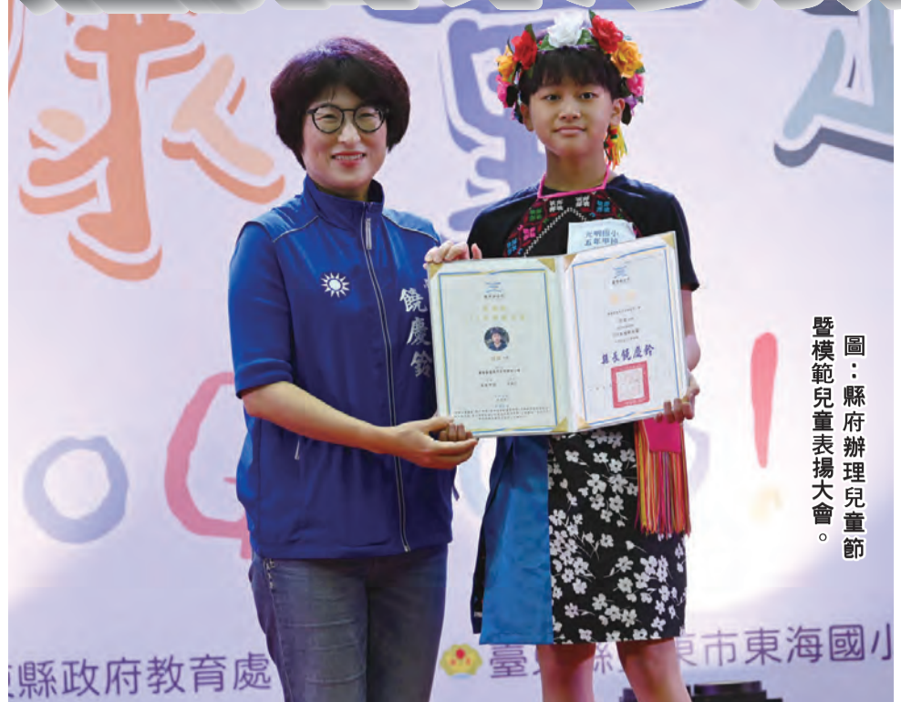
圖：縣府辦理兒童節暨模範兒童表揚大會。

記者陳盈貞/報導 慶祝一三二年兒童節，臺東縣政府在縣立體育館舉辦兒童節暨模範兒童表揚大會，邀請臺東市與卑南鄉各私立國小、臺東市各私立幼兒園共四百八十四位模範兒童參加，由縣長饒慶鈴親自頒發獎狀。