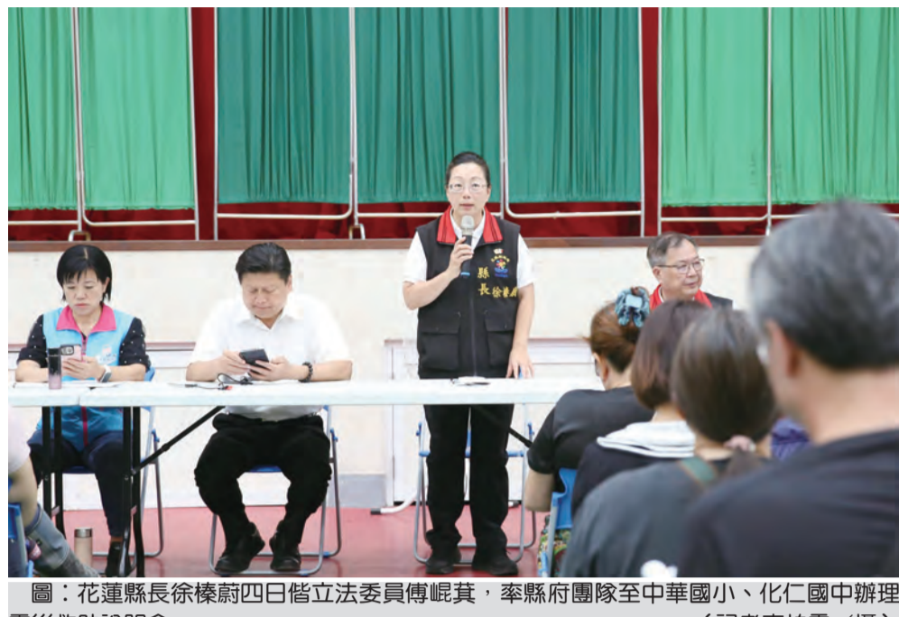
圖：花蓮縣長徐榛蔚四日偕立法委員傅崐萁，率縣府團隊至中華國小、化仁國中辦理震災救助說明會。