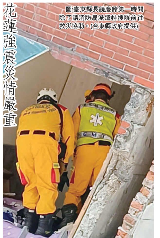
圖：台東縣長饒慶鈴第一時間指示請消防局派遣特搜隊前往救災協助。(台東縣政府提供)

記者蕭道田/報導 3日花蓮近海發生規模7.2地震，花蓮及花蓮縣傳出災情，臺東縣長饒慶鈴第一時間指示請消防局派遣特搜隊前往救災協助。(台東縣政府提供)