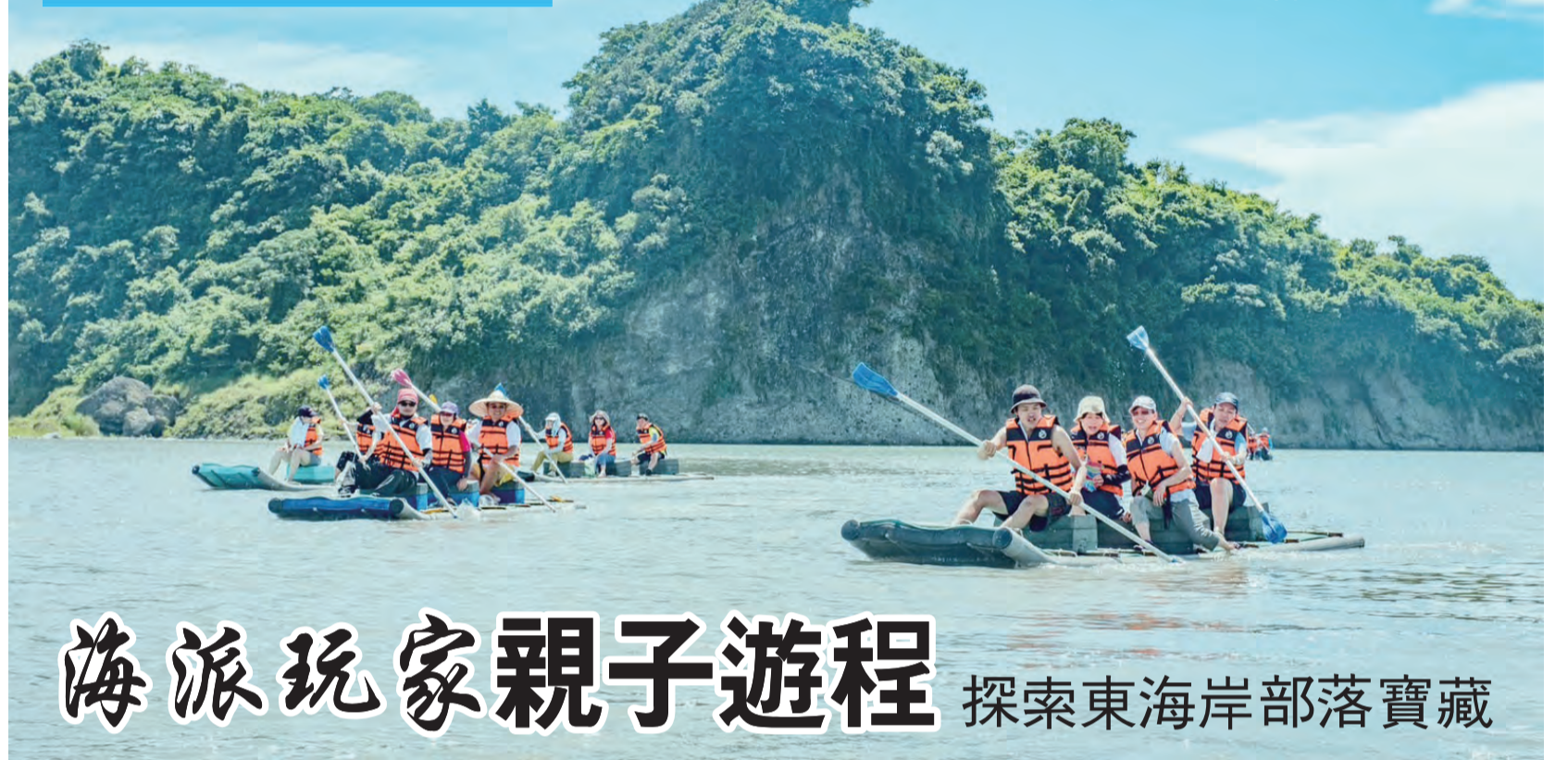
圖：東管處推親子遊程，探索東海岸部落寶藏。