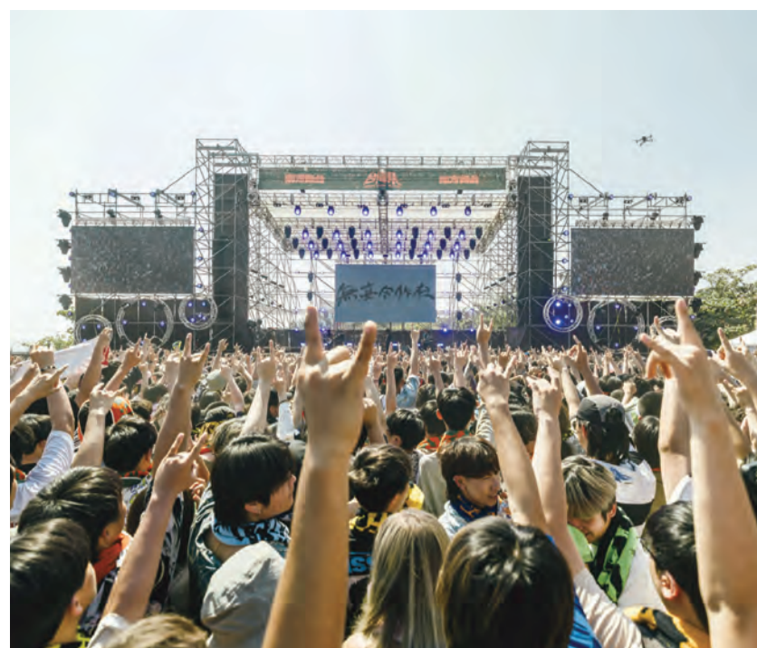
圖：屏東音樂品牌「台灣祭」4日起一連3天在墾丁大灣遊憩區登場，5大舞台、135組樂團接力嗨唱，吸引大批人潮共襄盛舉。

另外，無法前來共襄盛舉的民眾，也可透過台灣祭粉絲頁（Facebook）及三立新聞網、三立新聞網YT、Vidol YT、完全娛樂YT等平台線上直播，一起欣賞精彩表演；活動演出表可上台灣祭官方網站或臉書查詢。