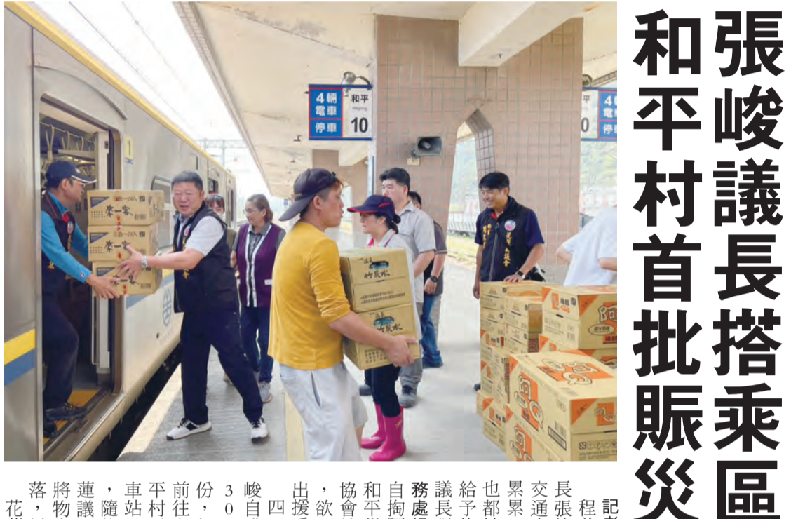
張峻議長搭乘區間車送暖 和平村首批賑災物資抵達

記者劉怡倫/報導 蘇花公路三日因地震中斷，花蓮縣政府隨即宣布，啟動蘇花公路中斷農產品運費補助。縣長徐榛蔚表示，地震災區非人能預期，災中的搶救與災後的復建更顯得重要，為照顧縣內農友，縣府於災區當下，即刻啟動運費補助措施，減輕農友因蘇花公路中斷，造成農產品運輸成本增加之負擔，給予農友全力的支持。 徐榛蔚說明，凡農民團體辦理蔬果共同運銷，改行經南迴公路、鐵路或海運等進行轉運，以供應臺北等批發市場者，於蘇花公路中斷增加之運費可依花蓮縣政府「花蓮縣政府蘇花公路中斷農產品運費補助作業程序」及農業部補助標準進行補助。 她也同時感謝立法委員傅崐萁持續關心，花蓮農產受災狀況，經積極向農業部爭取毛豬及漁產品後，將新增補助花東毛豬及農產品運輸產品系統路所增加運費，感謝農業部與花蓮縣政府一同全力減輕農友負擔。 縣府農業處長陳淑惠說明，花東地區農民團體辦理蔬果共同運銷供應臺北(一、二市)、新北(三重、板橋)、桃園果菜批發市場及生鮮農產品宅配者，補助標準為依運輸契約所訂運費內容調整，每公斤補助最高以一點三元為限。 花蓮地區漁(農)民團體辦理漁產品共同運銷，因蘇花公路中斷改行經南迴公路供應臺北、三重、蘇澳等批發市場者，每公斤補助金額最高達四元。 花蓮地區農民透過農會、合作社等農民團體，辦理肉豬共同運銷供應宜蘭、新北或桃園等肉品市場者，在蘇花公路中斷之日起至恢復通行，運輸車輛日期間所增加的運費，由農業部核實補助，每車次以新台幣八千元為上限。 家禽產業部分，花蓮地區農民透過農會、合作社等農民團體，辦理家禽共同運銷，供應台北市環南市場，或新北市家畜批發市場者，在蘇花公路中斷之日起至恢復通行運輸車輛日期間所增加運費成本，也會由農業部核實補助，每車次以八千元為上限。