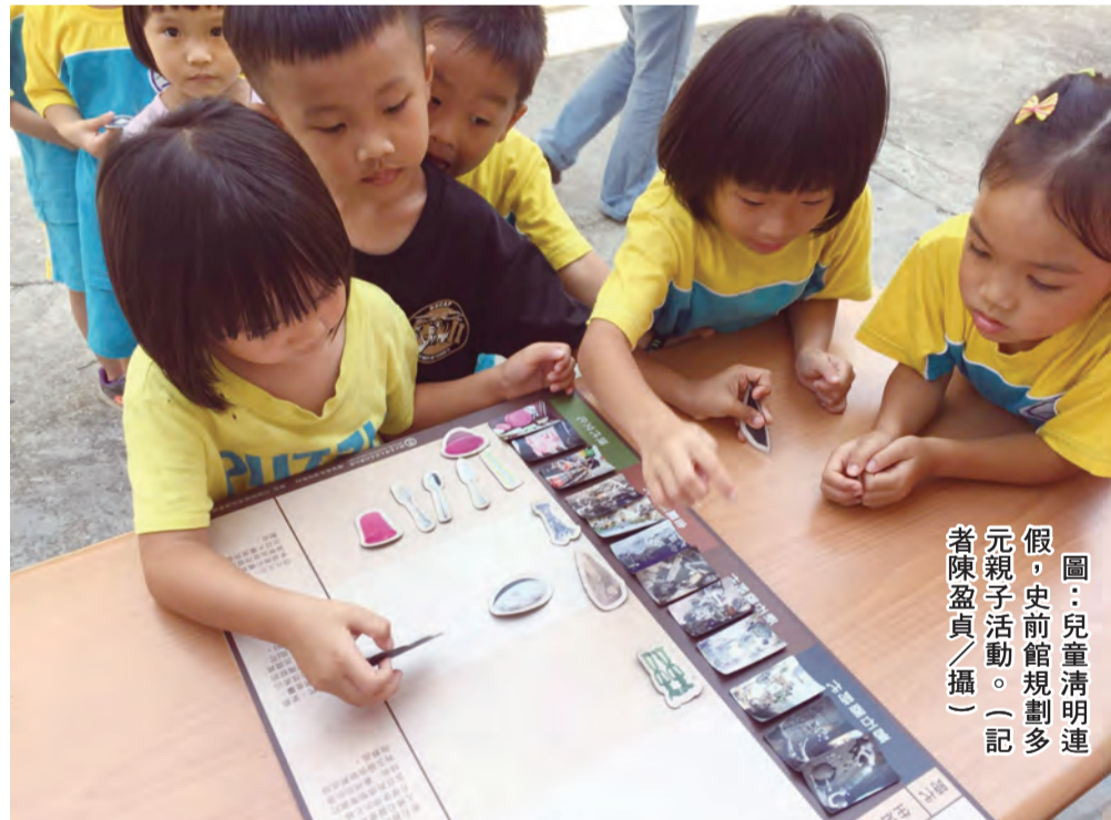
圖：兒童清明連假，史前館規劃多元親子活動。

南昌路停車場交通指引：北上：台東市中華路->右轉南昌街->右轉進入停車場->直行離開至臺南市復興國小小號。南下：台東市中華路->左轉南昌街->右轉進入停車場->直行離開至臺南市復興國小小號。