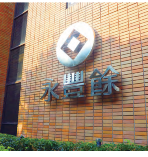
永豐餘投控與旗下元太科技聯合捐贈1000萬協助花蓮重建

永豐餘投控與旗下元太科技聯合捐贈1000萬協助花蓮重建。縣長徐榛蔚表示，地震災區非人能預期，災中的搶救與災後的復建更顯得重要，為照顧縣內農友，縣府於災區當下，即刻啟動運費補助措施，減輕農友因蘇花公路中斷，造成農產品運輸成本增加之負擔，給予農友全力的支持。 徐榛蔚說明，凡農民團體辦理蔬果共同運銷，改行經南迴公路、鐵路或海運等進行轉運，以供應臺北等批發市場者，於蘇花公路中斷增加之運費可依花蓮縣政府「花蓮縣政府蘇花公路中斷農產品運費補助作業程序」及農業部補助標準進行補助。 她也同時感謝立法委員傅崐萁持續關心，花蓮農產受災狀況，經積極向農業部爭取毛豬及漁產品後，將新增補助花東毛豬及農產品運輸產品系統路所增加運費，感謝農業部與花蓮縣政府一同全力減輕農友負擔。 縣府農業處長陳淑惠說明，花東地區農民團體辦理蔬果共同運銷供應臺北(一、二市)、新北(三重、板橋)、桃園果菜批發市場及生鮮農產品宅配者，補助標準為依運輸契約所訂運費內容調整，每公斤補助最高以一點三元為限。 花蓮地區漁(農)民團體辦理漁產品共同運銷，因蘇花公路中斷改行經南迴公路供應臺北、三重、蘇澳等批發市場者，每公斤補助金額最高達四元。 花蓮地區農民透過農會、合作社等農民團體，辦理肉豬共同運銷供應宜蘭、新北或桃園等肉品市場者，在蘇花公路中斷之日起至恢復通行，運輸車輛日期間所增加的運費，由農業部核實補助，每車次以新台幣八千元為上限。 家禽產業部分，花蓮地區農民透過農會、合作社等農民團體，辦理家禽共同運銷，供應台北市環南市場，或新北市家畜批發市場者，在蘇花公路中斷之日起至恢復通行運輸車輛日期間所增加運費成本，也會由農業部核實補助，每車次以八千元為上限。