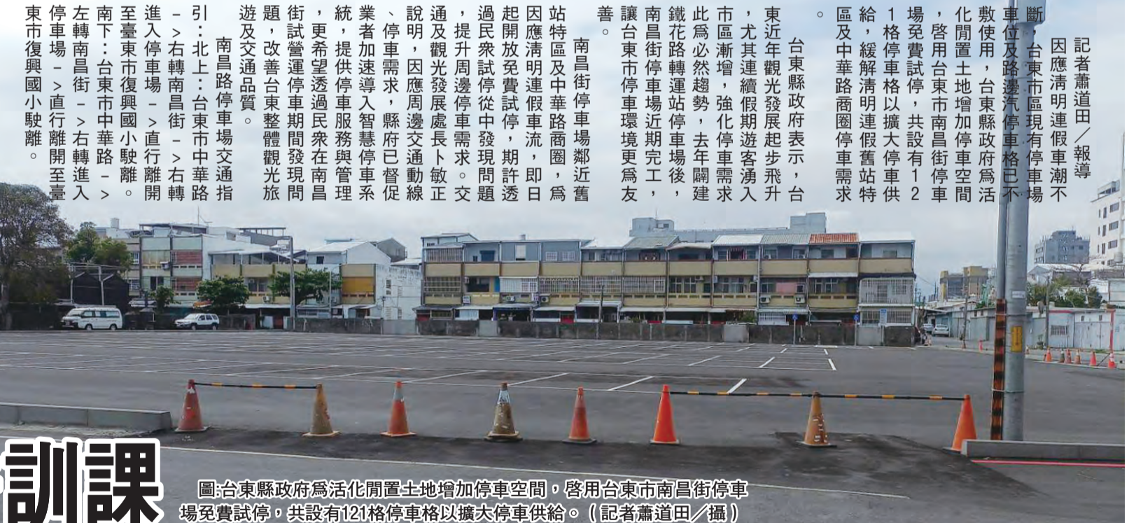
圖：台東縣政府為活化閒置土地增加停車空間，啟用台東市南昌街停車場免費試營運，共設有121格停車格以擴大停車供給。

記者蕭道田/報導 因應清明連假車潮不斷，台東市區現有停車場車位及路邊停車格已不敷使用，台東縣政府為活化閒置土地增加停車空間，啟用台東市南昌街停車場免費試營運，共設有121格停車格以擴大停車供給，緩解清明連假車站特區及中華路商圈停車需求。