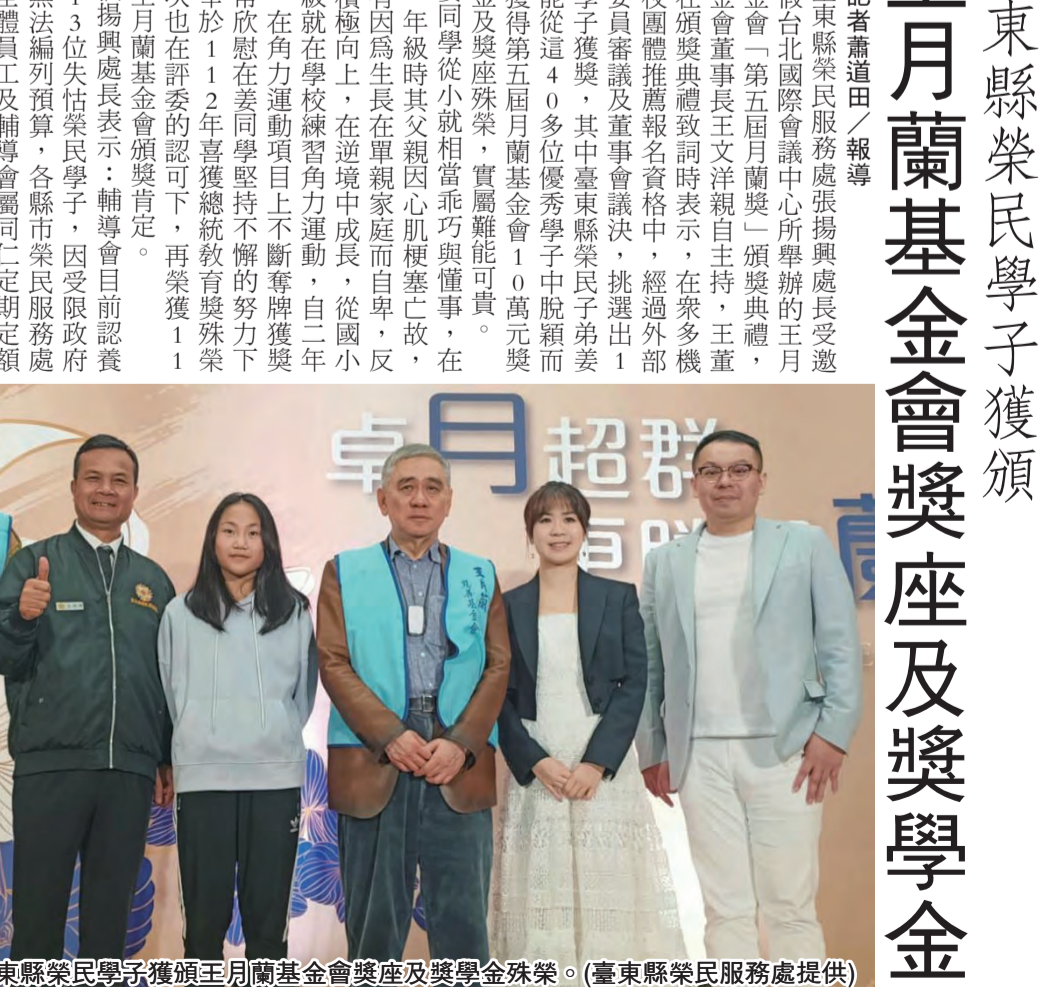
圖：台東縣榮民學子獲頒王月蘭基金會獎座及獎學金。

記者蕭道田/報導 台東縣榮民服務處張慶興處長受邀出席假台北國際會議中心所舉辦的王月蘭基金會「第五屆王月蘭獎」頒獎典禮，由基金會董事長王月蘭親自主持，王處長在頒獎典禮致詞時表示，在眾多機關學校團體推薦報名資格中，經過外部評審委員會及董事會議決，挑選出19位學子獲獎，其中台東縣榮民子弟獎助學金獎座4名，其餘優秀學子中脫穎而出，獲得第五屆王月蘭獎獎學金10萬元獎助學金及獎座，實屬難能可貴。 王月蘭處長表示，輔導會目前認養有613位失依榮民學子，因受限於政府機構無法編列預算，各縣市民定期額捐款認養；非常感謝王月蘭慈善基金會不僅致力於社會公益，且每年百萬經費善款長期捐助，期望這些學子不受環境影響，能夠無後顧之憂安心求學。 以台東縣為例，台東榮服現有受助學童計35名，前年由同學自台灣大學畢業後投入職場，王月蘭則在去年獲得總統教育獎肯定，這些失依學童都是輔導會關懷的心肝寶貝，惟因每月定期額認養捐助有限，認養金收支常有人不敷出窘況，為完善照顧起傳遞大愛。 願失依榮民子女皆能不受限於家庭環境，向完成學業與追求理想的願望邁進，十分歡迎各界善心人士發揚助人精神，共同加入認養行列一起傳遞大愛。