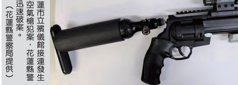
圖：花蓮市立殯儀館接連發生兩起葬儀社空氣槍犯案，花蓮縣警察局務求迅速破案。