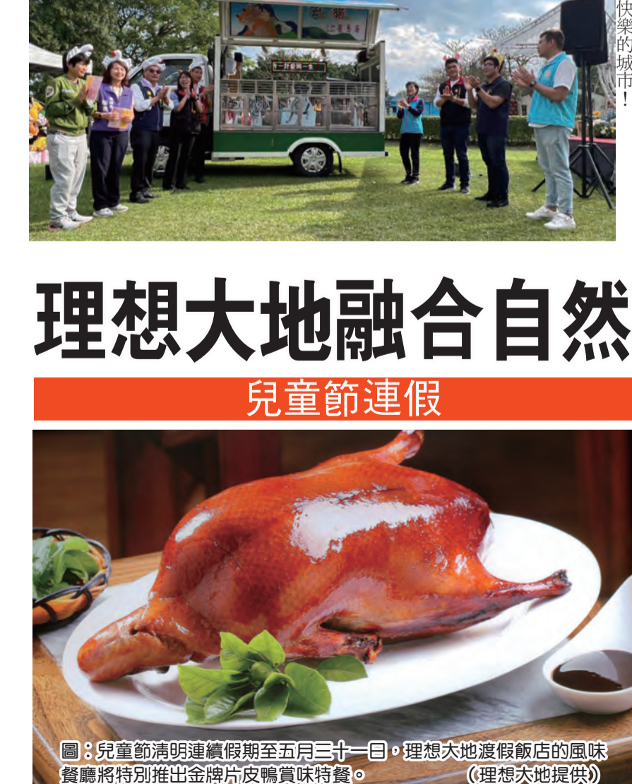
圖：兒童節清明連續假期至五月三十一日，理想大地渡假飯店的風味餐廳將特別推出金牌片皮鴨饗宴特餐。