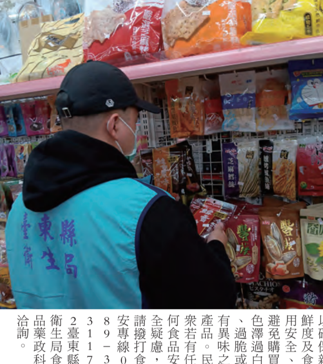
圖：台東縣府抽驗清明食品16件皆與規定相符，提醒選購應景食品。

記者蕭道田/報導 清明節將至，為感念祖先、慎終追遠，家家戶戶準備祭祀，各式應景食品也上市，台東縣政府為維護民眾節慶食品之安全衛生與品質，針對縣轄內各超市、大賣場、傳統市場等節慶食品抽驗，計有豆干、祭祀糕餅、素三牲禮、春捲皮等共計16件，經檢驗防腐劑1.2項、甲醛、二氧化硫、動物性成分分析等項目，檢驗結果均符合規定，相關抽驗產品及廠商資訊詳參閱台東縣衛生局網站 ( https://www.tai.gov.tw/ )。