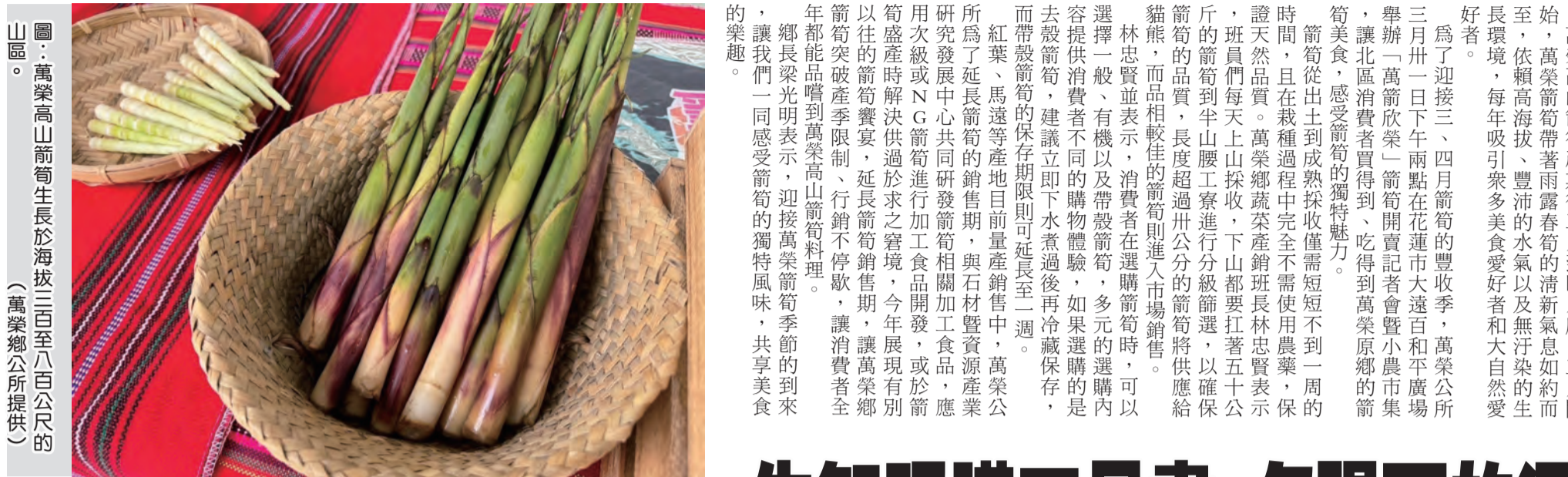
萬榮高山箭筍生長於海拔三百至八百公尺的山區。

為了迎接三、四月箭筍的豐收季，萬榮公所昨日下午兩點在花蓮市大遠百和平廣場舉辦「萬榮箭筍」箭筍開賣記者會暨小農市集，讓北區消費者買得到、吃得到萬榮原鄉的箭筍美食，感受箭筍的獨特魅力。