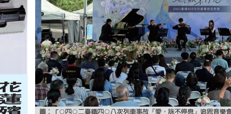
圖：吉安警分局表揚金融機構行員阻詐騙有功人員。