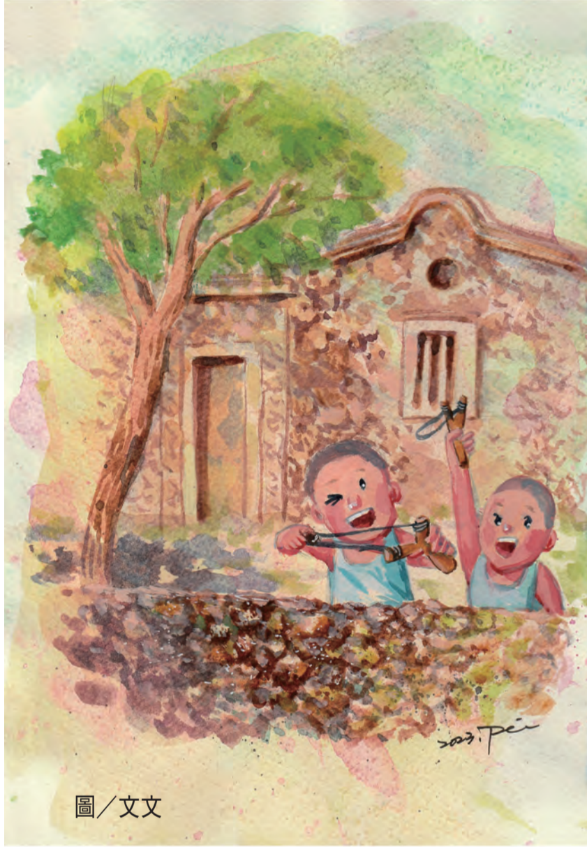
圖 / 文文

兩個貪吃的弟弟眼中自然看不到草菇，但屋內那顆飽滿發亮的芭樂，讓他們想到就口水。某日他們趁著媽媽外出時，取下其中幾片木板，然後我踩在他們背上，鑽入屋內偷拿芭樂。