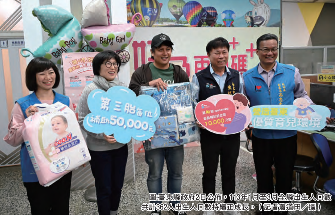
圖：台東縣政府2日公佈，113年1月至3月全縣出生人口數共計362人出生人口數持續正成長。

聽慶鈴指出，孩子是我們的寶貝和未來的希望，縣府從提高生育補助、坐月子餐、育兒指導、建構安心懷孕、創建願生能養的友善環境，及提升慢經濟效應的健康生活城市等，期待孩子們在健康幸福的台東快樂成長。