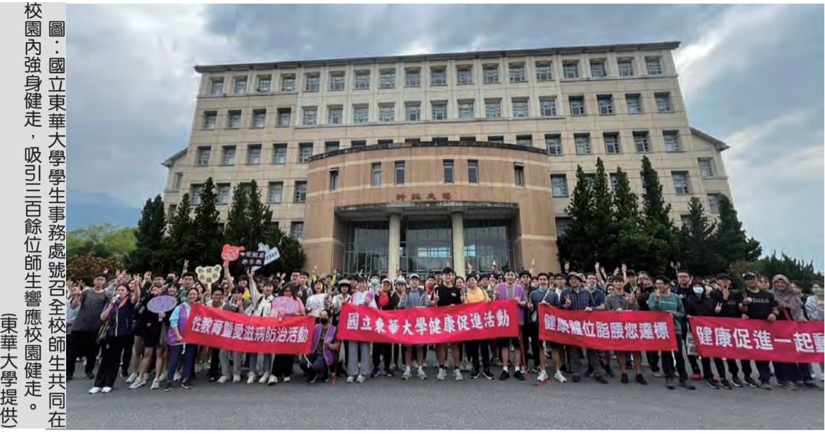
國立東華大學學生事務處處長、全體師生共同在校園內強身健走，吸引三百餘位師生響應校園健走。

記者葉文杰/報導 國立東華大學學生事務處三月三十日號召全體師生共同在校園內強身健走，吸引三百餘位師生響應。本次校園健走設計五公里行程，特別加入在校園七處進行闖關遊戲，耗時約二點五小時，每位師生平均燃燒掉八百二十五大卡熱量，健走後每個仍精神抖擻，活力滿滿，本次活動在提升身心健康方面，成效豐碩。