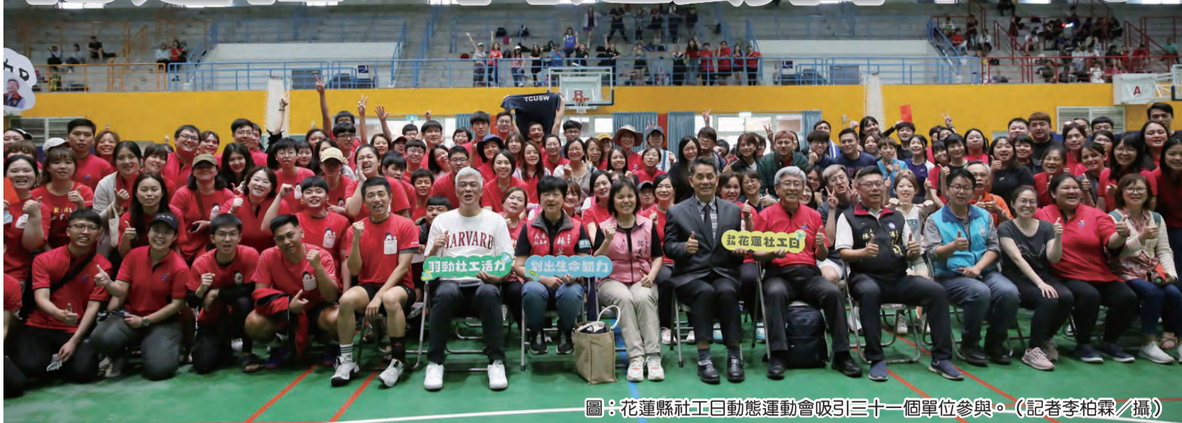
圖：花蓮縣社工日動態運動會吸引三十一個單位參與。