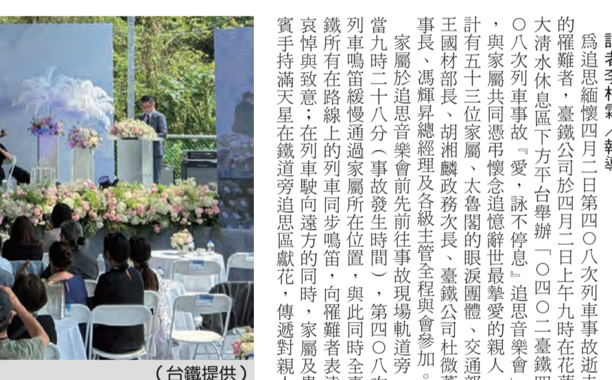
圖：「0402臺鐵408次列車事故」愛，詠不停息追思音樂會。