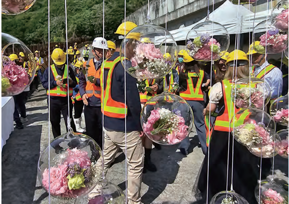
圖：台鐵2日在太魯閣號408次列車事故地舉辦3週年追思會，台鐵人員、家屬獻花，並在留言板寫上滿滿的思念和鼓勵。（新聞見3版·民眾提供）